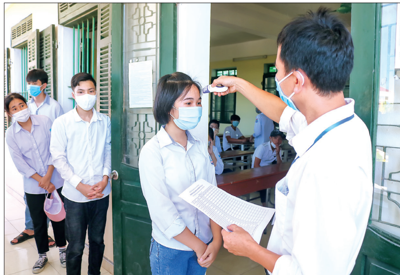
Thí sinh được đo thân nhiệt trước khi vào phòng thi.