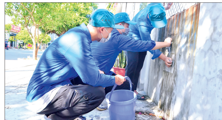
Đoàn viên, thanh niên xóa quảng cáo, rao vặt trái phép tại xã Phú Xuân.

thực hiện công trình, phần việc tham gia xây dựng văn minh đô thị; xây dựng các tuyến đường với tiêu chí: sáng - xanh - sạch - đẹp - văn minh - an toàn.