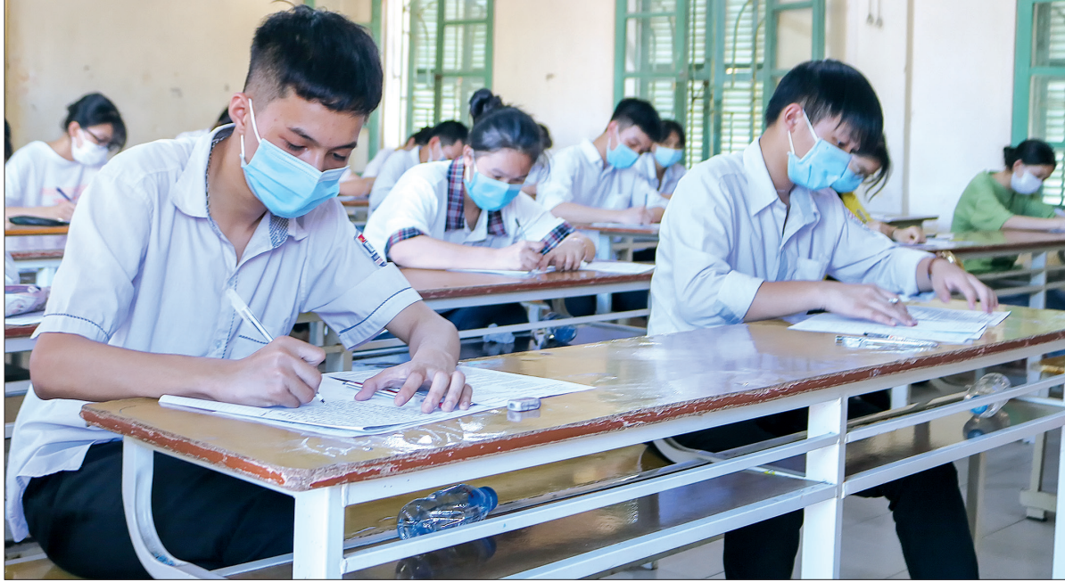
Thí sinh làm bài thi tuyển sinh vào lớp 10 tại điểm thi Trường THPT Nguyễn Trãi (Vũ Thu).

Giữa thời tiết nắng nóng kỷ lục và diễn biến phức tạp của dịch Covid-19, chiều ngày 20/6, gần 21.000 thí sinh tại 28 điểm thi trên địa bàn tỉnh đã kết thúc môn thi cuối cùng (Tiếng Anh) và hoàn thành kỳ thi tuyển sinh vào lớp 10 THPT năm học 2021 - 2022 nghiêm túc, đúng quy chế.