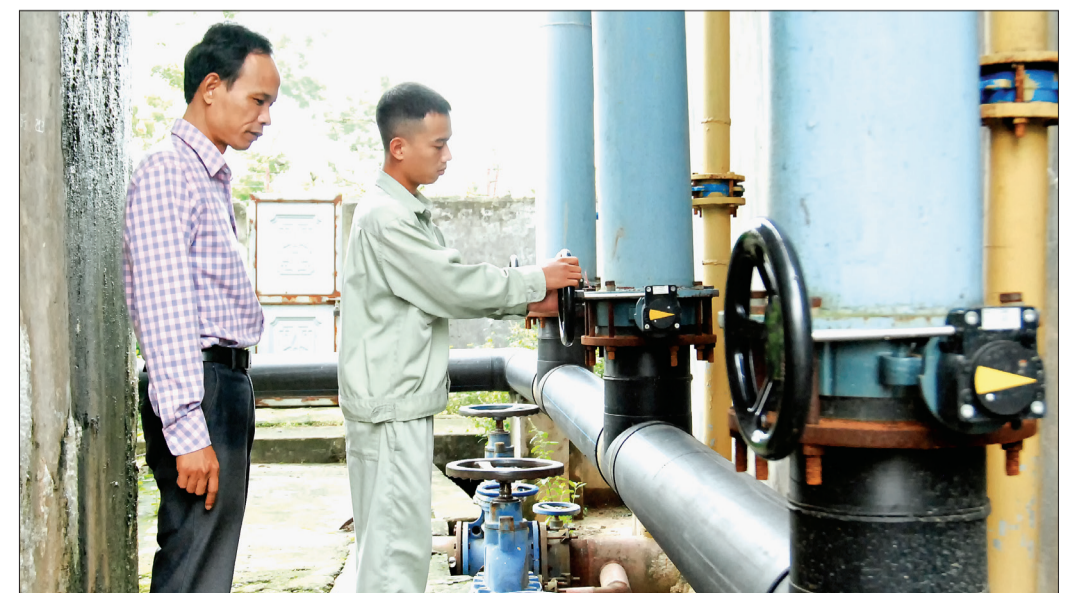
Thường xuyên kiểm tra hạ tầng kỹ thuật giúp Xí nghiệp nước Vũ Thư bảo đảm cấp nước ổn định và giảm tỷ lệ thất thoát.