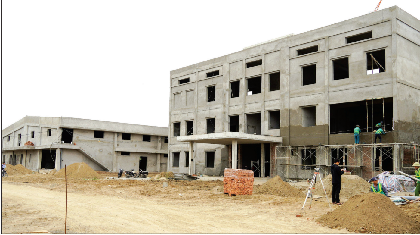
Công ty Cổ phần Dược phẩm PHARBACO Thái Bình xây dựng nhà máy bào chế dược phẩm tại cụm công nghiệp An Ninh.

Năm 2023, huyện Tiền Hải tập trung chỉ đạo quyết liệt, quyết tâm hoàn thành nhiệm vụ giải phóng mặt bằng (GPMB), nhất là tại các dự án trọng điểm của tỉnh triển khai trên địa bàn huyện. Nhờ làm tốt công tác GPMB đã tạo thuận lợi cho các dự án được triển khai và hoàn thành theo đúng kế hoạch, tạo động lực thu hút đầu tư, phát triển kinh tế.