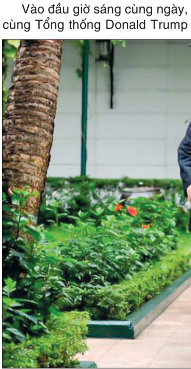
Tổng thống Donald Trump và Chủ tịch Kim Jong-un trò chuyện thân mật trong khuôn viên khách sạn Metropole.

việc rằng sự kiện này đã bị hủy và Tổng thống Trump sẽ quay trở lại khách sạn để có cuộc họp báo vào lúc 2 giờ chiều giờ địa phương. Bà cũng từ chối đưa ra bình luận khi được hỏi về lễ ký kết văn kiện chung, ban đầu được dự kiến diễn ra lúc 2 giờ chiều.