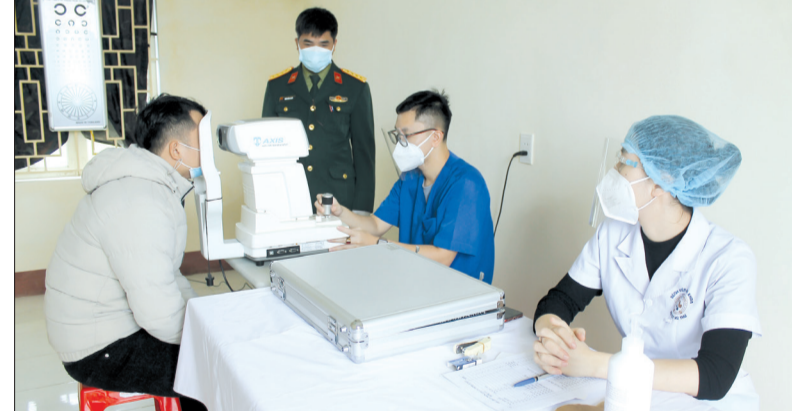
Khám tuyển nghĩa vụ quân sự tại Trạm Y tế xã Minh Quang (Vũ Thư).

Sáng ngày 26/11, tại xã Minh Quang, Hội đồng Nghĩa vụ quân sự (NVQS) huyện Vũ Thư tổ chức khám tuyển NVQS năm 2022.