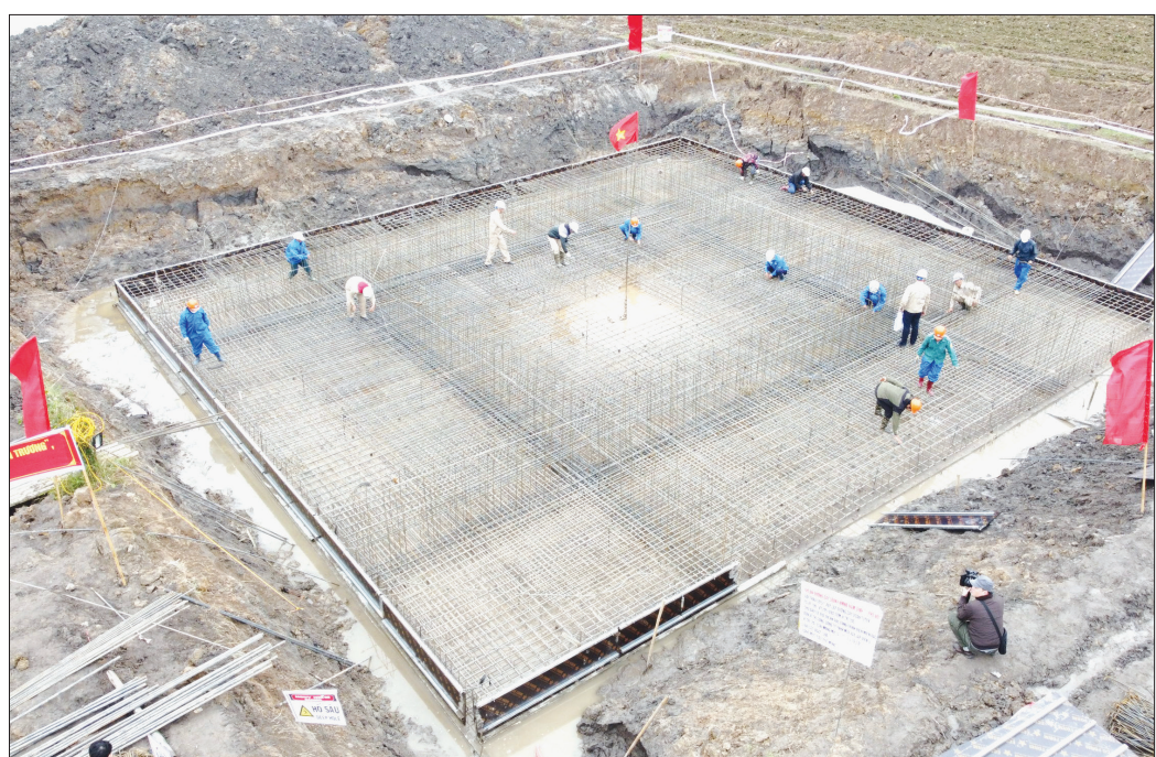
Khí thế thi đua làm việc trên công trường đường dây 500kV mạch 3 tại Thái Bình luôn sôi nổi.

Chia sẻ áp lực và khó khăn với Tập đoàn Điện lực Việt Nam, cấp ủy, chính quyền và nhân dân tỉnh Thái Bình đã đồng hành, huy động tổng lực hỗ trợ, tháo gỡ vướng mắc và thúc đẩy tiến độ triển khai dự án nhanh nhất có thể.