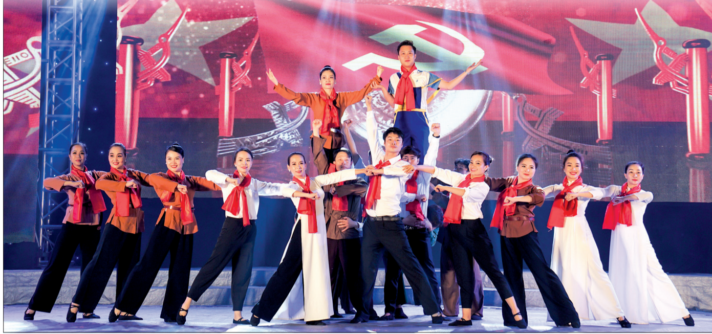
Chương trình nghệ thuật đặc biệt kỷ niệm 133 năm ngày thành lập tỉnh Thái Bình.