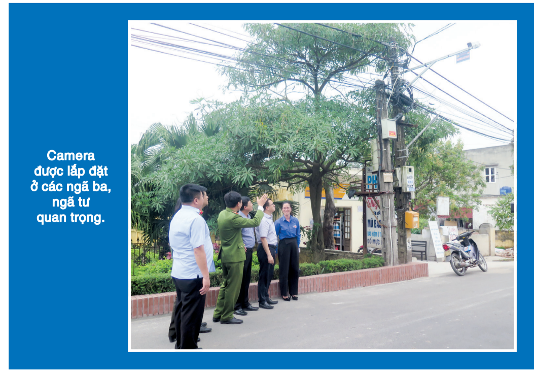
Camera được lắp đặt ở các ngã ba, ngã tư quan trọng.