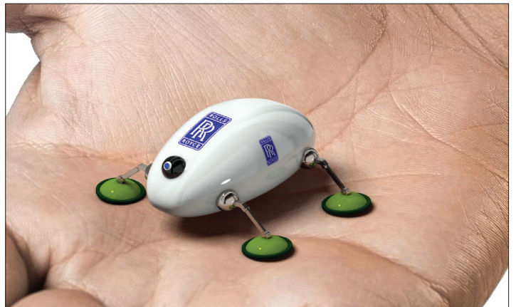
Rô-bốt của hãng Rolls-Royce chỉ nằm gọn trong lòng bàn tay con người.

Nhờ sự trợ giúp của các chuyên gia về rô-bốt từ Đại học Ha-vớt và Nốt-ting-ham, Tập đoàn Kỹ thuật hàng không Rolls-Royce (Anh) đã chế tạo thành công rô-bốt kích thước nhỏ, thay các kỹ sư làm việc trong điều kiện không gian giới hạn của động cơ máy bay. Hãng còn có kế hoạch lắp đặt ca-mê-ra lên trên mỗi rô-bốt, cho phép các kỹ sư nhìn thấy những gì đang diễn ra bên trong động cơ mà không cần phải tháo rời nó.