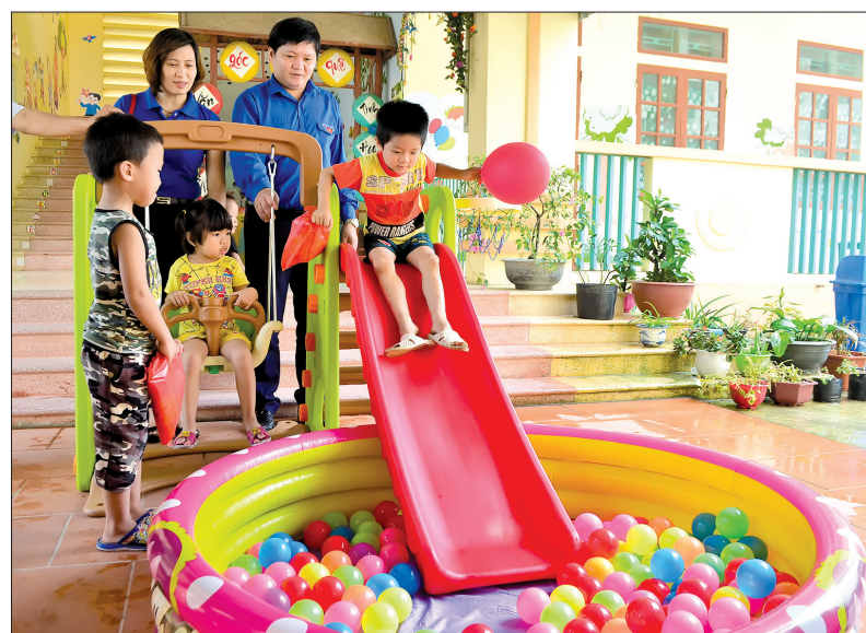
Các em nhỏ vui chơi trong mô hình trò chơi của các cấp bộ đoàn tặng.

điều trị, thương lắm! Rồi các em mồ côi cha, mẹ, hay cha, mẹ bị bệnh nặng, các em ở cùng với người thân cũng có hoàn cảnh khó khăn, có nguy cơ bỏ dở ước mơ học lên các bậc học cao hơn... Nhưng điều làm mình xúc động nhất là các em và gia đình vẫn cố gắng vươn lên trong cuộc sống. Việc giúp đỡ học sinh nghèo, học sinh có hoàn cảnh đặc biệt khó khăn vẫn được các cấp bộ đoàn, đội thực hiện thường xuyên. Nhưng để theo dõi sát sao cả chặng đường học tập của các em từ bậc tiểu học đến hết bậc THPT là sự nỗ lực của cán bộ đoàn, đội cơ sở. Để thực hiện mô hình, Tỉnh đoàn, các huyện, thành đoàn đã phối hợp với các đơn vị đoàn trực thuộc ra soát hoàn cảnh khó khăn của một