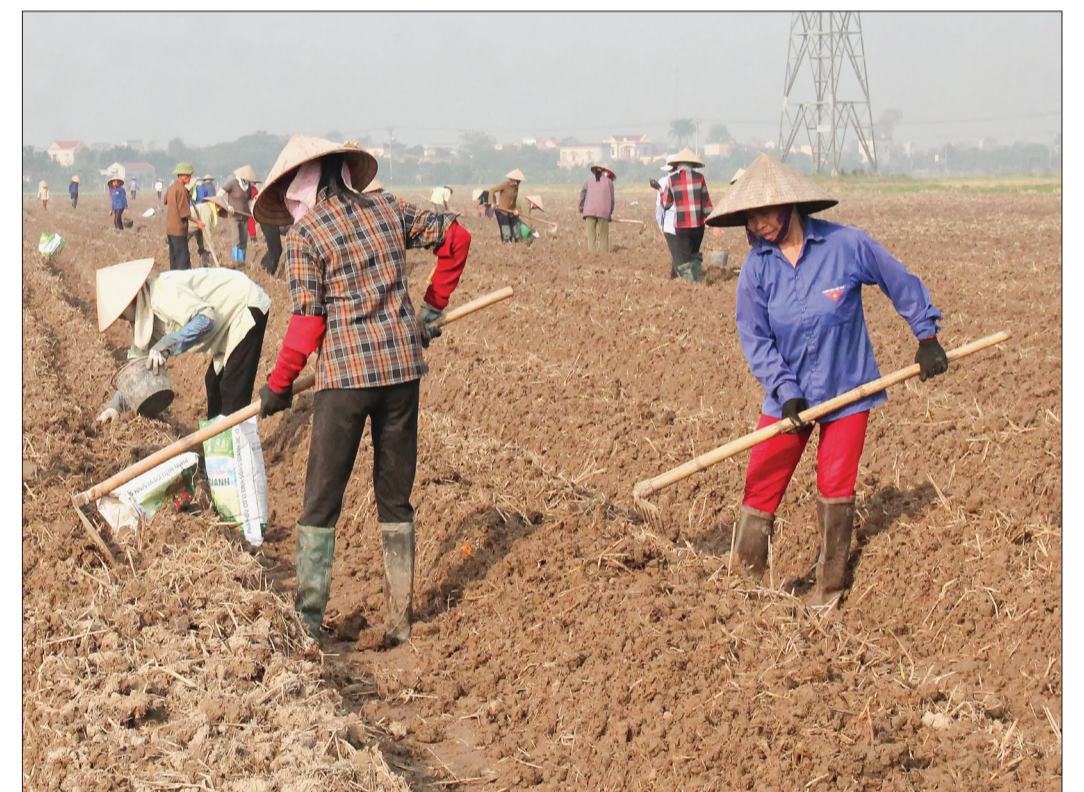
Trồng khoai tây vụ đông tại xã Mê Linh (Đông Hưng).

Cánh đồng làng lúc nào cũng đông người, chẳng cần phải họp hành, tuyên truyền, vận động hay giao chỉ tiêu sản xuất vụ đông như bây giờ. Theo ông Tân, hiện nay hạ tầng thủy lợi, giao thông được đầu tư xây dựng đến tận chân ruộng. Không chỉ tỉnh mà huyện cũng có chính sách khuyến khích nhưng nông dân vẫn không mặn mà với sản xuất vụ đông bởi trong điều kiện sản xuất manh mún, nhỏ lẻ, giá trị từ sản xuất nông nghiệp nói chung, vụ đông nói riêng còn thấp so với các ngành nghề khác.