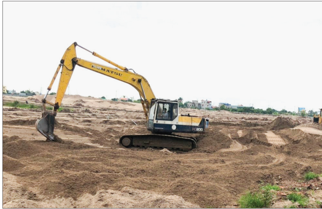
Dự án đang được triển khai xây dựng hạ tầng.