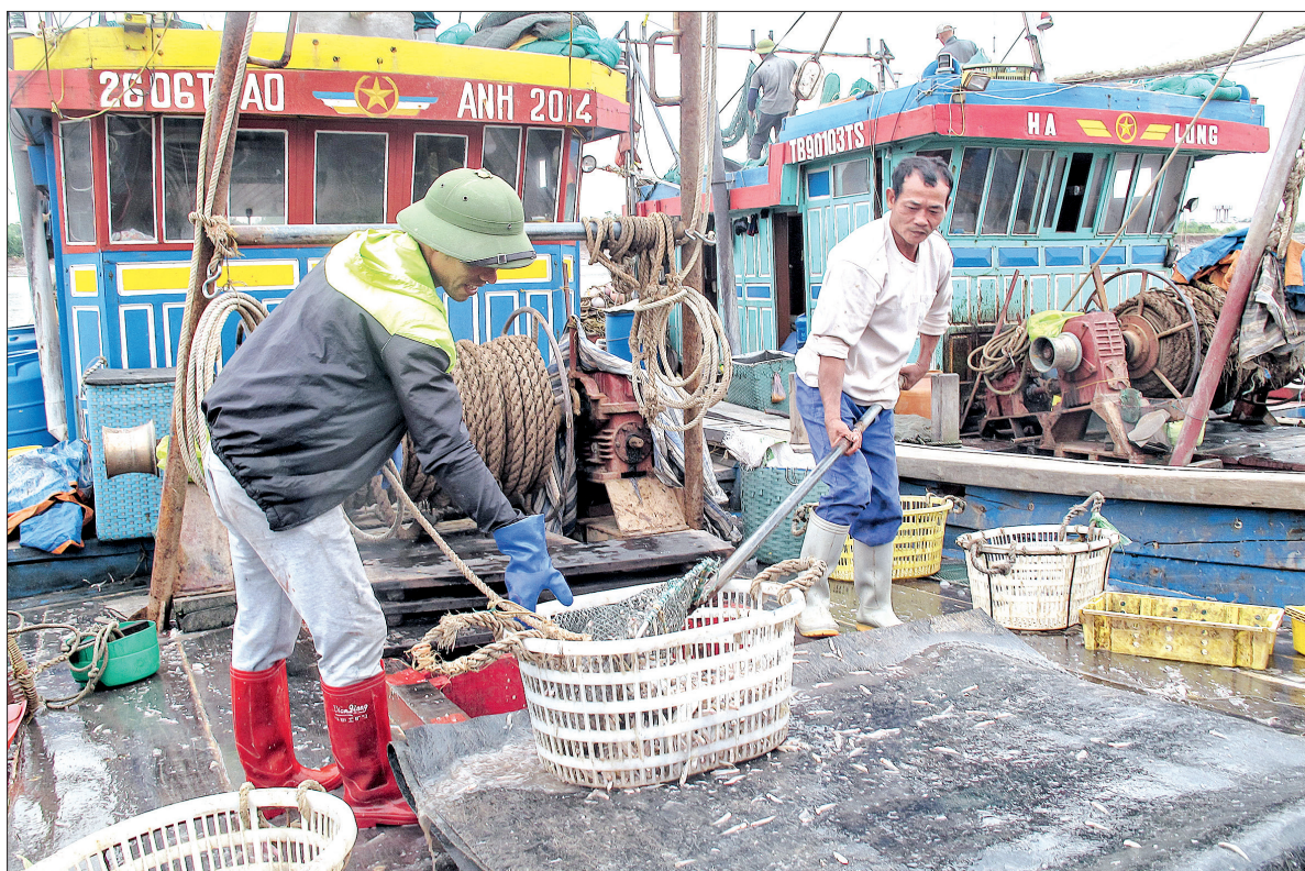
Khai thác hải sản tại Thái Thụy.

Triển khai thực hiện Chỉ thị số 05, Ban Tuyên giáo Huyện ủy đã soạn thảo hướng dẫn và chỉ đạo, định hướng bình chủng tư tưởng đa dạng hình thức tuyên truyền. Đặc biệt là nêu gương các tập thể, cá nhân điển hình tiên tiến trong học tập và làm theo lời Bác gắn với thực hiện nhiệm vụ chính trị ở mỗi cơ quan, đơn vị, địa phương. Nhiều trường học xây dựng chương trình phát thanh măng non, kể những câu chuyện về Bác Hồ trên loa vào các giờ chào cờ đầu tuần. Tiêu biểu như Trường Tiểu học, THCS các xã Thụy Văn, Thụy Chính, Thái Học, Thụy Liên. Đội ngũ báo cáo viên từ huyện đến cơ sở cũng phát huy vai trò truyền tải nội dung, mục đích, ý nghĩa, tầm quan trọng của việc thực hiện Chỉ thị số 05 tới cán bộ, đảng viên, các đơn vị và các tổ chức cơ sở đảng. Các