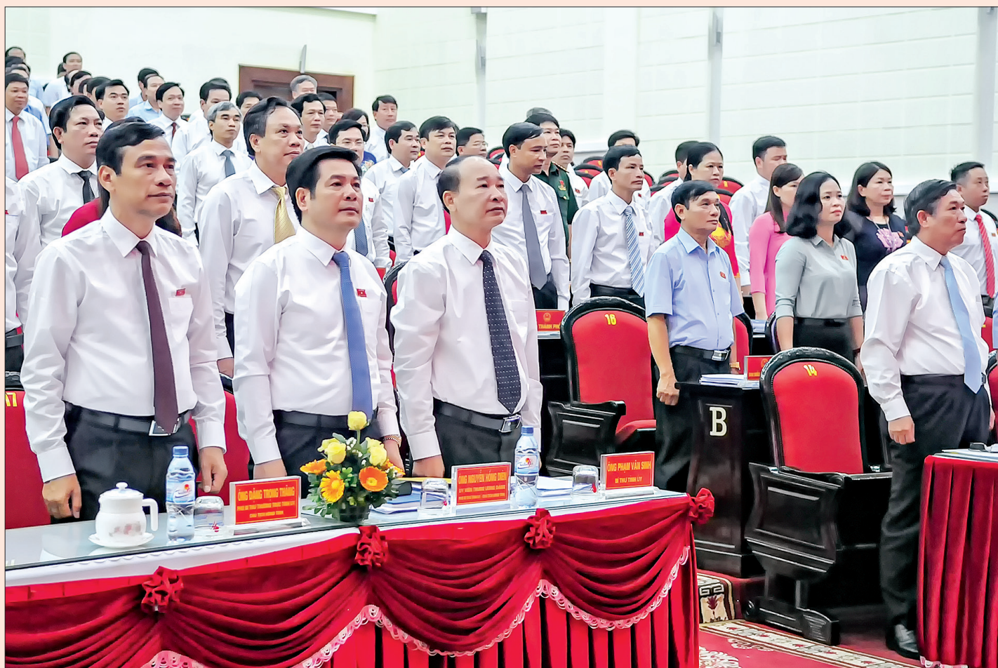
Các đại biểu dự phiên khai mạc kỳ họp.