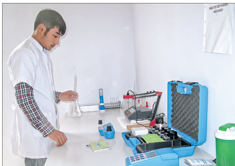
Phòng nội kiểm nhà máy nước sạch tại xã Đông Trung (Tiền Hải).

công trình để giữ vững các tiêu chí đã đạt trong xây dựng nông thôn mới.