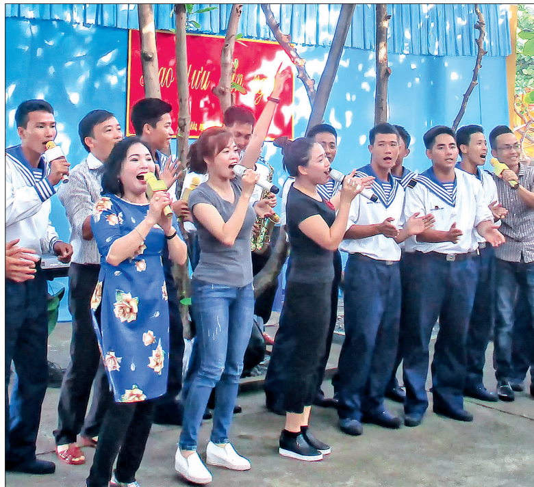
Giao lưu văn nghệ.

Không còn cách nào khác, một sáng kiến được đưa ra đó là hát cho chiến sĩ nghe qua bộ đàm. Vì ca sĩ, khán giả không nhìn thấy mặt nhau nên cuộc giao lưu lúc đầu còn dè dặt. Thế rồi, một hai lần điệu chèo mượt mà, đắm thắm bay vút lên giữa đại dương. Hồn dân tộc gọi lên trong những con người đã quen với cuộc sống giữa biển cả bao la nỗi nhớ quê hương da diết, nhớ cây đa, bến nước, sân đình, nhớ dáng mẹ tảo tần khuya sớm, nhớ vầng trăng hàn nhủ lo của cha sau những đêm không ngủ, nhớ người yêu mòn mỏi đợi tin sau khung cửa sổ màu xanh, nhớ tuổi thơ lớn lên từ lời ru của bà, của mẹ. Không khí như chùng