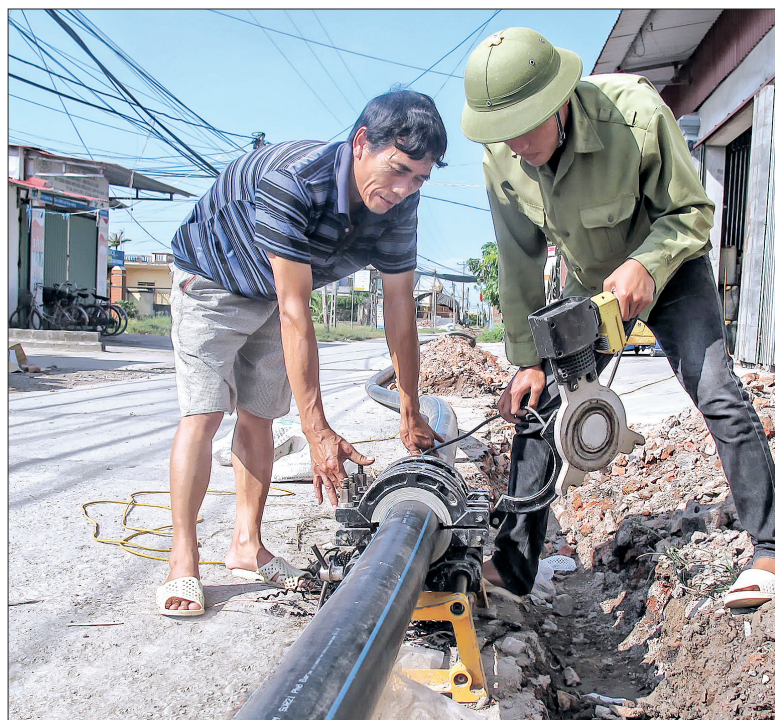
Công ty TNHH Thành Thủy lắp đặt đường ống dẫn nước tại xã Thủy Hưng (Thái Thụy).

điều kiện trả một lần tiền vốn đối ứng cho nhân dân khi tham gia dự án bởi số tiền đó rất lớn, có thể giúp địa phương rất nhiều trong việc duy tu, sửa chữa các