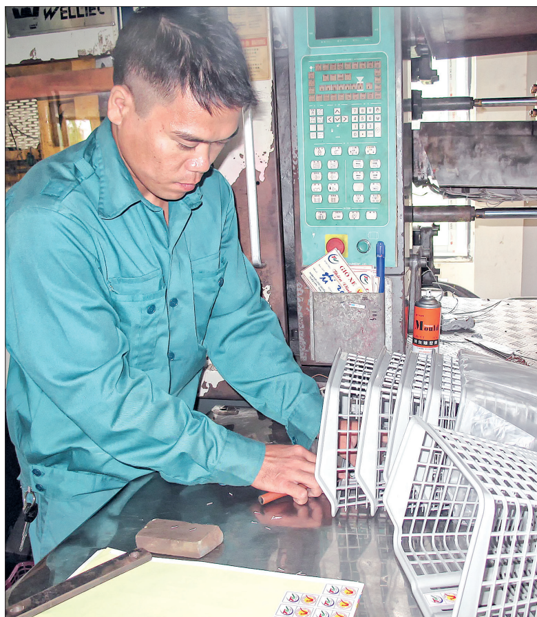
Sản xuất công nghiệp, tiểu thủ công nghiệp trên địa bàn huyện Thái Thụy ngày càng phát triển.