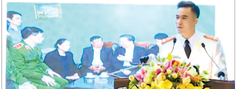
Phần dự thi của các báo cáo viên đều tích hợp thêm hình ảnh, video trên phần mềm trình chiếu, góp phần nâng cao hiệu quả tuyên truyền.

nhệm rất quý báu cho đội ngũ báo cáo viên nói chung, đặc biệt là những đồng chí mới đảm nhận vị trí báo cáo viên như tôi từ đó đáp ứng tốt hơn nhiệm vụ tuyên truyền trong thời gian tới.