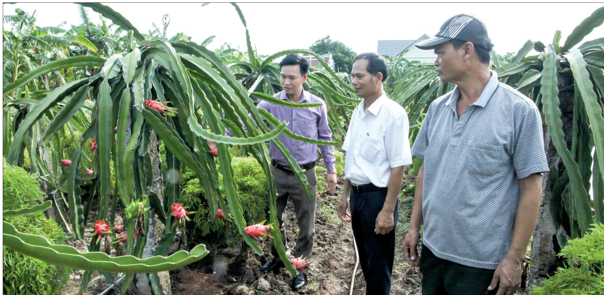
MTTQ xã Đông Trà (Tiền Hải) vận động đoàn viên, hội viên phát triển kinh tế, vươn lên làm giàu.

Mặc dù bị tác động không nhỏ từ đại dịch Covid-19 nhưng với sự chủ động đổi mới về nội dung, nâng cao chất lượng hoạt động, đa dạng hóa mọi nguồn lực ủng hộ, ủy ban MTTQ các cấp vẫn thực hiện tốt phong trào thi đua “Cả nước chung tay vì người nghèo, không để ai bị bỏ lại phía sau”, tạo sức lan tỏa tới đoàn viên, hội viên và các tầng lớp nhân dân, góp sức cùng các cấp, các ngành chung tay chăm lo cho người nghèo, thực hiện tốt chương trình an sinh xã hội trên địa bàn tỉnh.