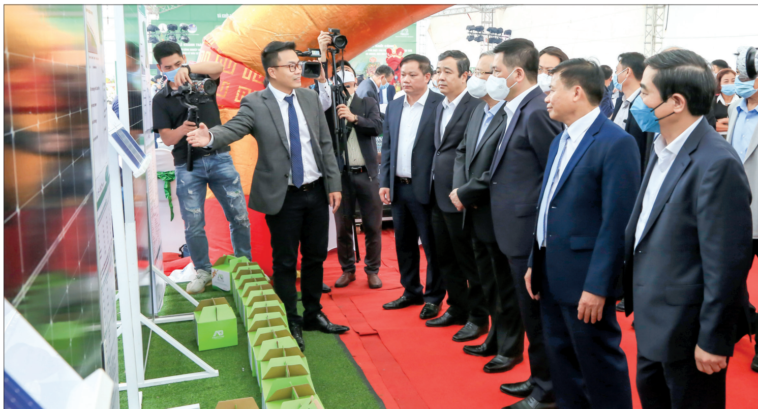
Các đồng chí lãnh đạo và đại biểu tham quan sản phẩm tấm Panel năng lượng mặt trời AD Green.