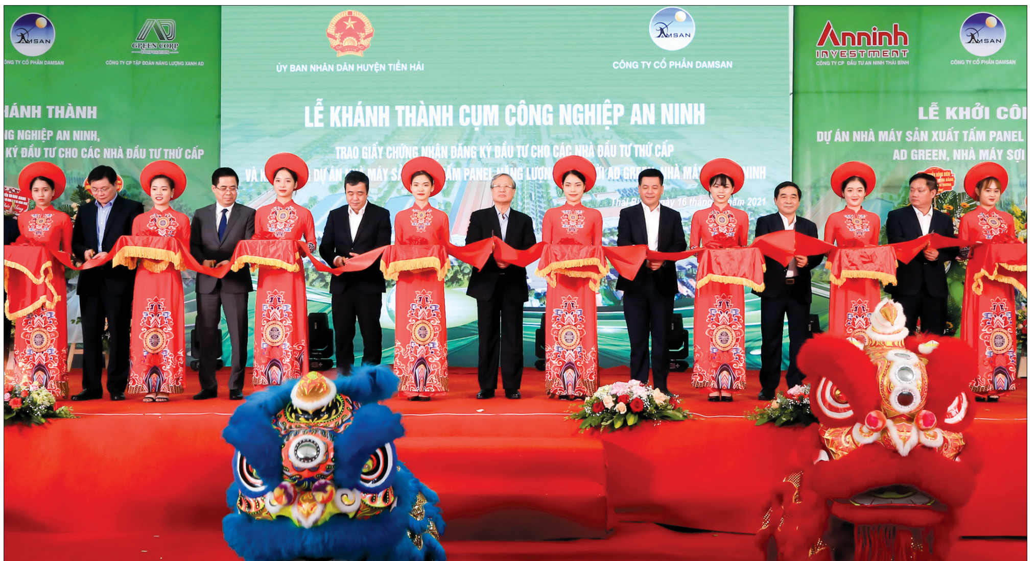
Các đồng chí lãnh đạo cắt băng khánh thành cụm công nghiệp An Ninh.