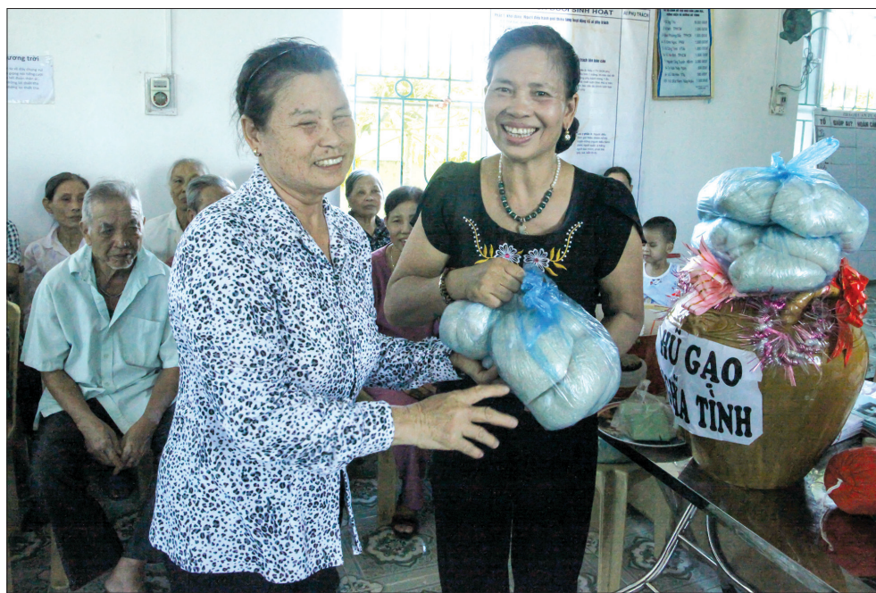
Phong trào “Hũ gạo nghĩa tình” đã giúp nhiều gia đình có hoàn cảnh khó khăn của xã Tây Sơn, huyện Kiến Xương được nhận hỗ trợ gạo hàng tháng.

Không chỉ có căn nhà tình nghĩa của em Thúy được khánh thành trong năm 2021, từ nguồn quỹ “Vì người nghèo” các cấp mà nhiều căn nhà kiên cố, kang