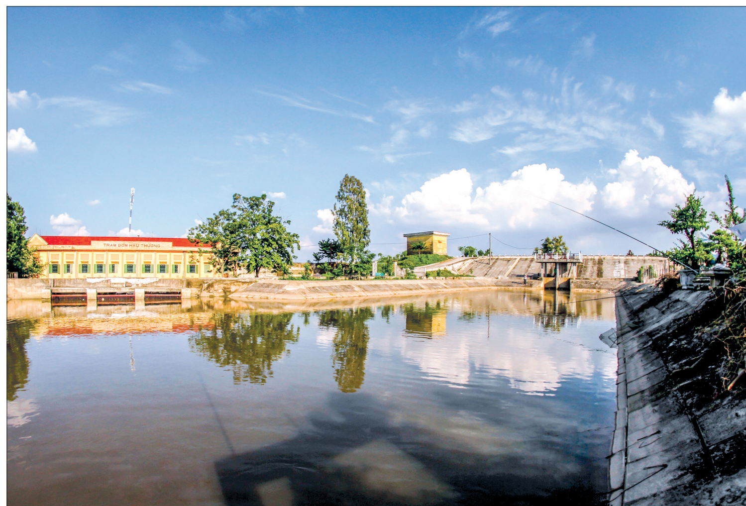
Thời Trình - Mạc (1539 - 1592) phân tranh, dân làng Thần Hậu siêu tán không còn ai, khi sóng yên, biển lặng dân tìm về làng nên gọi là Hậu Tái, sau chia thành Hậu Trung, Hậu Thượng.

Thời Hai Bà Trưng dấy binh khởi nghĩa chống quân Nam Hán đã cổ súy các tướng lĩnh ở vùng đất nam sông Luộc, vốn là dân sống bên sông, bên biển nên thạo nghề sông nước. Hợp binh về với Hai Bà bằng con đường sông nước và chiến đấu trên sông nước, khi lui binh (khởi nghĩa thất bại), các tướng lĩnh cùng nghĩa binh cũng theo sông nước mà rút về. Lý Tử Tấn (thời nhà Lê) đã viết: Đất đai lộ Long Hưng, Thần Khê, Kiến Xương, Thư Trì... sông ngòi chằng chịt như mạng nhện, cưỡi một chiếc thuyền, bỏ chỗ nọ, đến chỗ kia chẳng ai còn biết lối mà tìm.