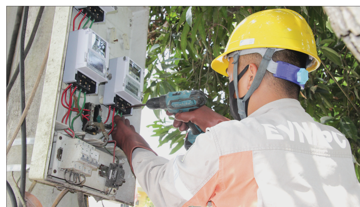
Công nhân Công ty Điện lực Thái Bình lắp đặt công tơ điện tử do xa cho khách hàng.

trợ, hướng dẫn, vận động khách hàng sử dụng các kênh thanh toán không sử dụng tiền mặt. Các cuộc giao ban, họp triển khai, đánh giá kết quả sản xuất, kinh doanh kết nối từ Tập đoàn Điện lực Việt Nam, Tổng công ty Điện lực miền Bắc đều theo hình thức trực tuyến. MANH THẮNG