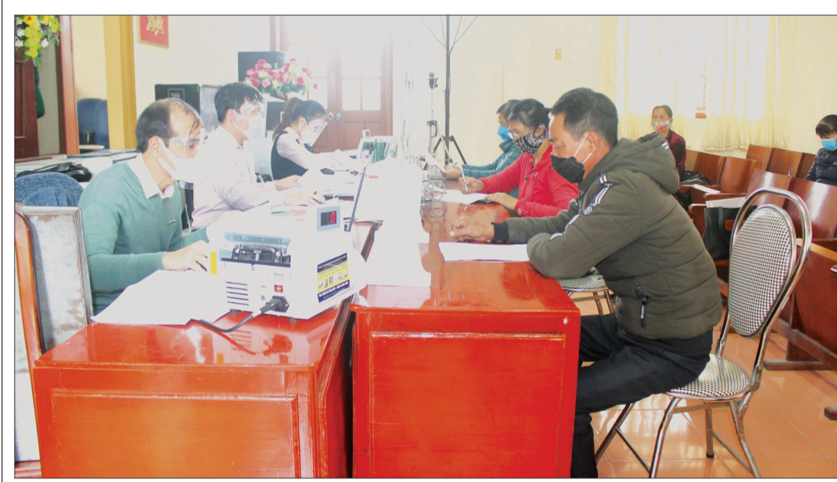
Giao dịch của Ngân hàng CSXH tại xã Đông Quan (Đông Hưng).