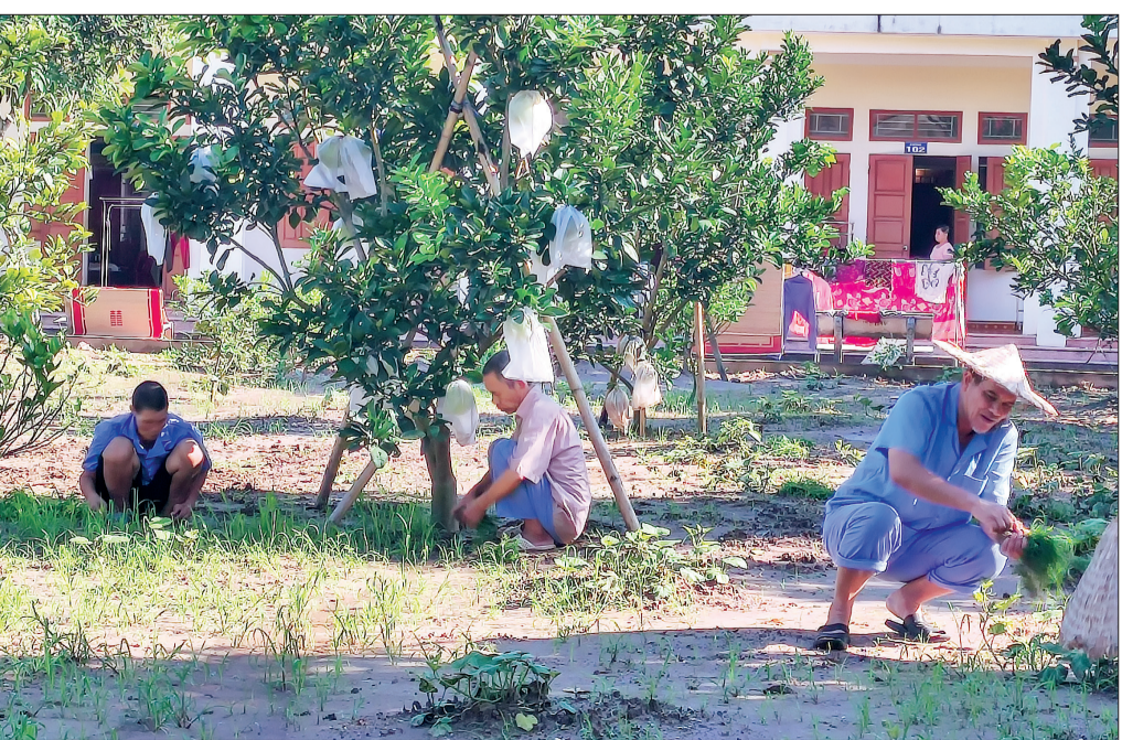
Những người còn sức khỏe được Trung tâm khuyến khích tham gia tăng gia sản xuất tại chỗ.