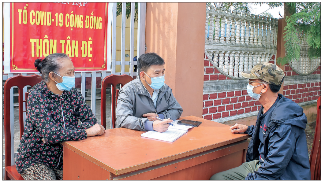
Tổ Covid-19 cộng đồng thôn Tân Đệ (xã Tân Lập, huyện Vũ Thư) duy trì trực để hướng dẫn người trở về từ các vùng dịch thực hiện các biện pháp phòng, chống dịch.

Huyện Vũ Thư có trên 5.800 lao động, học sinh thường xuyên làm việc, học tập tại tỉnh Nam Định. Ngay khi nhận được thông tin về chùm ca bệnh tại tỉnh Nam Định và huyện Quốc Oai (Hà Nội), huyện khẩn trương tăng cường các biện pháp chủ động phòng, chống dịch Covid-19, trọng tâm là tuyên truyền nâng cao ý thức trách nhiệm của người dân và phát huy vai trò của các tổ Covid-19 cộng đồng.