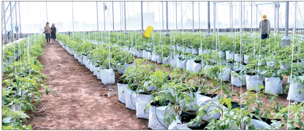
Mô hình sản xuất cà chua trong nhà lưới theo quy trình VietGAP của Công ty Cổ phần Thương mại tổng hợp Toàn Văn.

Nghị quyết Đại hội đại biểu Đảng bộ tỉnh lần thứ XX, nhiệm kỳ 2020 - 2025 đã khẳng định khoa học và công nghệ (KH và CN) là 1 trong 3 khâu đột phá trong phát triển kinh tế - xã hội giai đoạn 2021 - 2025.