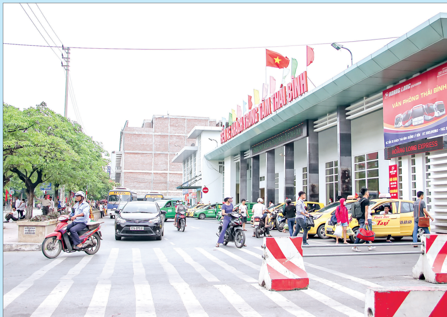
Bến xe khách trung tâm sẵn sàng điều động phương tiện để giải tỏa hành khách khi xảy ra tình trạng ùn tắc.