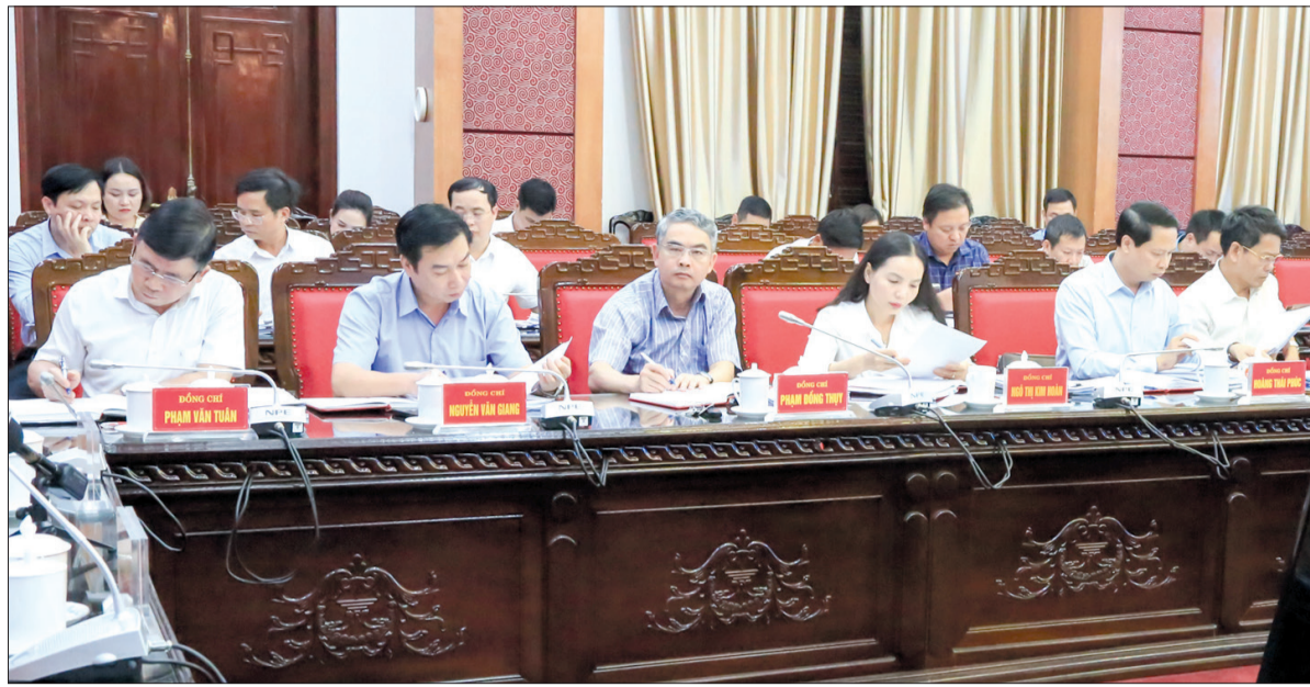
Đại biểu dự hội nghị.

Tại hội nghị, sau khi các đại biểu nghiên cứu, thảo luận kỹ lưỡng nội dung, từng vấn đề gắn với điều kiện thực tiễn của tỉnh, Ban Thường vụ Tỉnh ủy đã thống nhất thông qua các chủ trương; Ban hành cơ chế huy động nguồn lực, lồng ghép nguồn vốn giữa các chương trình mục tiêu quốc gia giai đoạn 2021 - 2025 và giữa các chương trình mục tiêu quốc gia giai đoạn 2021 - 2025 với các chương trình, dự án khác trên địa bàn tỉnh; ban hành quy định phân cấp nguồn tài, nhiệm vụ chi và tỷ lệ phần trăm (%) phân chia nguồn tài giữa các cấp ngân sách tỉnh Thái Bình giai đoạn 2023 - 2025; ban hành quy định khu vực thuộc nội thành của thành phố, thị trấn không được phép chăn nuôi, vùng nuôi chim yến và chính sách hỗ trợ khi di dời cơ sở chăn nuôi ra khỏi khu vực không được phép chăn nuôi; ban hành quy định một số mức hỗ trợ thực hiện Nghị định số 105 ngày 8/9/2020 của Chính phủ về chính sách phát triển giáo dục mầm non trên địa bàn tỉnh Thái Bình; hỗ trợ kinh phí năm 2022 cho Công an tỉnh để mua sắm trang thiết bị phục vụ thực hiện Đề án số 06 của Chính phủ về phát triển ứng dụng dữ liệu về dân cư, định danh và xác thực điện tử phục