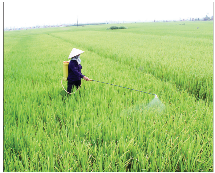
Nông dân xã Đồng Lâm phun thuốc phòng, trừ sâu bệnh.