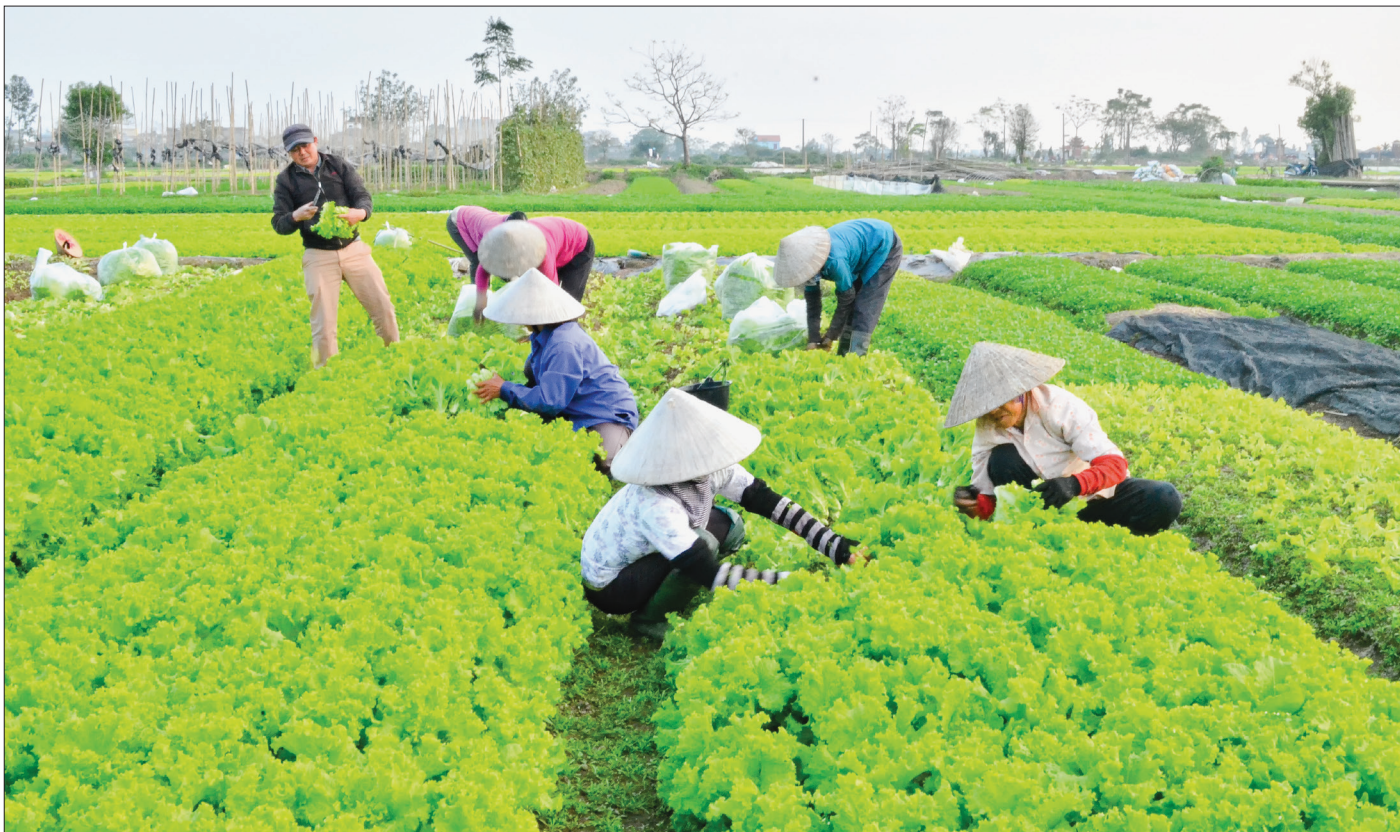
Cánh đồng rau an toàn xã nông thôn mới Vũ Phúc (thành phố Thái Bình) cho thu nhập 500 triệu đồng/ha/năm.

Bắt tay vào xây dựng NTM, điều trần trở nhất của cấp ủy đảng, chính quyền là làm sao để Thái Bình huy động được nguồn lực lớn để triển khai chương trình xây dựng NTM. Từ bài học mất ổn định những năm 1997 - 1999, Thái Bình xác định phải lấy dân làm gốc, coi đây là "chìa khóa" để đổi mới cơ chế "dân biết, dân bàn, dân làm, dân kiểm tra". Qua đó, phát huy vai trò chủ thể của người dân, tạo sự đồng thuận của nhân dân trong xây dựng NTM.