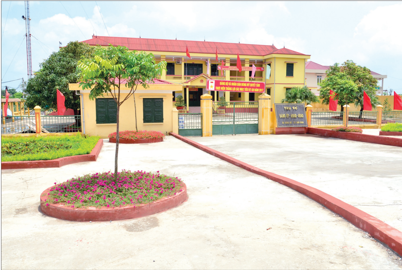
Trụ sở xã nông thôn mới Đông Mỹ (thành phố Thái Bình).

Sau gần 10 năm xây dựng NTM, nông thôn Thái Bình đã khoác lên mình “tấm áo mới” với diện mạo sáng, xanh, sạch, đẹp; đời sống người dân được nâng lên rõ rệt. Tuy nhiên để hoàn thành mục tiêu 100% số xã về đích NTM trong năm 2019, Thái Bình còn nhiều việc phải làm khi đến tháng 3/2019 vẫn còn 27 xã. Đây đều là những xã đặc biệt khó khăn, đòi hỏi nguồn lực đầu tư lớn.