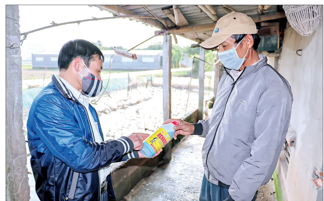
Cán bộ Ban Chăn nuôi và Thú y xã Bình Minh (Kiến Xương) hướng dẫn người dân sử dụng dung dịch tiêu độc, khử trùng.