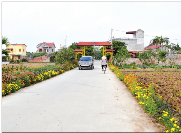
Đường làng ngõ xóm xã nông thôn mới Thái Dương (Thái Thụy) xanh, sạch, đẹp.

Trong chặng đường “nước rút” để 100% các xã về đích NTM trong năm 2019 và bảo đảm không còn nợ xây dựng cơ bản là việc làm không dễ, đòi hỏi nguồn lực đầu tư lớn. Trong 27 xã chưa hoàn thành xây dựng NTM thì có 16 xã đạt 15 - 17 tiêu chí, 9 xã đạt 13 - 14 tiêu chí và 2 xã mới đạt 12 tiêu chí. Để khuyến khích, hỗ trợ các địa phương sớm về đích NTM, ngày 21/9/2018 UBND tỉnh ban hành Quyết định số 2376/QĐ-UBND về việc ban hành quy định một số cơ chế, chính sách hỗ trợ xã đạt chuẩn quốc gia NTM, huyện đạt chuẩn quốc gia NTM và cơ chế, chính sách hỗ trợ sản phẩm đặc thù của huyện, thành phố giai đoạn 2018 - 2019.