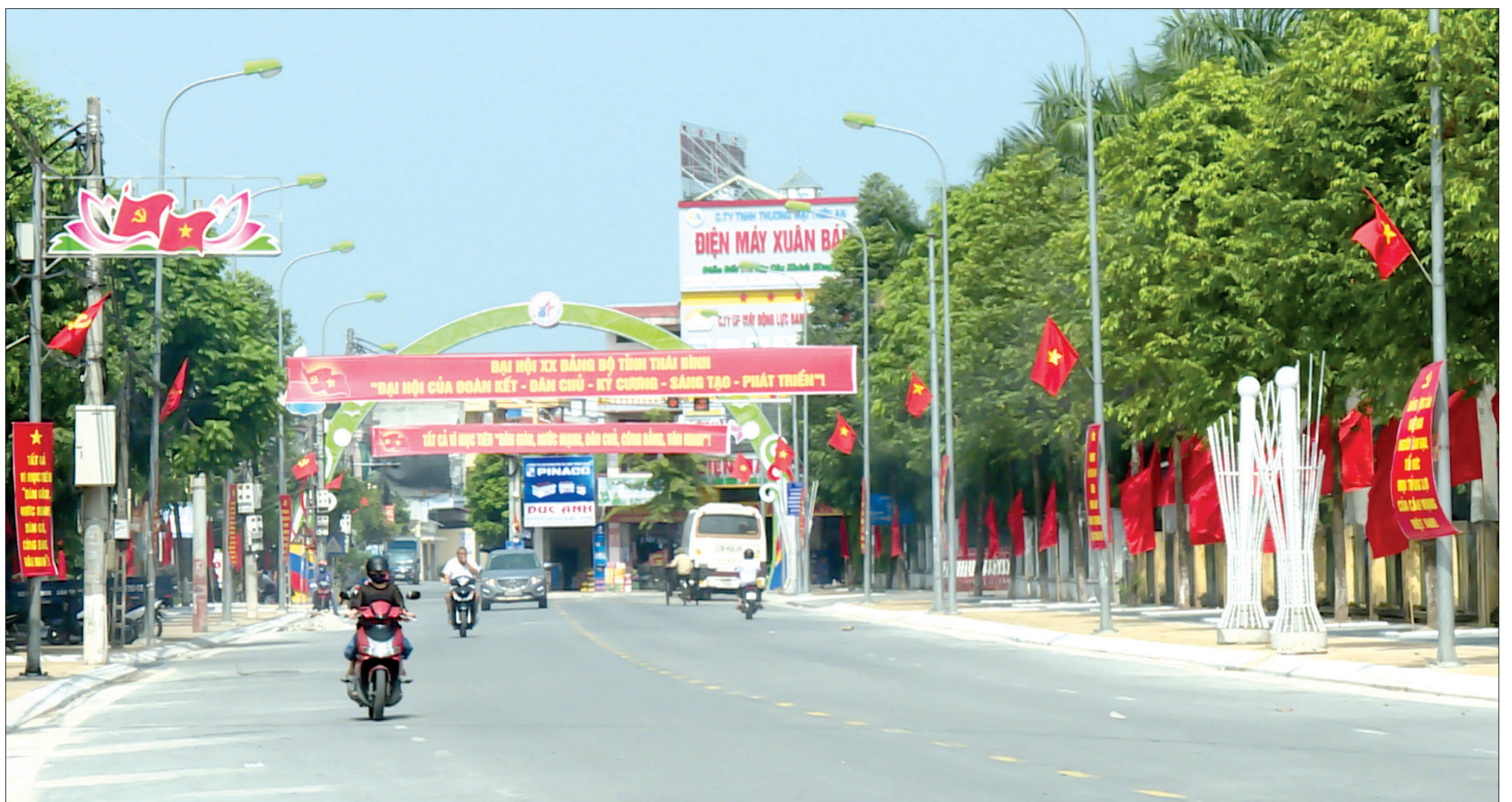
Cờ hoa rực rỡ trên đường Nguyễn Đức Cảnh (thành phố Thái Bình) chào mừng Đại hội đại biểu Đảng bộ tỉnh lần thứ XX.

Trong khí thế thi đua sôi nổi chào mừng sự kiện chính trị đặc biệt quan trọng 5 năm diễn ra một lần, cán bộ, đảng viên và các tầng lớp nhân dân Thái Bình đều tin tưởng sâu sắc Đại hội đại biểu Đảng bộ tỉnh lần thứ XX sẽ thành công tốt đẹp. Thành công của Đại hội vừa là dấu mốc đồng thời là tiền đề, động lực để Đảng bộ và nhân dân Thái Bình tiếp tục phát huy truyền thống yêu nước, cách mạng, đoàn kết, nỗ lực phấn đấu vượt qua mọi khó khăn, thách thức, thực hiện thắng lợi toàn diện các mục tiêu, nhiệm vụ trong nhiệm kỳ tới; phấn đấu xây dựng Thái Bình trở thành tỉnh phát triển trong khu vực đồng bằng sông Hồng, góp phần cùng cả nước thực hiện thành công công cuộc đổi mới, vì mục tiêu "Dân giàu, nước mạnh, dân chủ, công bằng, văn minh".