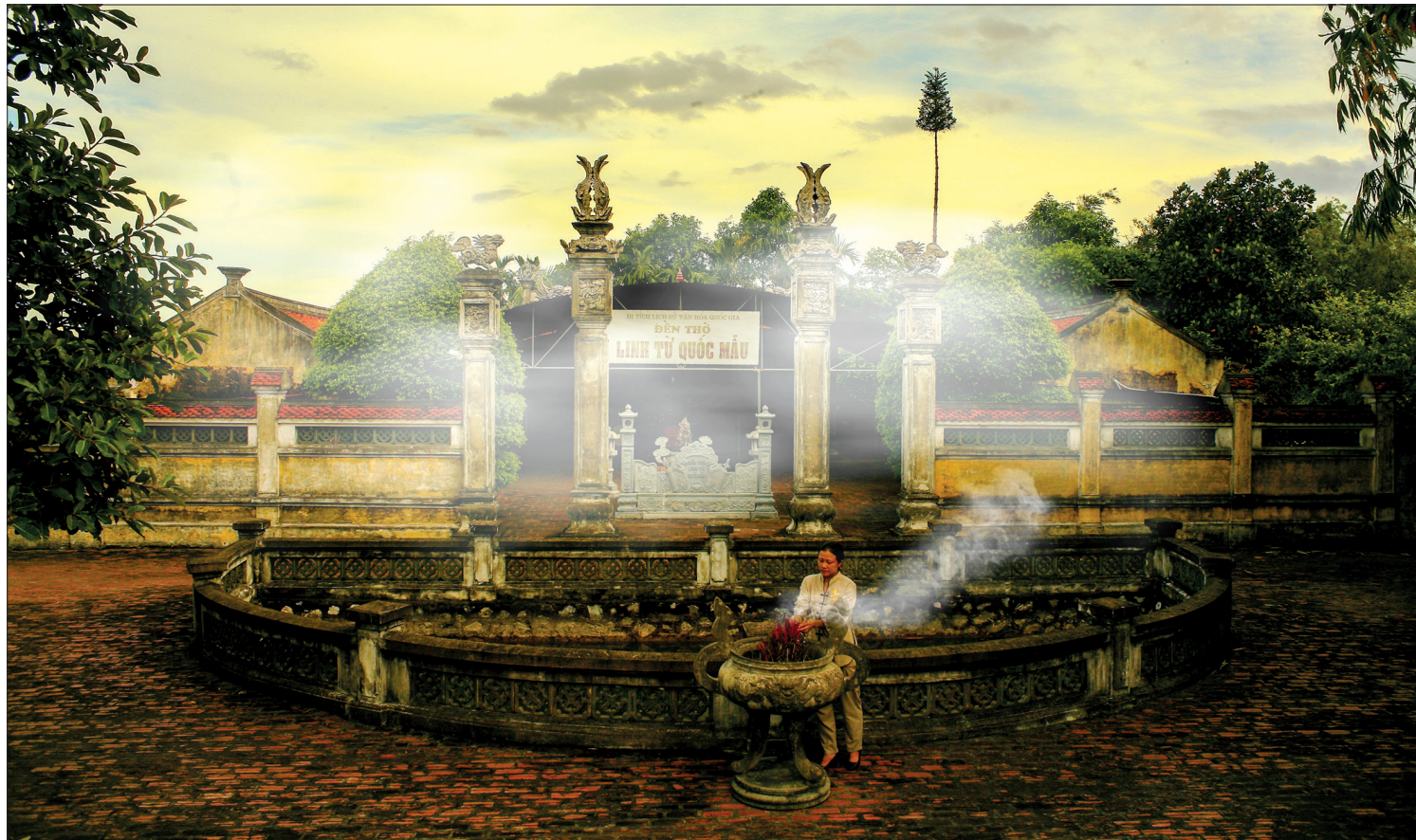
Đền Linh từ quốc mẫu hay còn gọi là đền Bà Chúa Ngự, làng Phù Ngự, xã Liên Hiệp, huyện Hưng Hà.

Từ một “thôn nữ” hiền thực, “trung nữ” tận tụy đến một hoàng hậu kiêu sa tỏa sáng vương triều Trần, trong cuộc kháng chiến chống quân Nguyên Mông xâm lược lần thứ nhất (1258), lúc quân nhà Trần đang giao chiến với Ngột Lương Hợp Thai thì ở kinh thành Thăng Long, “Bà” đã tổ chức thực hiện mưu kế “vườn không nhà trống” thành công, bảo vệ các vương tôn, quý tộc nhà Trần. Cuộc phản công của quân dân nhà Trần giành đại thắng, bà đã thực hiện rất tốt việc tích trữ và vận chuyển lương thảo kịp thời cho quân Đại Việt phá tan đạo quân hùng mạnh Nguyên Mông. Năm 1259, “Bà” mất, vua Trần Thái Tông phong bà là Linh Từ quốc mẫu.