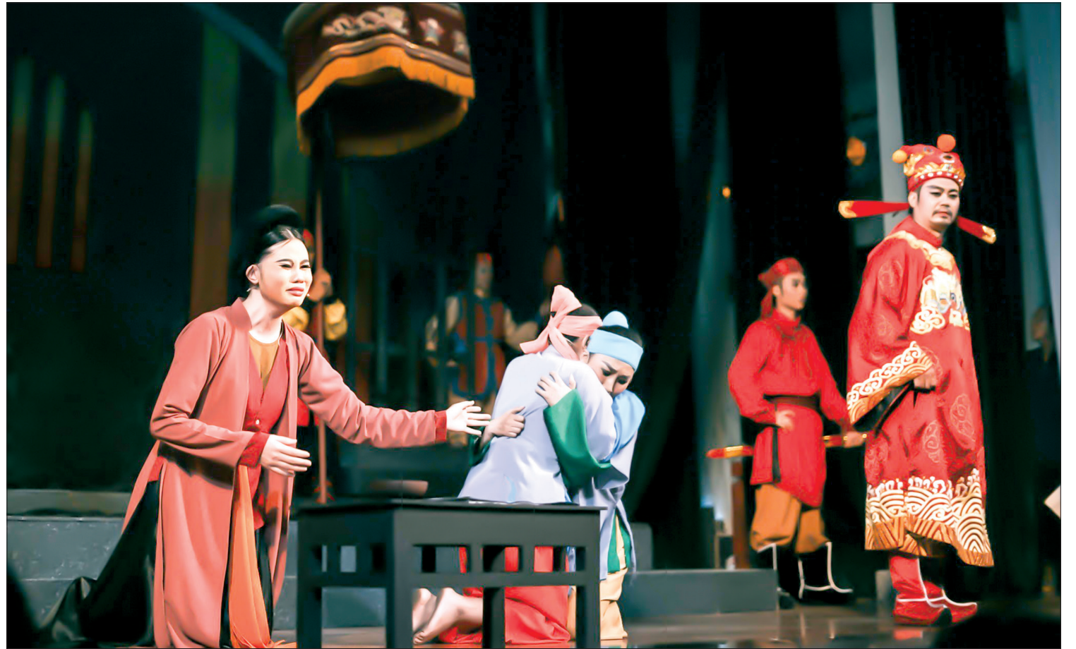
Nhà hát Chèo Thái Bình đã phục dựng thành công nhiều vở chèo truyền thống.

Bám sát những mục tiêu cơ bản và 5 nhiệm vụ trọng tâm của Nghị quyết, mỗi ngành, mỗi cấp đều đã triển khai các nội dung giáo dục truyền thống văn hóa, lịch