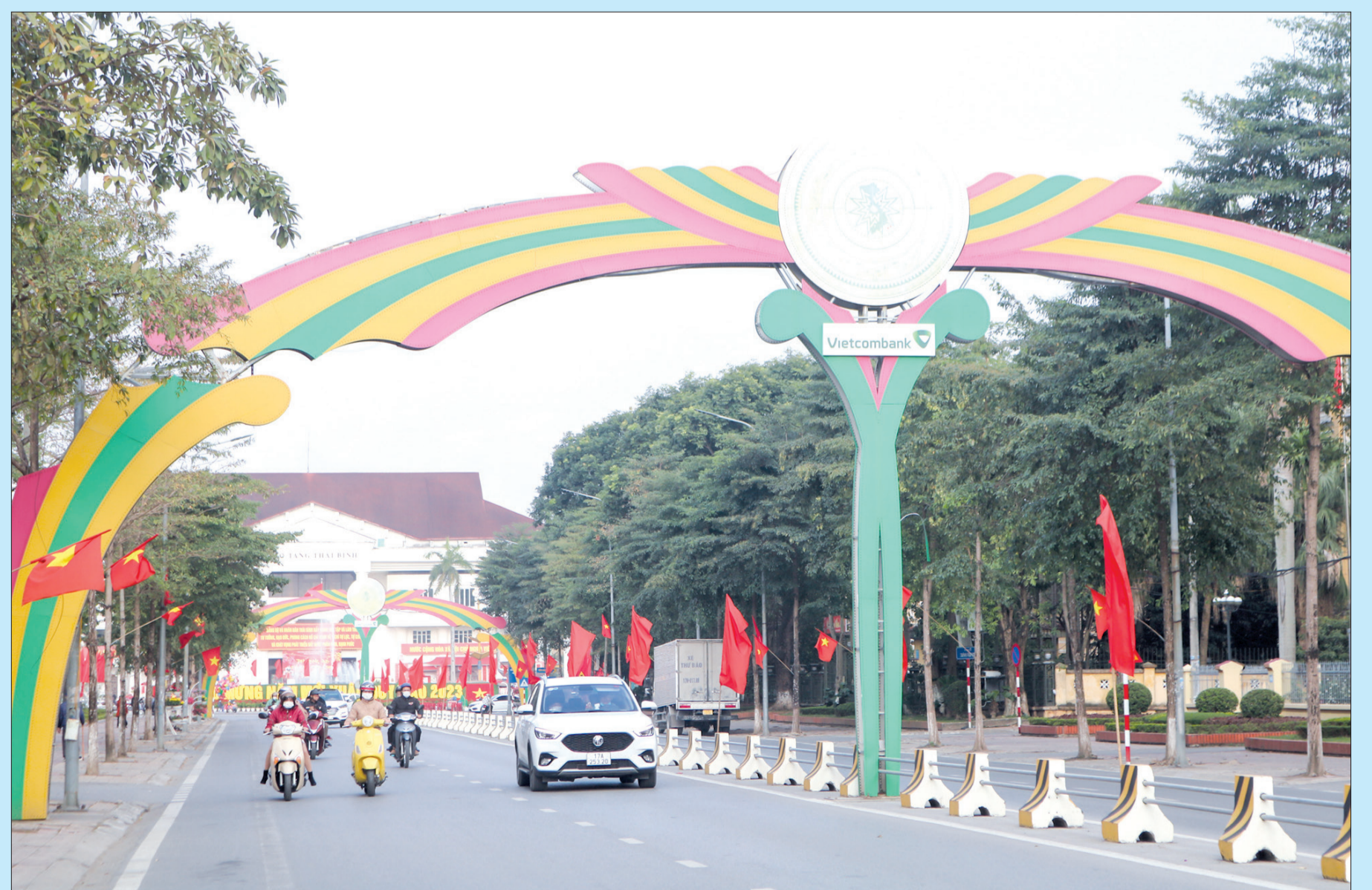
Thành phố Thái Bình.