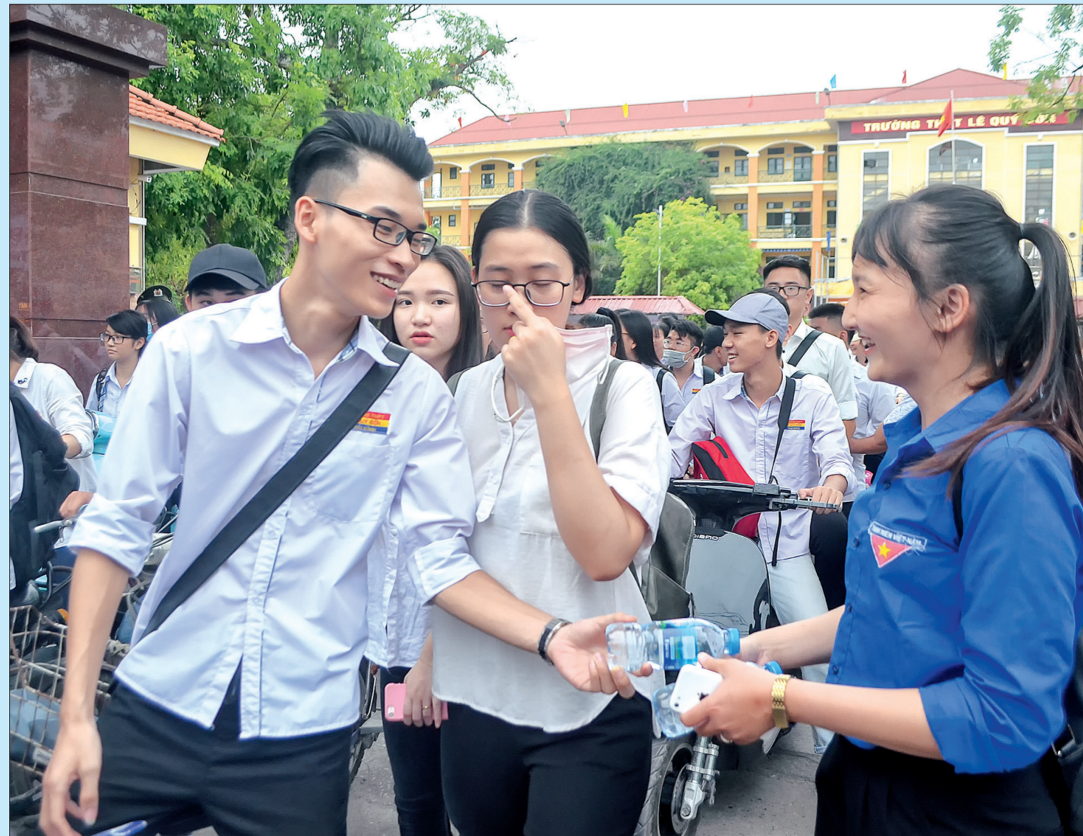
Sinh viên tình nguyện cung cấp nước uống cho thí sinh tham dự kỳ thi THPT quốc gia năm 2018.