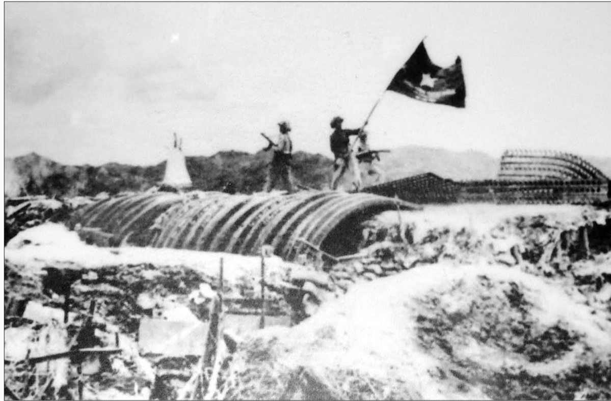
Là cờ chiến thắng tung bay trên nóc hầm tướng De Castries ngày 7/5/1954.

68 năm đã qua đi, những người lính từng tham gia chiến dịch Điện Biên Phủ năm 1954 giờ đều đã ở tuổi "bát thập". Mỗi dịp kỷ niệm ngày chiến thắng 7/5, họ lại được những người đồng chí, đồng đội từng vào sinh ra tử thăm hỏi, động viên, cùng ôn lại truyền thống hào hùng, góp sức làm nên chiến thắng "lừng lẫy năm châu, chấn động địa cầu".