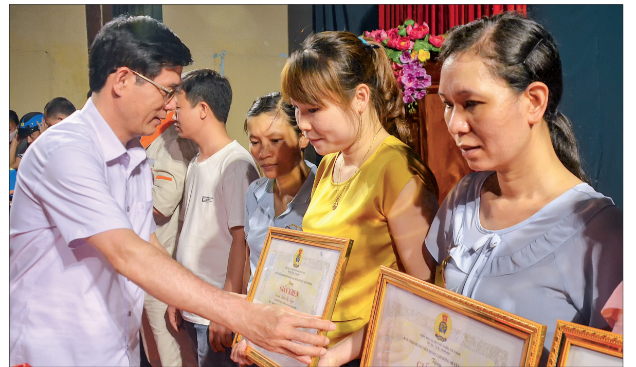
Lãnh đạo huyện Quỳnh Phụ trao thưởng cho các công nhân có thành tích xuất sắc trong lao động sản xuất.

Hơn 2 năm dịch Covid-19 diễn biến phức tạp, gần như mọi hoạt động trong tháng công nhân bị chứng lại đã ảnh hưởng nhiều đến việc chăm lo cho người lao động (NLD). Ngay sau khi dịch được kiểm soát, cùng với các cấp công đoàn trong tỉnh, Liên đoàn Lao động huyện Quỳnh Phụ đã tổ chức nhiều hoạt động hướng về NLD.