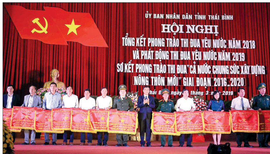
Đồng chí Đặng Trọng Thăng, Phó Bí thư Tỉnh ủy, Chủ tịch UBND tỉnh trao cờ cho các đơn vị đạt danh hiệu gương mẫu về mọi mặt năm 2018.