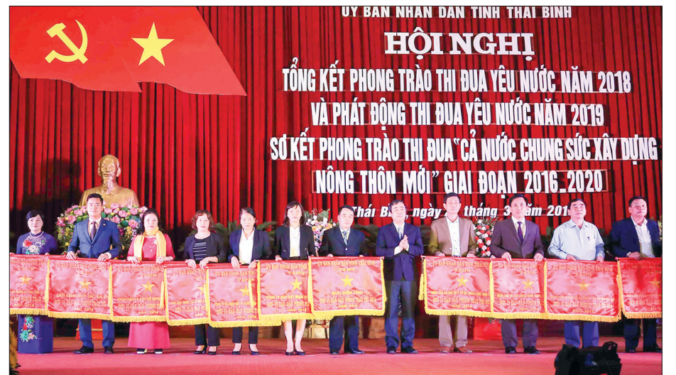
Đồng chí Ngô Đồng Hải, Ủy viên dự khuyết Trung ương Đảng, Phó Bí thư thường trực Tỉnh ủy trao cờ cho các đơn vị dẫn đầu phong trào thi đua năm 2018.