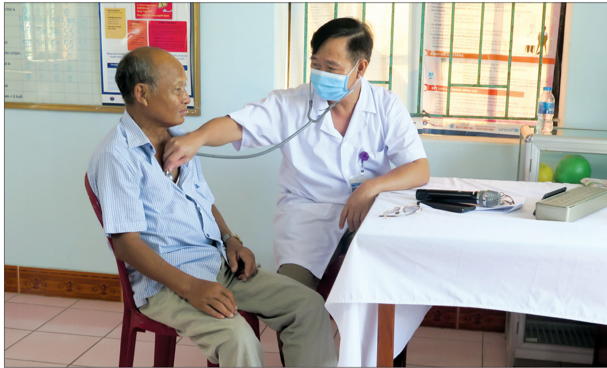
Các trạm y tế ở Kiến Xương làm tốt công tác chăm sóc sức khỏe ban đầu cho nhân dân.

Xác định sức khỏe là vốn quý nhất của mỗi người dân và của cả xã hội, huyện Kiến Xương đã có nhiều giải pháp phù hợp thực hiện Nghị quyết số 20-NQ/TW, ngày 25/10/2017 của Ban Chấp hành Trung ương Đảng (khóa XII) về tăng cường công tác bảo vệ, chăm sóc và nâng cao sức khỏe nhân dân trong tình hình mới, đạt được những kết quả tích cực.