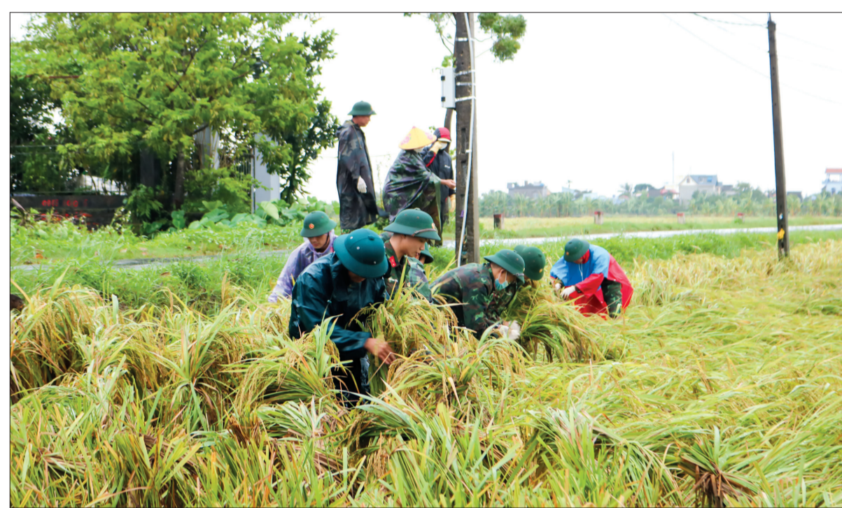
Cán bộ, chiến sĩ Bộ CHQS tỉnh giúp nhân dân xã Thụy Duyên (Thái Thụy) bứng lúa đổ.