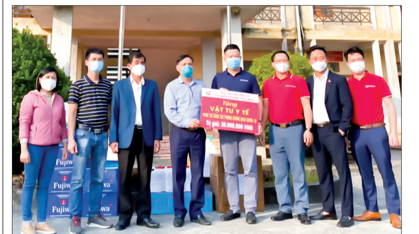
Câu lạc bộ đầu tư và khởi nghiệp Thái Bình trao vật tư y tế hỗ trợ xã Duy Nhất (Vũ Thư).

* Câu lạc bộ đầu tư và khởi nghiệp Thái Bình vừa tổ chức trao vật tư y tế phục vụ công tác phòng, chống dịch Covid-19 gồm nước sát khuẩn, Cloramin B, khẩu trang và kit test nhanh Covid-19 với tổng trị giá 40 triệu đồng cho các xã Duy Nhất, Hòa Bình (Vũ Thư) và UBND huyện Kiến Xương.