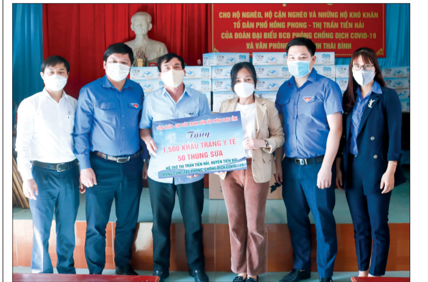
Công đoàn, Chi đoàn Thanh niên Văn phòng UBND tỉnh trao hỗ trợ cho thị trấn Tiên Hải.

* Sáng ngày 28/11, Công đoàn, Chi đoàn Thanh niên Văn phòng UBND tỉnh tổ chức trao 3.500 khẩu trang kháng khuẩn và 70 thùng sữa hỗ trợ thị trấn Tiên Hải và xã Nam Hà (Tiên Hải) phục vụ công tác phòng, chống dịch Covid-19, trị giá khoảng 30 triệu đồng.