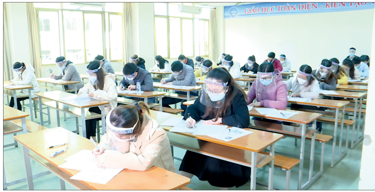
Thí sinh tham dự kỳ thi tuyển công chức tỉnh năm 2021.