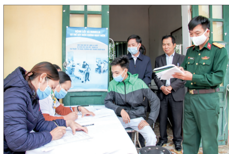
Thanh niên huyện Quỳnh Phụ tham gia khám tuyển nghĩa vụ quân sự.

Trong 5 năm, MTTQ và các tổ chức thành viên, LLVT các cấp đã đẩy mạnh tuyên truyền về chủ trương, đường lối của Đảng, chính sách, pháp luật của Nhà nước; tăng cường bồi dưỡng kiến thức quốc phòng, an ninh cho đội ngũ cán bộ trong hệ thống chính trị và học sinh, sinh viên. Thái Bình hoàn thành 100% chỉ tiêu giao quân, bảo đảm chất lượng, đúng luật. Nhân dân toàn tỉnh đã đóng góp trên 3.669,5 tỷ đồng xây dựng nông thôn mới, xây dựng được 7.617 mô hình "Dân vận khéo"; thành lập và duy trì hoạt động 2.117 mô hình tự quản, 2.914 đồng họ không ma túy, 1.802 tổ hòa giải ở cơ sở với 13.073 hòa giải viên. Quỹ "Vì người nghèo" các cấp đã vận động được trên 51,7 tỷ đồng; từ nguồn quỹ này đã hỗ trợ xây mới, sửa chữa 1.072 nhà