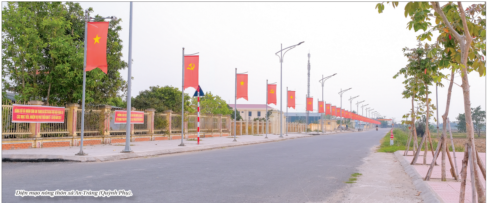
Diện mạo nông thôn xã An Tràng (Quỳnh Phụ).