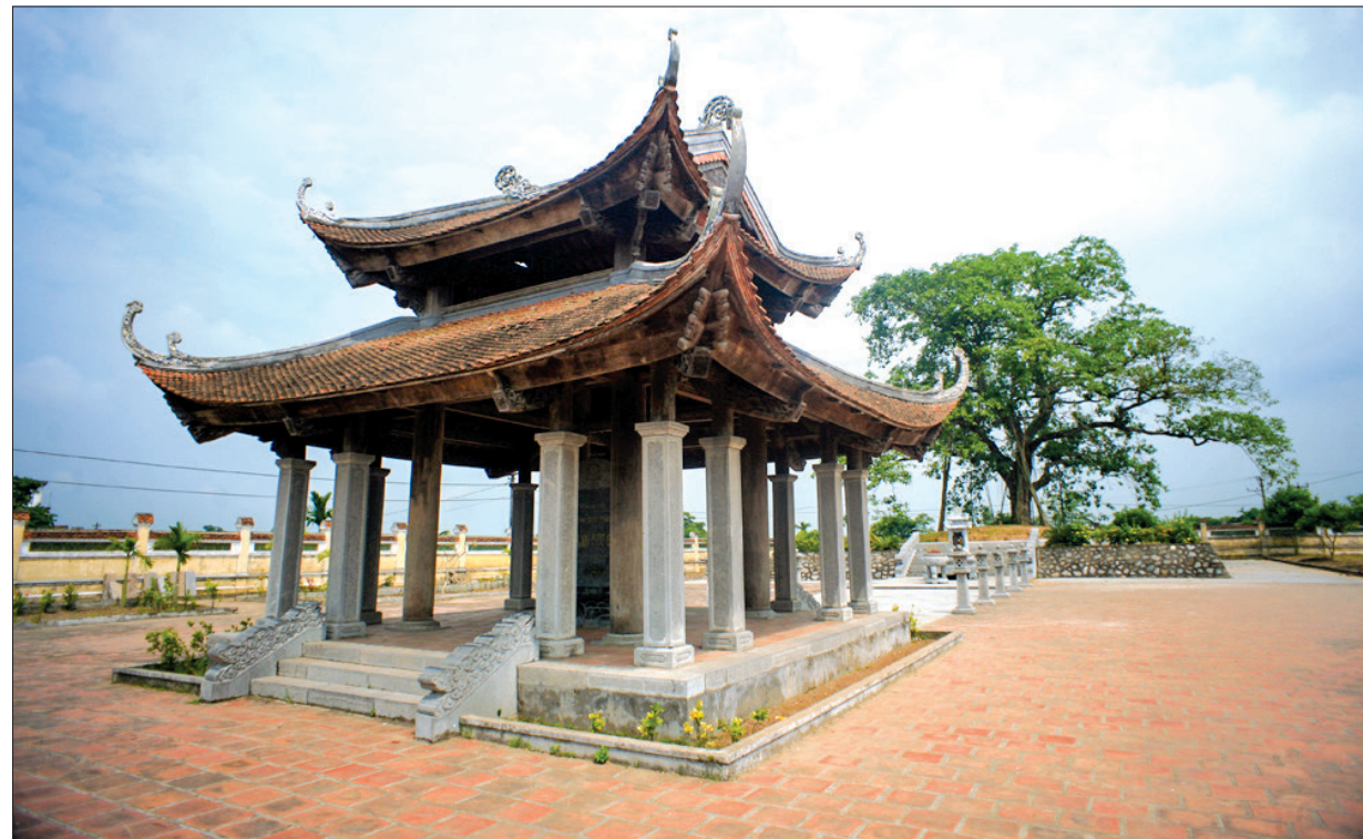
Khu lăng mộ Thái sư Trần Thủ Độ tại làng Ngừ, xã Liên Hiệp (Hưng Hà).

Phạm Đôn Lễ (1454 - 1531), Tam nguyên Trạng nguyên khoa Tân Sửu (1481), quê làng Hải Triều (Hưng Hà), là người có công mở mang nghề dệt chiếu, được dân suy tôn là Trạng Chiếu. Ông làm quan trải 4 đời vua nhà Lê: Thánh Tông, Hiến Tông, Túc Tông, Uy Mục. Tương truyền, dưới thời vua Lê Uy Mục (1505 - 1509), Phạm Đôn Lễ thường can ngăn vua vì ăn chơi vô độ, không chăm lo triều chính. Những kẻ xấu đã tìm mọi cách để hãm hại ông. Chung cục, Phạm Đôn Lễ từ quan về làng Mỹ Xá, xã Ngọc Sơn, thành phố Hải Dương và qua đời ở đó. Dân làng Mỹ Xá đã lập đền thờ và xây lăng mộ thờ ông. Ngôi đền nay không còn, lăng mộ đã được trùng tu tôn tạo khá khang trang. Hằng năm cứ vào ngày 9 tháng 7 âm lịch, họ Phạm ở xã Ngọc Sơn lại tập trung làm lễ giỗ, đại diện các dòng họ Phạm ở Hải Triều thường sang dự. Hoàng Công Chất (? - 1767), quê làng Hoàng Xá (Vũ Thư) là người khởi xướng và lãnh đạo cuộc khởi nghĩa kéo dài 30 năm (1739 - 1769) chống triều đình Lê - Trịnh, hoạt động trên quy mô rộng lớn từ vùng hạ lưu sông Hồng đến thượng du Thanh Hóa và Tây Bắc. Khi đánh chiếm vùng Tây Bắc, ông đã xây thành Bản Phủ thuộc xã Noọng Hết, nay thuộc thành phố Điện Biên Phủ, là một thành trì quân sự lớn bậc nhất ở miền biên cương phía Bắc. Đồng bào các