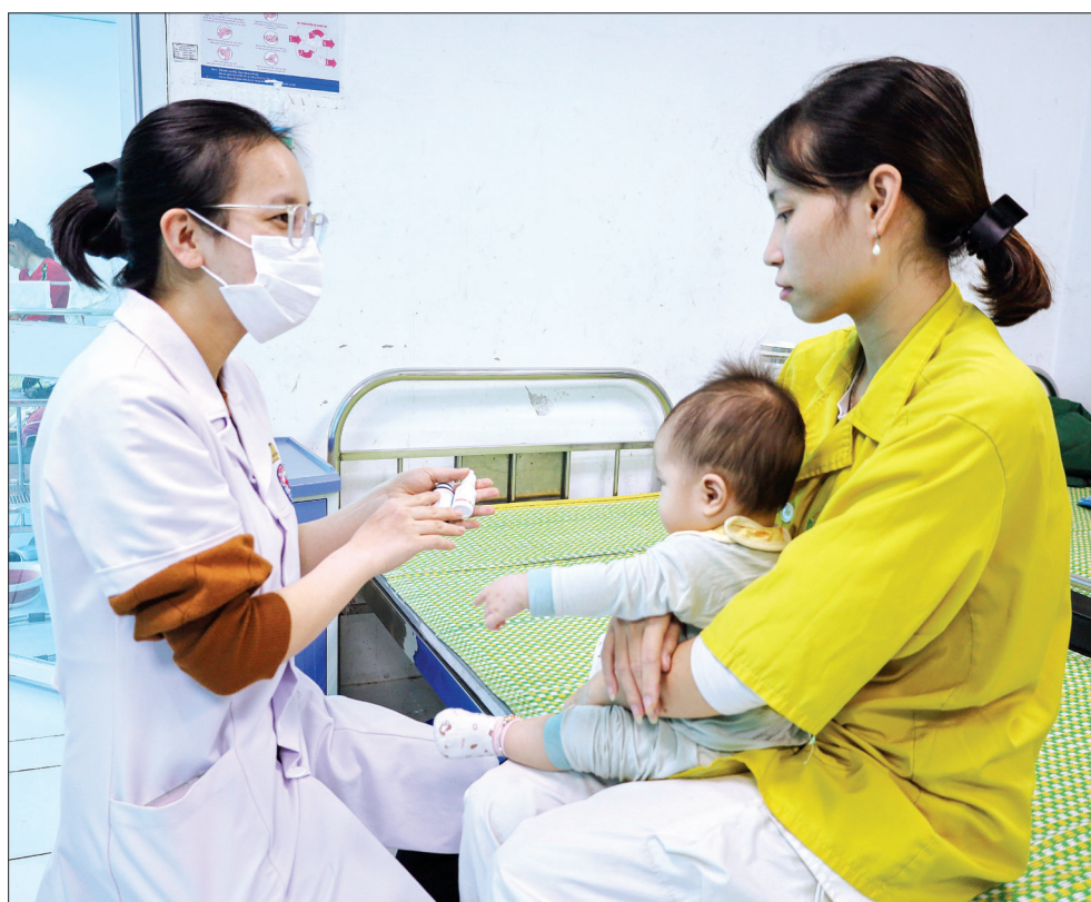
Trẻ điều trị tại Khoa Dinh dưỡng, Bệnh viện Nhi Thái Bình.

Mỗi lứa tuổi, cân nặng, thể trạng, tình trạng bệnh lý sẽ bổ sung liều lượng sắt, canxi, kẽm, vitamin... khác nhau. Do đó, các bậc phụ huynh không tự ý cho trẻ uống khi chưa có chỉ định hoặc tư vấn của bác sĩ.