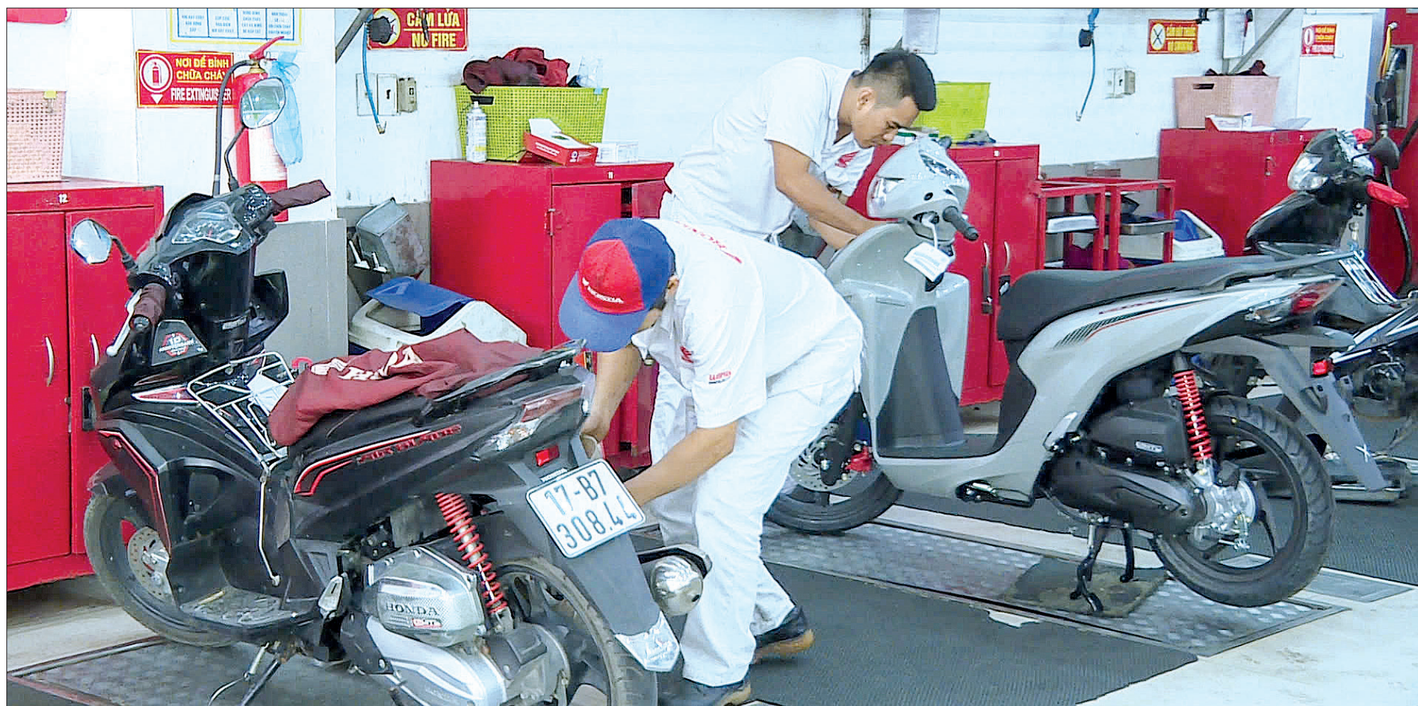
Nhân viên Công ty TNHH Hưng Thịnh chăm sóc, bảo dưỡng xe máy cho khách hàng.