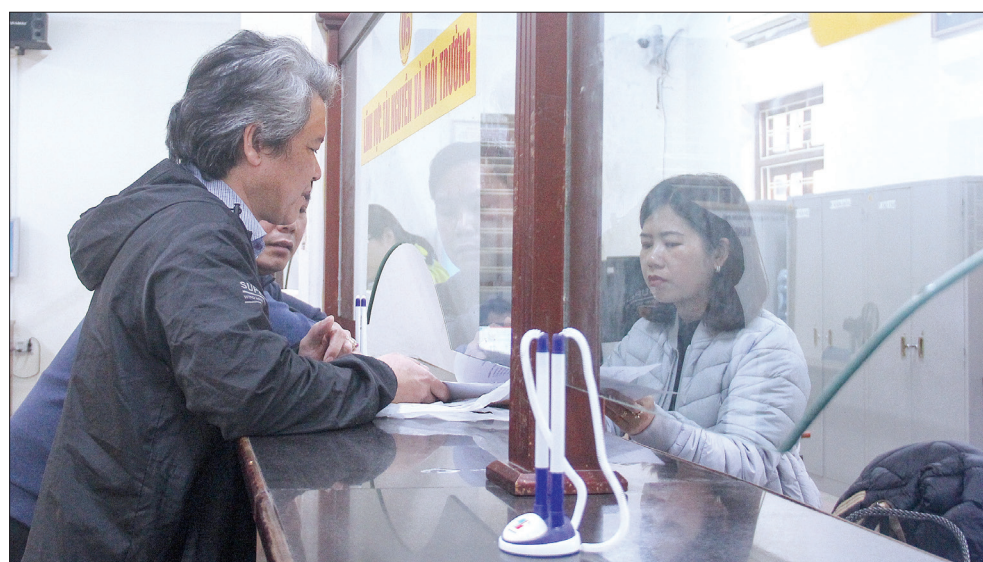
Người dân đến giải quyết thủ tục hành chính tại Bộ phận tiếp nhận và trả kết quả thành phố Thái Bình.

Để giữ vững được vị trí trên, ngay từ đầu năm, căn cứ chỉ đạo của tỉnh, thành phố đã triển khai đồng bộ, có hiệu quả các giải pháp. Trong đó, trọng tâm là cải cách thủ tục hành chính; ứng dụng công nghệ thông tin trong công tác điều hành, giải quyết thủ tục hành chính với nhà đầu tư, doanh nghiệp để giảm thiểu tối đa chi phí phát sinh về thời gian, tài chính của nhà đầu tư, doanh nghiệp khi thực hiện thủ tục hành chính tại cơ quan, đơn vị. Cải cách chế độ công vụ, công chức; nâng cao tinh thần trách nhiệm của đội ngũ cán bộ, công chức, viên chức trong thực thi nhiệm vụ, công vụ; tăng cường kiểm tra, giám sát việc thực hiện kỷ luật, kỷ cương hành chính, văn hóa, văn minh công sở đối với cán bộ, công chức; nâng cao hiệu quả hoạt động của bộ phận tiếp nhận và trả kết quả phường, xã; từng bước hiện đại hóa nền hành chính, hoàn thiện thể chế, cải cách tổ chức bộ máy; đẩy mạnh thu hút đầu tư, cải thiện môi trường kinh doanh, tạo môi trường thông thoáng, minh bạch, bình đẳng cho các doanh nghiệp.