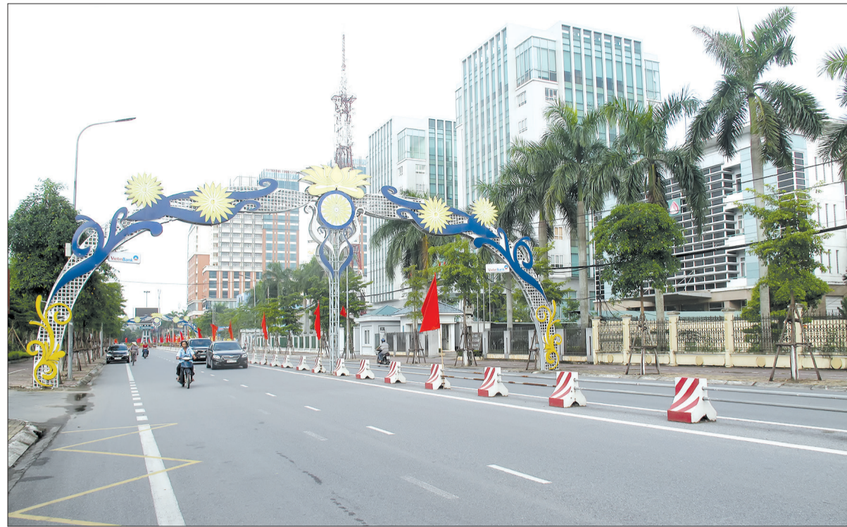
Đường Lê Lợi (thành phố Thái Bình).

dâng viên được phát huy. Công tác quản lý, điều hành của chính quyền, hoạt động của MTTQ và các đoàn thể đạt nhiều kết quả thiết thực.