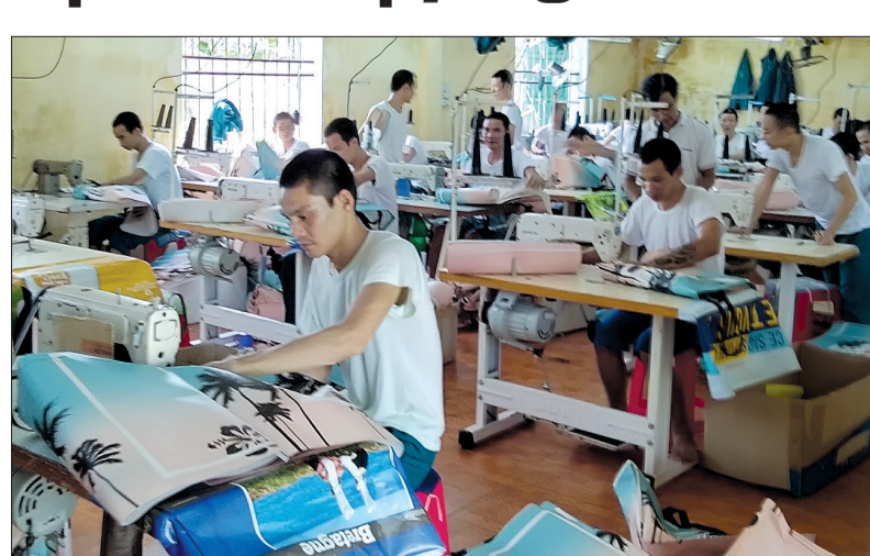
Các học viên học nghề may gia công.

hiện tốt khâu dạy nghề, đối với mỗi học viên sau khi được tiếp nhận vào Trung tâm đều được cán bộ y tế khám, xét nghiệm ma túy, phân loại trên cơ sở đó có phác đồ điều trị cắt cơn giải độc phù hợp. Sau thời gian cắt cơn, hàng ngày, bộ phận y tế phối hợp với các phòng nghiệp vụ tham gia tư vấn giáo dục giúp học viên ổn định tư tưởng. Khi tâm lý, tư tưởng, sức khỏe đã ổn định, Trung tâm nghiên cứu, lựa chọn những nghề phù hợp với thể trạng và đặc điểm tâm lý, sức khỏe của người nghiện và phù hợp với khả năng tìm kiếm việc làm để tổ chức dạy các nghề chủ yếu là may gia công sản phẩm, gia công giấy, lắp ráp hàng điện tử. Đây là những nghề không đòi hỏi