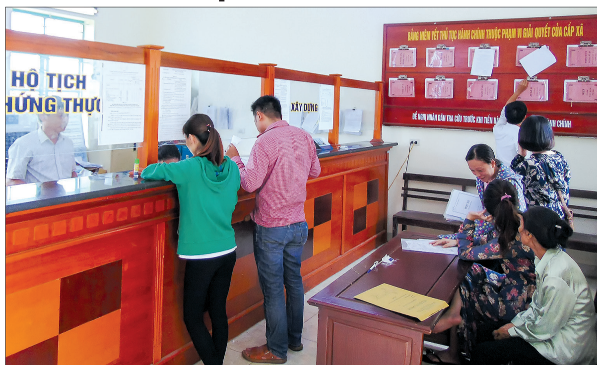
Phòng tiếp công dân của xã Vũ Đoài.