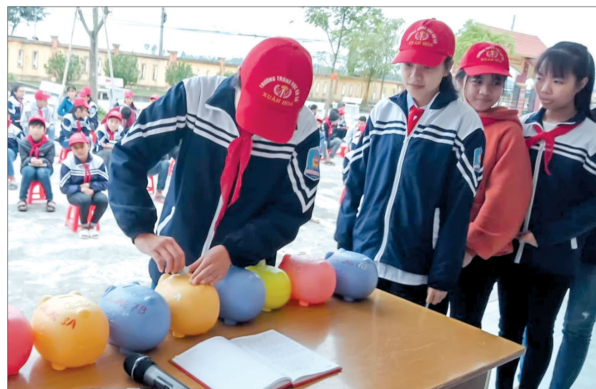
Trường THCS Xuân Hòa (Vũ Thư) phát động học sinh nuôi heo đất khuyến học trong năm 2019.