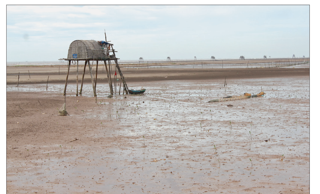
Khu nuôi trồng thủy sản của Công ty TNHH Thương mại dịch vụ Minh Phú.