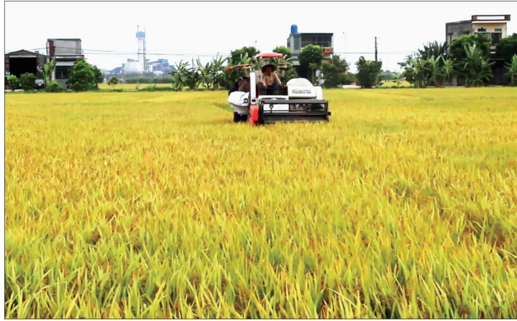
Thu hoạch lúa xuân tại xã Đông Quyet (Tiền Hải).

Những năm qua, các địa phương trên địa bàn huyện Tiền Hải đã liên kết sản xuất lúa giống với Công ty Cổ phần