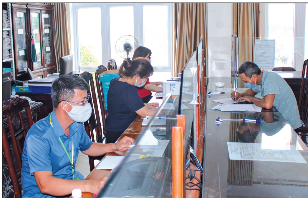
Hoạt động ở bộ phận thu thuế trước bạ Chi cục Thuế khu vực Quỳnh Phụ - Hưng Hà.

Được thành lập trên cơ sở sáp nhập Chi cục Thuế huyện Quỳnh Phụ và Chi cục Thuế huyện Hưng Hà, đến nay, sau hơn 1 năm sáp nhập, Chi cục Thuế khu vực Quỳnh Phụ - Hưng Hà luôn là điểm sáng trong toàn ngành về thu ngân sách nhà nước. Mặc dù mới chỉ hết tháng 5/2021 nhưng số thu ngân sách do Chi cục thực hiện ước đạt hơn 537 tỷ đồng, đạt 126% dự toán năm 2021.