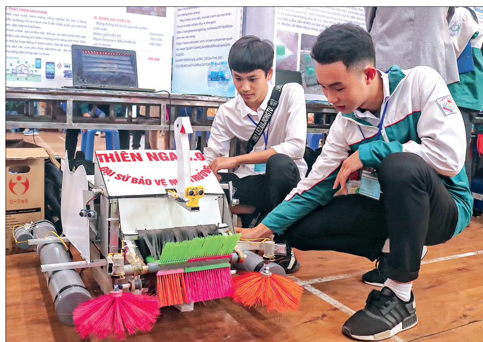
Sản phẩm khoa học do học sinh Thái Bình sáng chế.

lý giáo dục, giáo viên các cấp nhìn chung đủ về số lượng, bảo đảm chuyên môn nghiệp vụ theo cơ cấu vị trí việc làm. Chất lượng đội ngũ nhà giáo của tỉnh ngày càng được nâng cao, có trình độ đạt chuẩn và trên chuẩn cao, phẩm chất