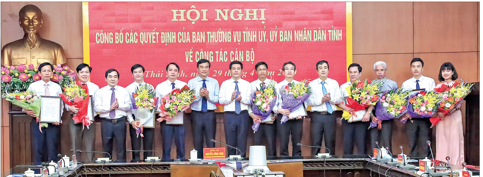
Các đồng chí Thường trực Tỉnh ủy trao quyết định và tặng hoa chúc mừng các đồng chí được điều động, bổ nhiệm.