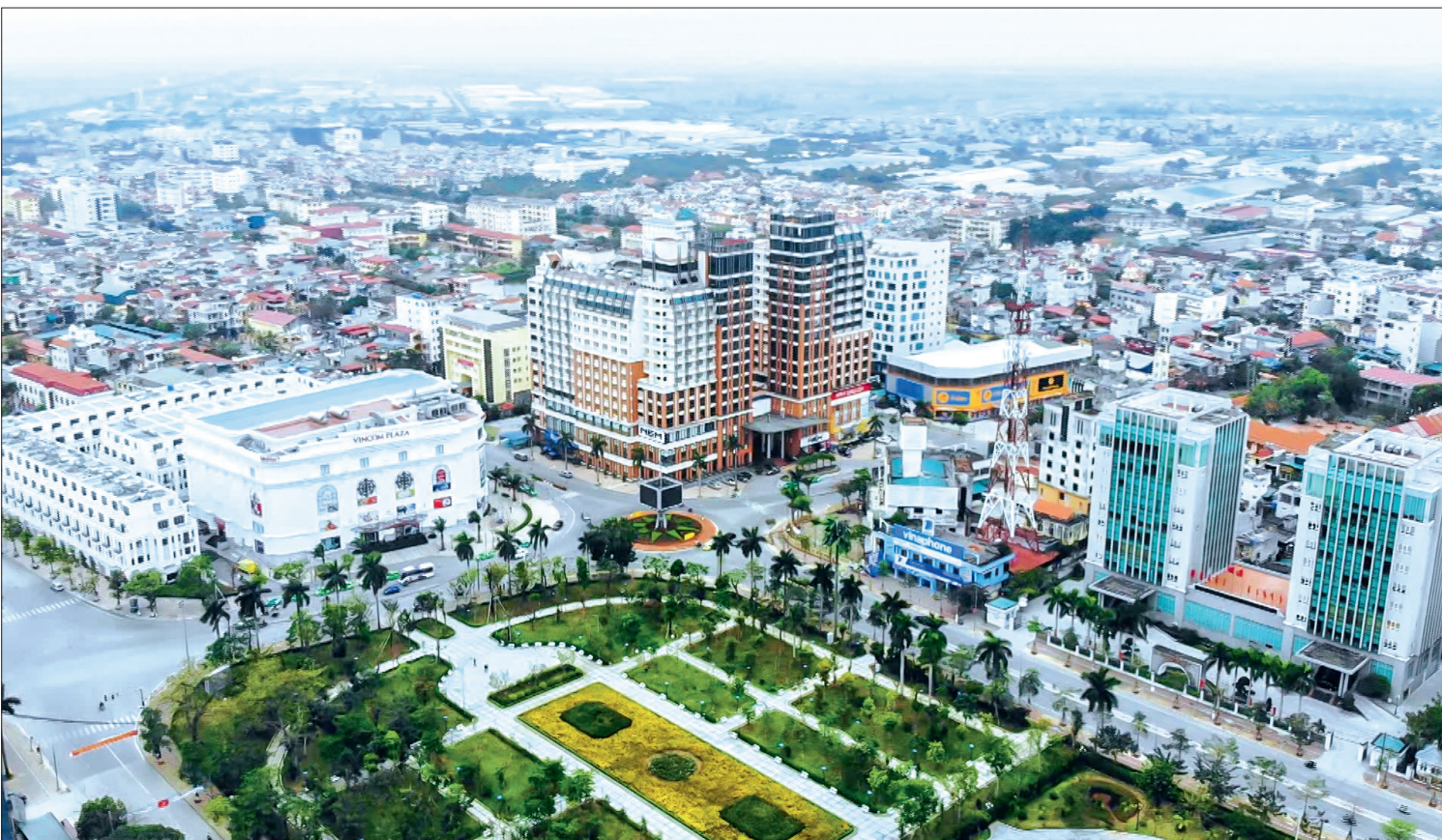
Quê hương Thái Bình ngày càng đổi mới và phát triển.

Cách đây tròn 45 năm, vào lúc 11 giờ 30 phút ngày 30/4/1975 lá cờ chiến thắng của Mặt trận Dân tộc Giải phóng miền Nam Việt Nam phấp phới tung bay trên nóc dinh Độc Lập, đánh dấu một mốc son chói lọi trong lịch sử dân tộc đó là giải phóng hoàn toàn miền Nam, thống nhất đất nước. Chiến công vang dội đó không chỉ là những giá trị tinh thần vĩ đại mà còn là bài học để Thái Bình phát huy xây dựng quê hương ngày càng giàu đẹp, văn minh.