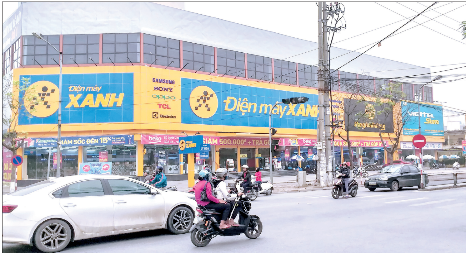
Các siêu thị làm thay đổi thói quen mua sắm của người dân.

5 năm trở lại đây, giá trị thương mại, dịch vụ của tỉnh luôn đạt tăng trưởng năm sau cao hơn năm trước. Có được những kết quả đó chính là nhờ chủ trương cơ cấu lại hoạt động lĩnh vực thương mại và nhiều chính sách thu hút đầu tư phát triển hạ tầng của tỉnh đã được triển khai.