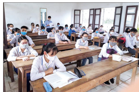
Học sinh Trường THPT Nguyễn Du ngồi giãn cách khi đến trường.