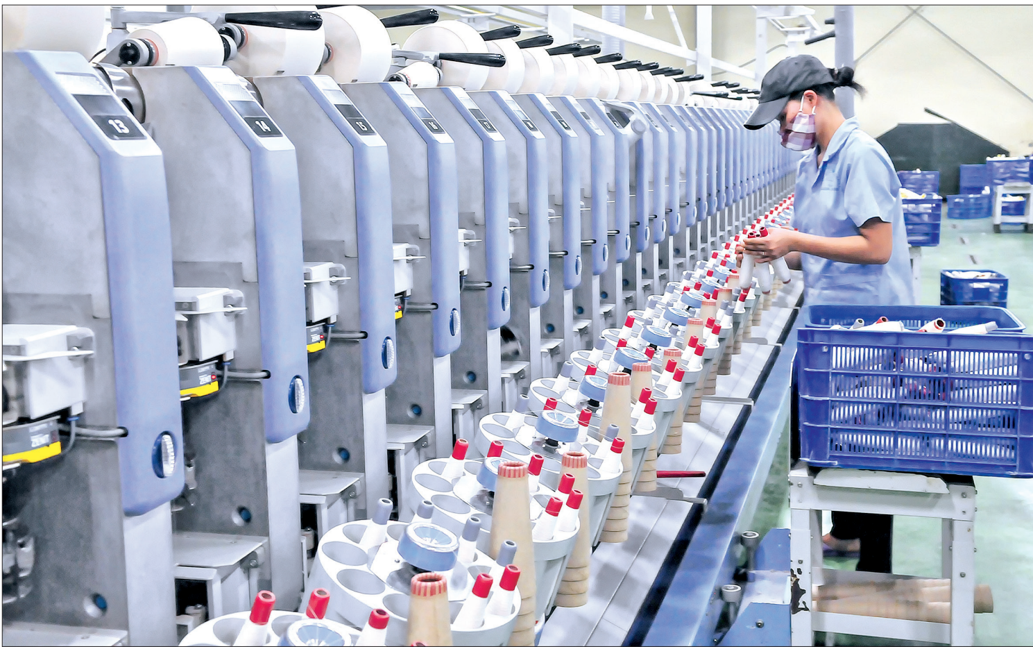
Dây chuyền sản xuất sợi của Công ty Cổ phần Sợi Trà Lý.

Đồng hành với sự phát triển của tỉnh ngành Tài chính đã vượt mọi khó khăn, huy động mọi nguồn lực, khai thác kịp thời các tiềm năng, lợi thế phục vụ phát triển kinh tế - xã hội, từng bước nâng cao đời sống nhân dân.