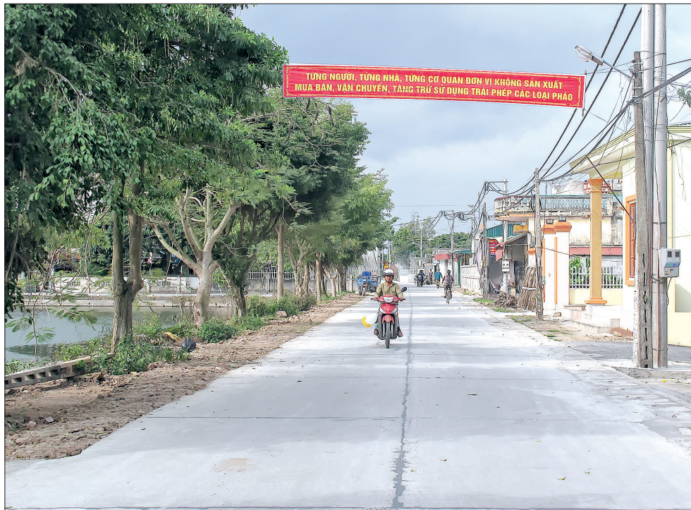
Diện mạo nông thôn mới thôn Sơn Đông, xã Quỳnh Giao (Quỳnh Phụ).

Trong những năm đầu thực hiện công cuộc đổi mới, Thái Bình đã tập trung thực hiện chương trình “điện, đường, trường, trạm”, với phương châm “nhà nước và nhân dân cùng làm”. Tuy nhiên, việc huy động các nguồn đóng góp để xây dựng cơ sở hạ tầng quá sức dân; quá trình quản lý tài chính, ngân sách ở địa phương thiếu dân chủ; một số cán bộ xã có sai phạm