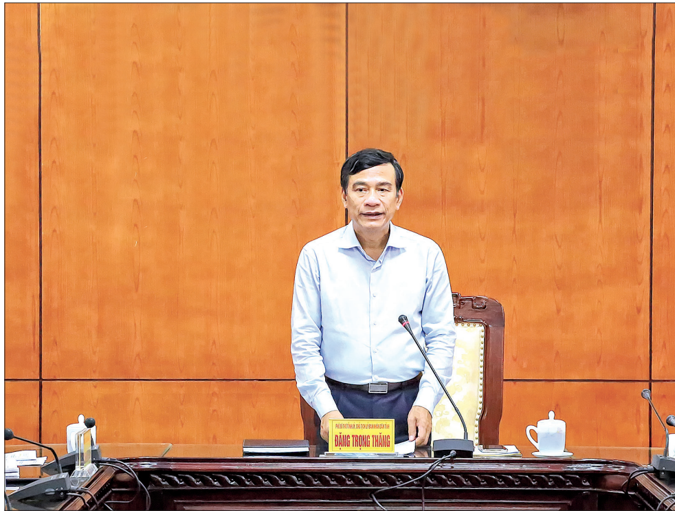
Đồng chí Đặng Trọng Thăng, Phó Bí thư Tỉnh ủy, Chủ tịch UBND tỉnh phát biểu tại cuộc họp.

Phát biểu kết luận cuộc họp, cùng với việc ghi nhận kết quả triển khai thực hiện đề án ở các sở, ngành, địa phương, đồng chí Đặng Trọng Thăng, Phó Bí thư Tỉnh ủy, Chủ tịch UBND tỉnh cũng chỉ ra một số tồn tại như: công tác tuyên truyền chưa có trọng tâm, trọng điểm, chưa đạt yêu cầu đề ra; quyết tâm của các sở, ngành, địa phương chưa cao và chưa có hành động cụ thể trong thực hiện đề án; chưa có giải pháp thực hiện phù hợp với tình hình