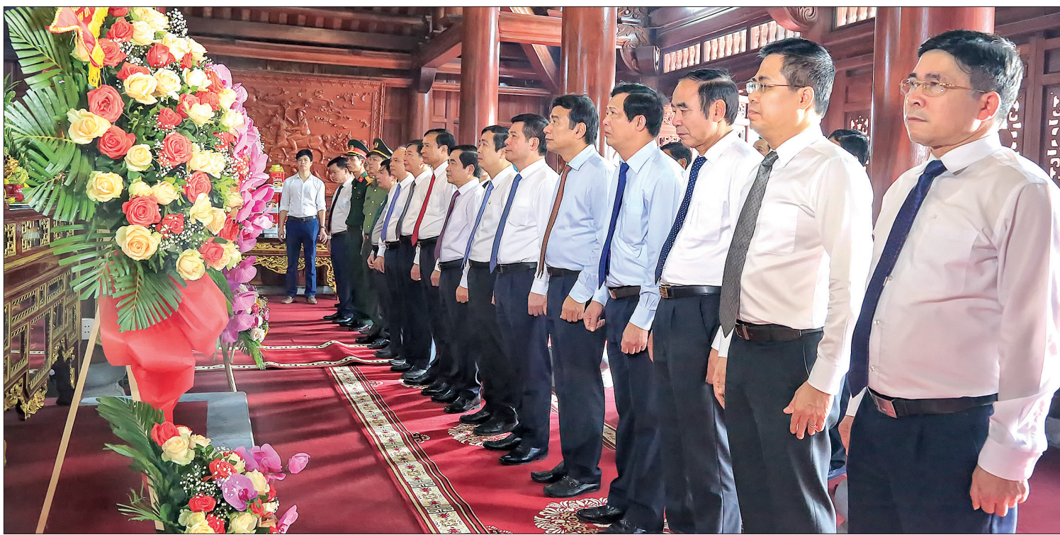
Các đồng chí lãnh đạo tỉnh dâng hương tưởng niệm Chủ tịch Hồ Chí Minh tại Đền thờ Bác Hồ.

Kỷ niệm 45 năm ngày giải phóng miền Nam, thống nhất đất nước (30/4/1975 - 30/4/2020), sáng ngày 29/4, Ban Thường vụ Tỉnh ủy tổ chức lễ dâng hương tưởng niệm Chủ tịch Hồ Chí Minh tại Đền thờ Bác Hồ (phường Hoàng Diệu, thành phố Thái Bình), đồng chí Nguyễn Đức Cảnh tại Tượng đài đồng chí Nguyễn Đức Cảnh (Quảng trường 14 - 10, thành phố Thái Bình) và viếng các anh hùng liệt sĩ tại Đền thờ Liệt sĩ tỉnh.