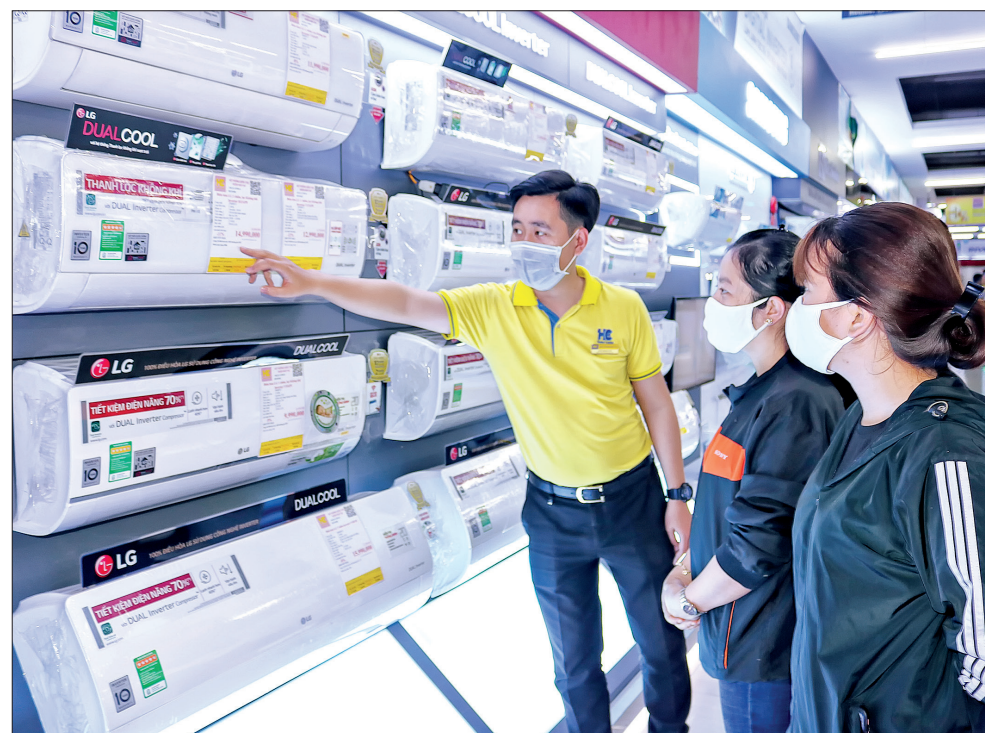
Người dân có xu hướng mua sắm tại các siêu thị, trung tâm thương mại.

biệt quan tâm. Từ năm 2016 đến nay, được sự hỗ trợ của Bộ Công Thương và UBND tỉnh, Sở Công Thương đã tổ chức thành công 7 kỳ hội chợ triển lãm. Từ các nguồn kinh phí khuyến thương, hàng năm, Sở Công Thương cũng hỗ trợ cho các doanh nghiệp của tỉnh tham gia từ 9 - 10 hội chợ ở các tỉnh, thành phố trong cả nước. Trung tâm Xúc tiến thương mại triển khai tham gia 4 gian hàng trưng bày các sản phẩm tiêu biểu có thể mạnh xuất khẩu của tỉnh tại hội chợ kinh tế thương mại biên giới Trung - Việt tổ chức tại Lào Cai góp phần quảng bá, giới thiệu tiềm năng, thế mạnh của tỉnh và một số sản phẩm tiêu biểu của tỉnh. Đây cũng là cơ hội để các đơn vị, doanh nghiệp của tỉnh mở rộng thị trường trong nước và xúc tiến