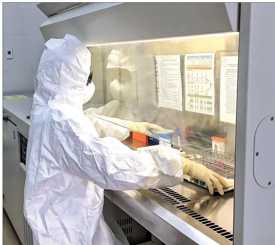
Cán bộ Trung tâm Kiểm soát bệnh tật tỉnh xử lý mẫu bệnh phẩm của người nghi nhiễm Covid-19.