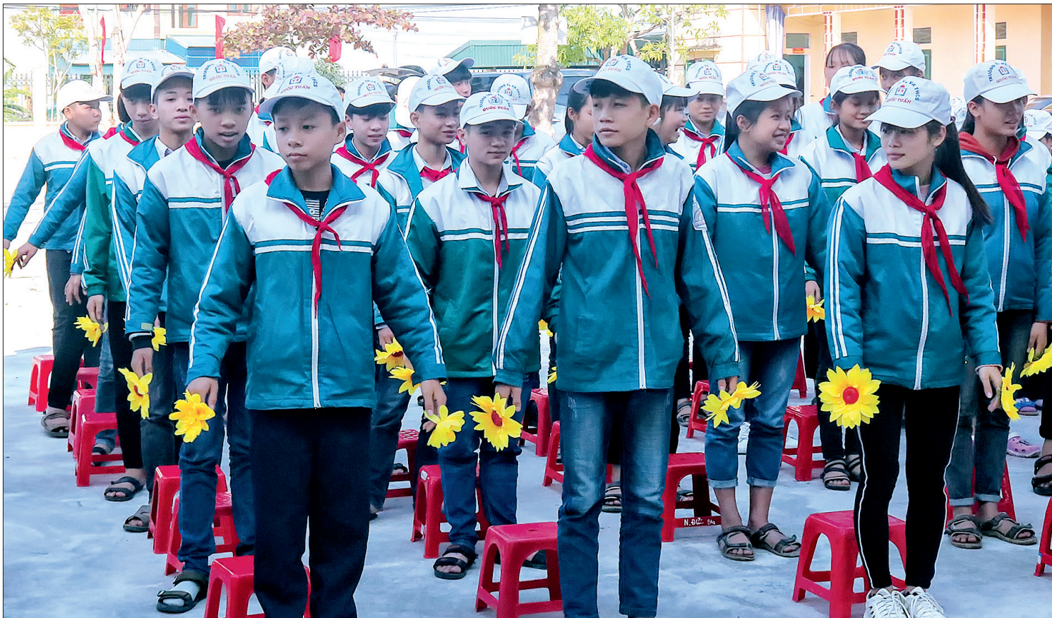
Màn đồng diễn của học sinh Trường Tiểu học và THCS Quốc Tuấn (Kiến Xương).

Năm học 2019 - 2020 là năm học thực hiện sơ kết 5 năm triển khai Nghị quyết số 29 về đổi mới căn bản, toàn diện giáo dục và đào tạo, đồng thời cũng là năm học chuẩn bị các điều kiện để triển khai chương trình giáo dục phổ thông mới. Những thành quả đạt được trong 5 năm qua chính là cú hích trong công cuộc đổi mới giáo dục và đào tạo tại Thái Bình, cũng là bước đệm quan trọng để toàn ngành bước vào một giai đoạn phát triển mới.