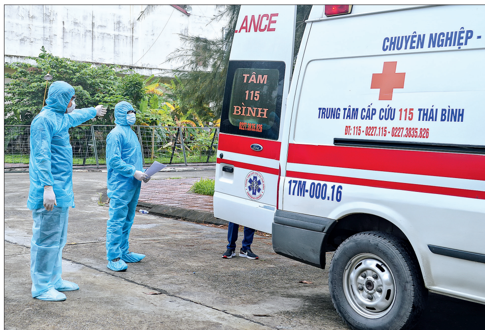
Cán bộ y tế chuẩn bị tiếp nhận người vào khu cách ly tập trung của tỉnh.

nhiễm, nghi nhiễm là hàng chục, thậm chí là hàng trăm người tiếp xúc gần. Thời điểm vất vả nhất của Khoa là khi Bộ Y tế công bố Bệnh viện Bạch Mai là ổ định, cán bộ của Khoa đã phối hợp rà soát tất cả những người Thái Bình có liên quan đến Bệnh viện Bạch Mai. Trong số hơn 1.100 người đã từng đến khám, điều trị tại Bệnh viện Bạch Mai, có khoảng 200 bệnh nhân nhưng không có địa chỉ cụ thể, rõ ràng, cán bộ của Khoa phải rà soát thông qua đầu mối các bệnh viện trong tỉnh và công