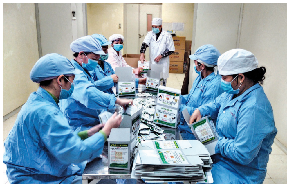
Hoạt động sản xuất tại Công ty Sản xuất thuốc thú y Việt Trung.