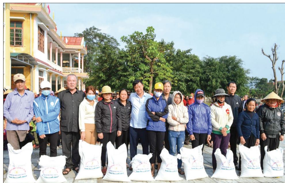
Đại diện Hiệp hội Doanh nghiệp huyện Hưng Hà trao quà hỗ trợ đồng bào bị lũ lụt ở huyện Quảng Trạch (Quảng Bình).