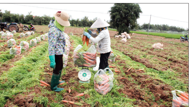
Mô hình tích tụ ruộng đất trồng cà rốt tại xã Diệp Nông (Hưng Hà) cho hiệu quả kinh tế cao.