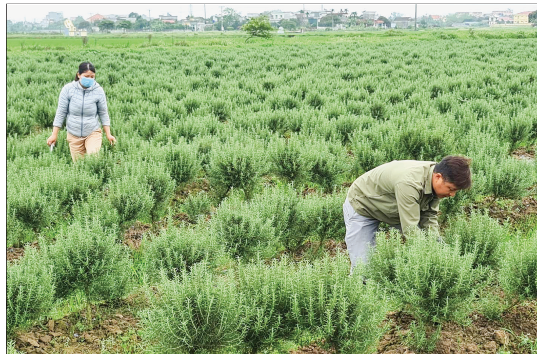
Cảnh đồng hơn 10ha trồng cây Hương Thảo của Hợp tác xã Hoàng Minh tại xã Quỳnh Hống (Quỳnh Phụ).