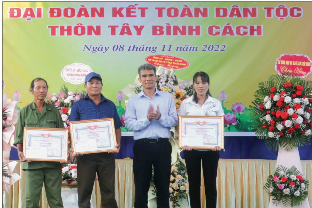
Lãnh đạo Ủy ban MTTQ huyện Đông Hưng trao giấy khen cho các gia đình văn hóa tiêu biểu thôn Tây Bình Cách, xã Đông Xá.

Ủy ban MTTQ các cấp huyện Đông Hưng đã đa dạng hóa các hình thức tập hợp, phát huy sức mạnh khối đại đoàn kết toàn dân thực hiện các nhiệm vụ phát triển kinh tế - xã hội, bảo đảm quốc phòng, an ninh tại địa phương và mang lại hiệu quả thiết thực.