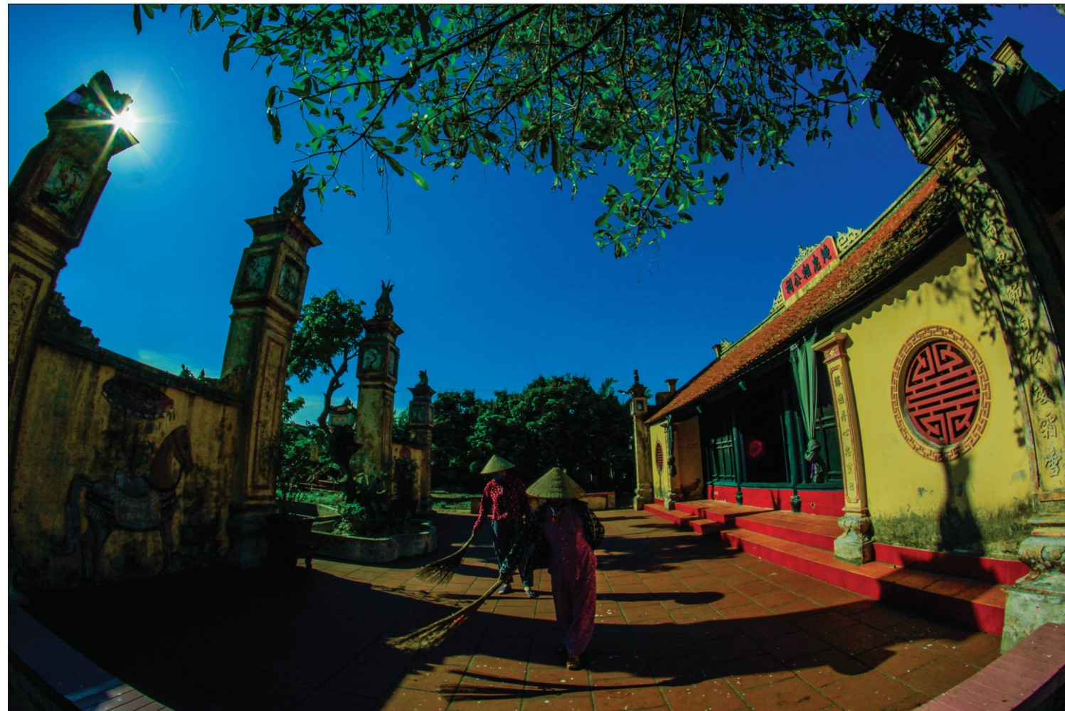
Từ đường Ngô Quang Bích - di tích lịch sử cấp quốc gia tại làng Trình Phố, xã An Ninh, huyện Tiên Hải.

Để thực thi kế sách lớn, Nguyễn Quang Bích đã đưa quân từ Tiên Động lên Nghĩa Lộ lập triều đình kháng chiến và triển khai việc đón vua Hàm Nghi ra Bắc. Ông cử Lãnh Hoan cùng Nguyễn Cao vào Quảng Bình đón Hàm Nghi thì chẳng may Nguyễn Cao bị Pháp bắt và tiếp đó vua Hàm Nghi cũng bị bắt, đày đi châu Phi. Giặc cho hai binh đoàn tiến đánh Nghĩa Lộ. Nghĩa quân đã chống trả quyết liệt gây cho Pháp nhiều thiệt hại nặng, buộc phải rút lui. Phía quân của ta cũng tổn thất nặng nề. Nguyễn Quang Bích cho quân lui binh về châu Yên Lập, dựng căn cứ Tôn Sơn chỉ đạo phong trào toàn Bắc Kỳ, tổ chức nhiều trận đánh thắng lợi. Giặc tiến đánh nhiều lần đều bị thất bại, bèn gửi thư dụ hàng, hứa sẽ