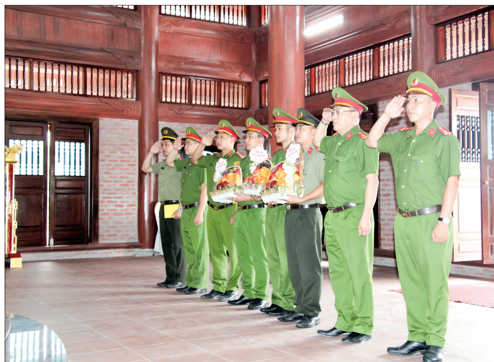
Cán bộ, chiến sĩ Công an huyện Đông Hưng dâng hương tưởng nhớ Đại tướng Võ Nguyên Giáp.

cũng như nhân dân Nguyên Xá luôn noi theo gương Đại tướng sống, chiến đấu hết mình, tích cực lao động, sản xuất giỏi chi viện cho chiến trường đánh thắng quân xâm lược, chung tay xây dựng Nguyên Xá đạt chuẩn nông thôn mới năm 2015, đang phấn đấu trở thành xã nông thôn mới nâng cao cuối năm 2022.