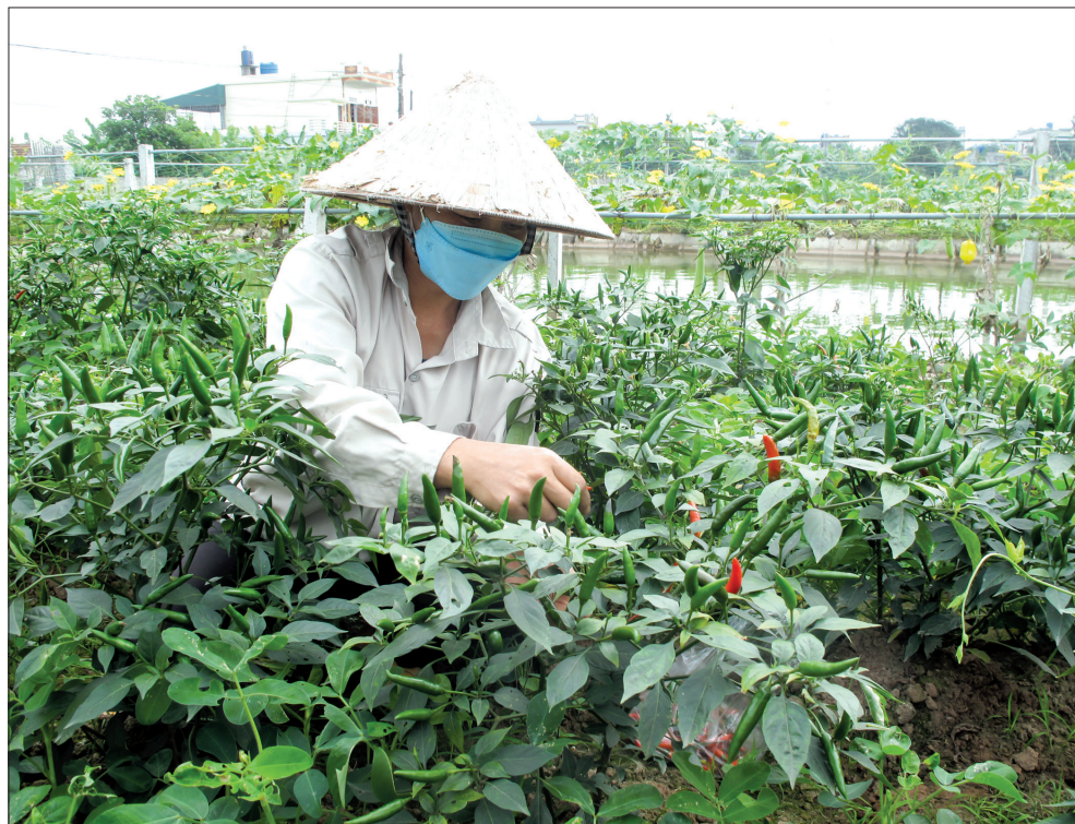
Chuyển đổi cơ cấu cây trồng giúp nhiều người dân xã Đông Trà (Tiên Hải) nâng cao thu nhập.

6 tháng đầu năm 2022, cấp ủy 2 cấp và chi bộ đã hoàn thành 31/77 cuộc kiểm tra, 14/37 cuộc giám sát; UBKT 2 cấp đã hoàn thành 31/80 cuộc kiểm tra, 12/33 cuộc giám sát. Qua KTGS, cấp ủy, UBKT các cấp đã chỉ rõ những ưu điểm để phát huy, kịp thời phát hiện, ngăn chặn, uốn nắn, chấn chỉnh, bổ khuyết, rút kinh nghiệm đối với các tổ chức đảng, đảng viên có khuyết điểm, sai phạm. Đối với các trường hợp vi phạm đến mức phải thi hành kỷ luật đều được cấp ủy các cấp xem xét, xử lý kịp thời, nghiêm minh theo đúng quy định của Điều lệ Đảng. Trong 6 tháng đầu năm 2022 đã đình chỉ sinh hoạt và thi hành kỷ luật đảng 16 đảng viên, qua đó góp phần cảnh báo, răn đe, phòng ngừa vi phạm trong tổ chức đảng, trong cán bộ, đảng viên; giữ vững nguyên tắc, kỷ luật, kỷ cương của Đảng; nâng cao sức chiến đấu, năng lực lãnh đạo của Đảng, góp phần thực hiện thắng lợi các nhiệm vụ chính trị của huyện.