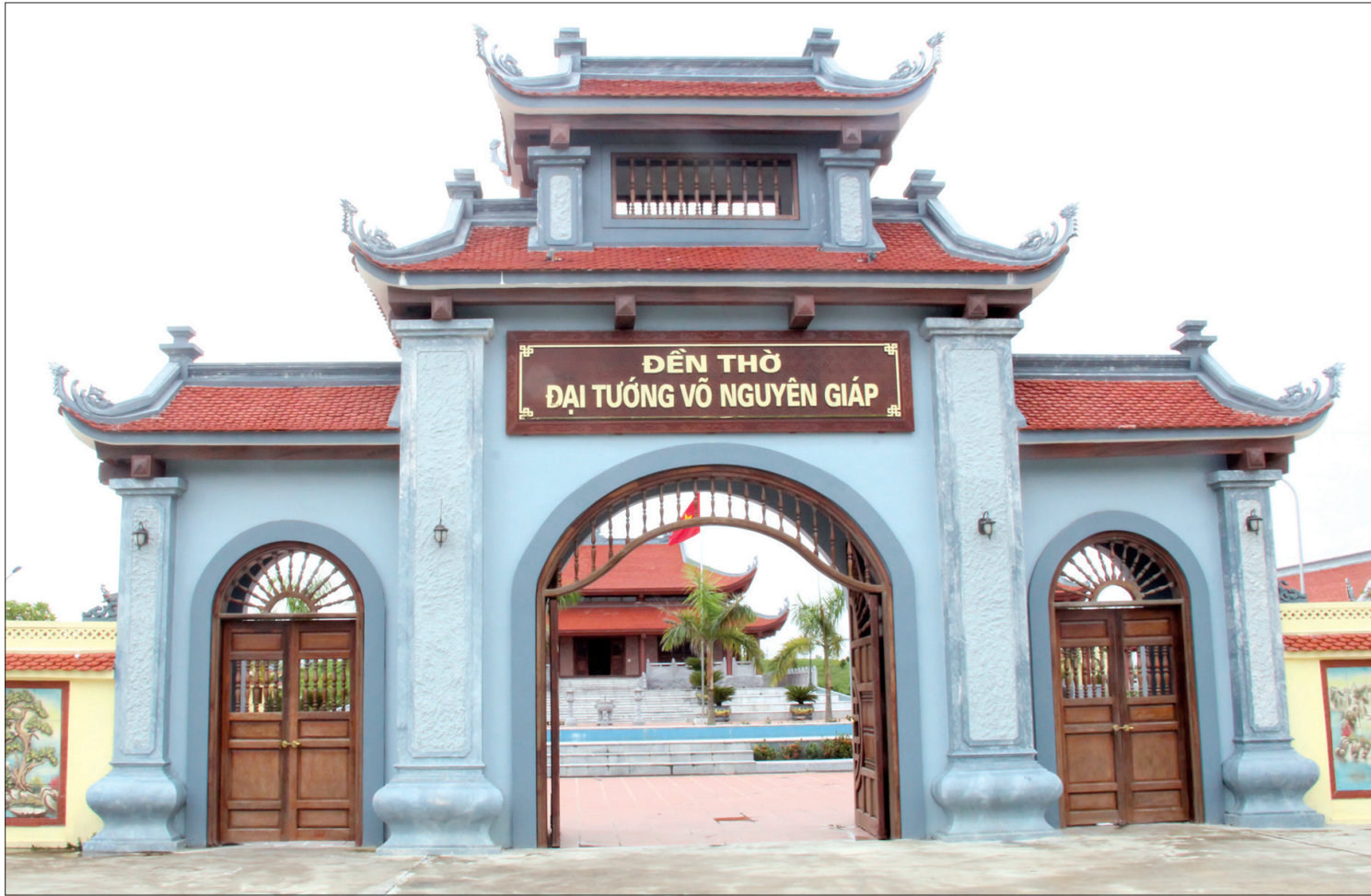
Đền thờ Đại tướng Võ Nguyên Giáp, xã Nguyên Xá (Đông Hưng), nơi tưởng nhớ, tri ân công lao vị tướng tài ba.

Hòa trong không khí những ngày thu Tháng Tám lịch sử, cán bộ và nhân dân tỉnh Thái Bình nói chung, huyện Đông Hưng nói riêng lại nhớ về Đại tướng Võ Nguyên Giáp, cùng đến Đền thờ Đại tướng ở xã Nguyên Xá dâng nén tâm nhang tỏ lòng thành kính, biết ơn sâu sắc công lao to lớn của vị Tổng Tư lệnh đầu tiên của Quân đội nhân dân Việt Nam.