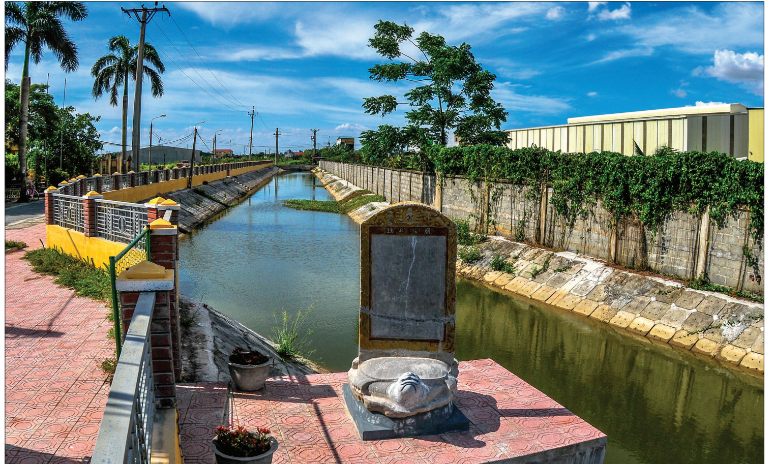
Bia đá cổ trước đình Miếu, thôn Tô Hiệu, xã Đông Quang, huyện Đông Hưng vẫn được nhân dân làng Miếu coi sóc, bảo vệ.

Thời cuối nhà Lý (1010 - 1225), làng Miếu lúc ấy chưa có tên gọi, chỉ có hai gia đình; sang thời nhà Trần (1226 - 1400) làng có nhiều dòng họ khác tới khai hoang, sinh cơ lập nghiệp, sinh sôi, nảy nở, người đông dần, làng chia thành phe, giáp. Đến thời nhà Lê, năm 1697 các dòng họ, phe, giáp trong làng đã trình vua xin cho được lập làng. Triều đình nhà Lê đã chuẩn y. Làng được mang tên "Miếu", trực thuộc hương Động Nhuế, huyện Thanh Lan, phủ Tiên Hưng. Miếu có nghĩa là rừng nhỏ, làng Miếu nghĩa là làng có cánh rừng nhỏ và tên làng đi vào tiềm thức dân gian từ đó.