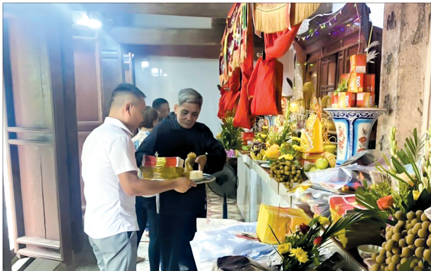
Con cháu dòng họ Hoàng, xã Vũ Phúc (thành phố Thái Bình) dâng hương nhớ ơn tổ tiên.

"Con người có tổ, có tông/Như cây có cội, như sông có nguồn". Trên mảnh đất hình chữ S, tự xa xưa tới nay luôn coi trọng vai trò của dòng họ bởi đây được xem như "cái nôi" sản sinh ra nhiều nhân tài, tuấn kiệt cho đất nước, là nơi kho tàng văn hóa, lịch sử được gìn giữ, trao truyền, tiếp nối qua nhiều thế hệ. Với những nét đặc trưng, độc đáo ấy, dòng họ đã trở thành hạt nhân hun đúc, bồi đắp và phát huy nét đẹp của văn hóa, văn minh dân tộc.