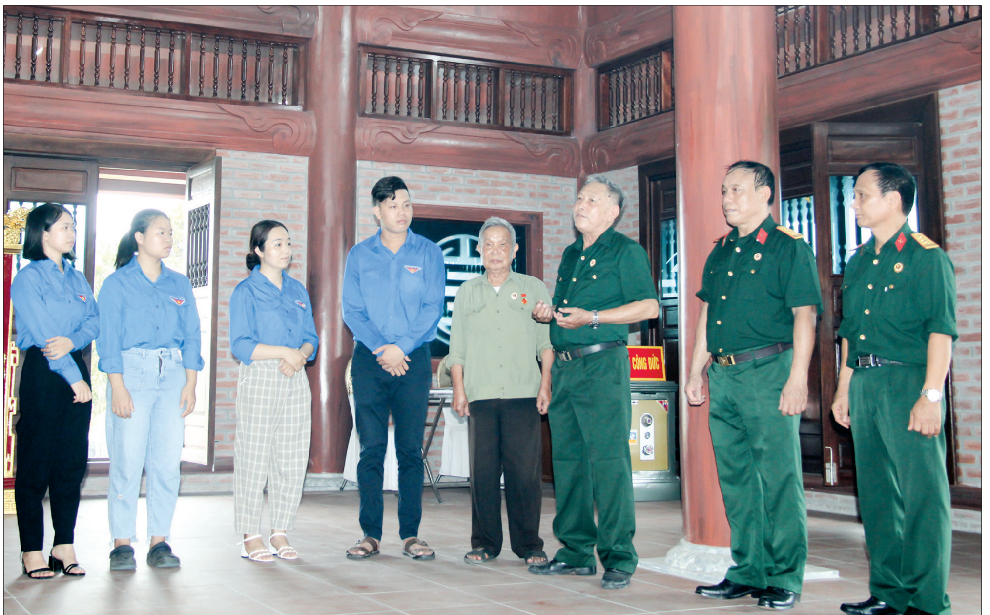
Các cựu chiến binh giới thiệu về Đền thờ, về Đại tướng Võ Nguyên Giáp cho đoàn viên, thanh niên tại Đền thờ Đại tướng Võ Nguyên Giáp, xã Nguyên Xá (Đông Hưng).