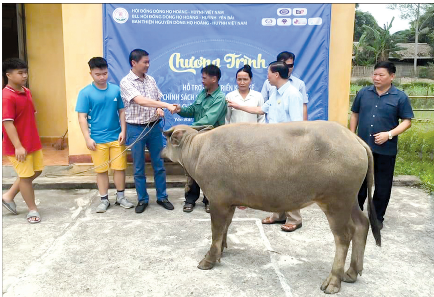
Chương trình trao tặng trâu cho các hộ gia đình có hoàn cảnh khó khăn của dòng họ Hoàng - Huỳnh Việt Nam.

Với mục đích "Tập hợp - Đoàn kết - Tương trợ - Phát triển" và phương châm "Tìm về cội nguồn - Tôn vinh tổ tiên - Động viên con cháu", hội đồng dòng họ Hoàng - Huỳnh trong từng giai đoạn phát triển luôn là nơi tập hợp con cháu trong dòng họ, cùng nhau giữ vững, phát huy truyền thống tốt đẹp của tổ tiên, đóng góp vào sự nghiệp vẻ vang của đất nước.