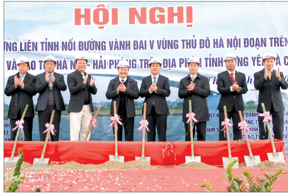
Các đồng chí lãnh đạo hai tỉnh Thái Bình - Hưng Yên cùng đại diện nhà thầu thực hiện nghi thức động thổ công trình.