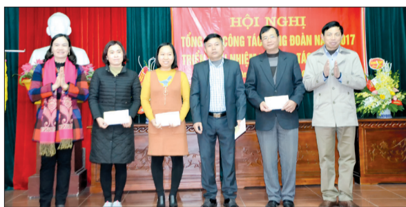
Đại diện các công đoàn cơ sở tiếp nhận quà tết cho công nhân có hoàn cảnh khó khăn.

Sáng ngày 9/2, Liên đoàn Lao động thành phố Thái Bình tổ chức hội nghị tổng kết công tác công đoàn năm 2017, triển khai nhiệm vụ năm 2018.