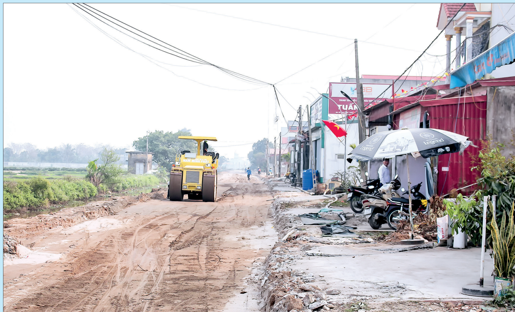
Thi công đường ĐH.95 đoạn từ xã Thụy Phong đến xã Thụy Ninh.