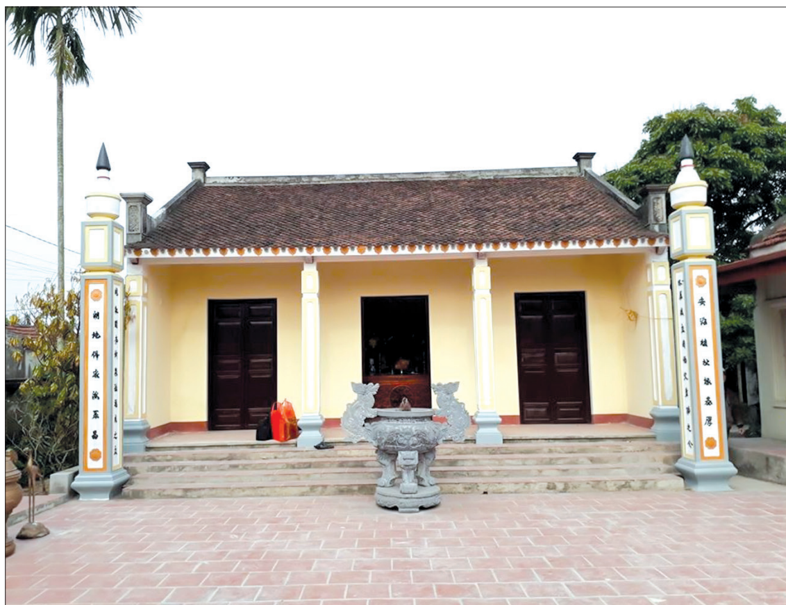
Từ đường Doãn Uẩn ở thôn Hội (làng Ngoại Lãng), xã Song Lãng, huyện Vũ Thư.

Cho đến nay ở nhiều thành phố trong nước có đường phố, trường học mang tên Doãn Uẩn. Hầu hết các di tích thờ ông đã được xếp hạng di tích lịch sử văn hóa. Đó là sự tôn vinh một người con ưu tú của Thái Bình với những cống hiến to lớn trong sự nghiệp giữ gìn hải phận, biên cương Tổ quốc ở phương Nam.