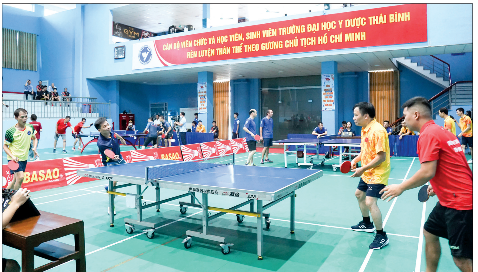
Các trận đấu diễn ra sôi nổi.