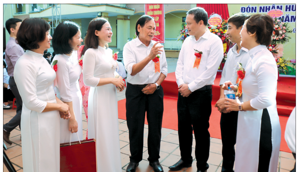
Các thế hệ học sinh Trường THPT Quỳnh Côi phấn khởi được gặp lại thầy cô, bạn bè.