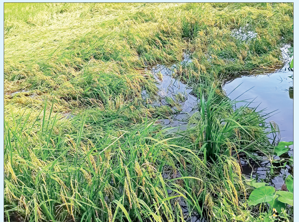
Lúa mùa tại xã Thuận Thành (Thái Thụy) bị đổ do mưa lớn.