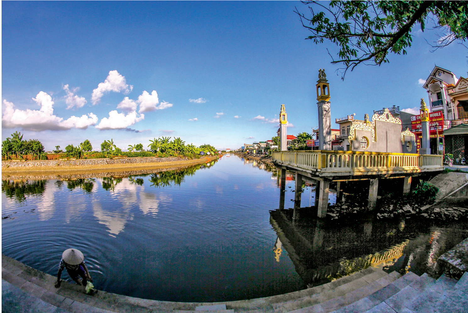
Sông Bơi, bến Ngự - dấu tích cổ xưa của làng Lại Trì, xã Tây Sơn, huyện Kiến Xương gắn với tục bơi chải từ ngàn đời vẫn được duy trì đến ngày nay.

Những người dân từ nhiều miền đất di cư đến vùng đất hạ lưu sông Hồng, sông Luộc, sông Trà Lý, Diêm, Diêm Hộ... phải thích nghi với môi trường sông nước, muốn tồn tại, họ phải đối mặt với bão, lũ. Môi trường sống ẩm thấp vì xung quanh là nước nhưng nhờ nước mà có nhiều tôm, cá giúp họ bảo đảm cuộc sống. Và cũng vì sông ngòi chằng chịt nên nước (nước sông, ngòi, ao hồ) vừa là nguồn thủy sản phong phú nhưng cũng là “thủy tặc, thủy quái” luôn rình rập, đem theo nhiều ẩn họa cho người dân bên bờ sông nước. Nước là “ân nhân” và đôi khi cũng thành “thủy thần” nhập thế nên ở tỉnh ta, miếu “Long thần” nhiều hơn lâu “Thổ địa”, thần Hà Bá, Long Vương... nhiều hơn thần núi và các đền đài tiêu biểu đều gắn với Long thần.