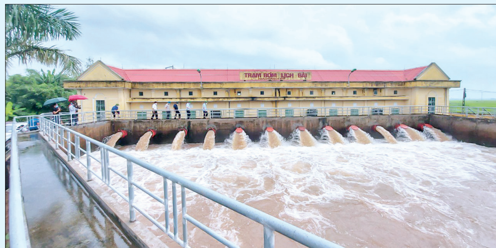
Trạm bơm Lịch Bài (xã Vũ Hòa, huyện Kiến Xương) hoạt động hết công suất để tiêu úng cho lúa và cây màu.