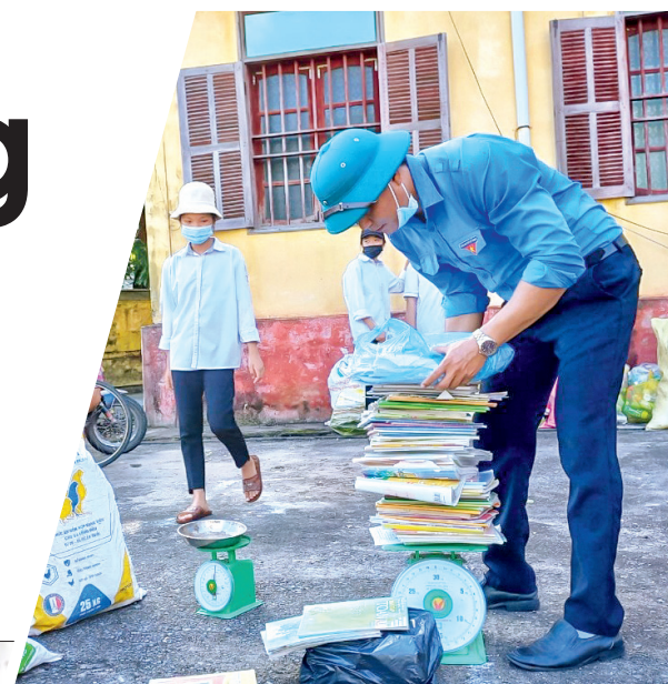
Mô hình đổi phế liệu lấy khẩu trang y tế và xà phòng của Đoàn Thanh niên xã Nam Trung (Tiền Hải).

Thời gian qua, tuổi trẻ Tiền Hải đã có nhiều hoạt động thiết thực phát huy vai trò xung kích, tình nguyện của thanh niên chung tay phòng, chống dịch Covid-19, bảo vệ sức khỏe cộng đồng.