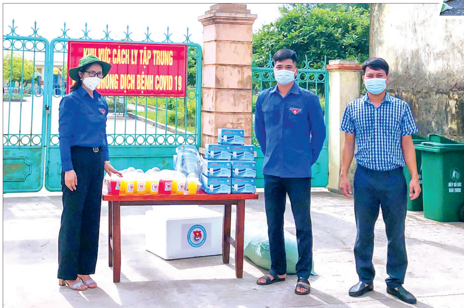
Huyện đoàn Tiền Hải trao tặng nước uống và khẩu trang y tế cho khu cách ly tập trung.

Mặc dù hàng ngày trên các phương tiện thông tin đại chúng, mạng xã hội đều tích cực tuyên truyền các thông tin phòng, chống dịch, tuy nhiên không phải ai cũng có thời gian và chủ động tiếp cận tin tức. Chính vì vậy, sự ra đời của mô hình tiếng loa di động đã phát huy hiệu quả. Chị Tô Thị Phương, Bí thư Đoàn Thanh niên xã Tây Lương cho biết: Tận dụng lợi thế của xe máy là có thể đi sâu đến từng ngõ và loa di động, ai cũng có thể nghe được, Đoàn Thanh niên xã Tây Lương đã thành lập đội hình tuyên truyền lưu động để kịp thời thông tin về tình hình dịch Covid-19 cho người dân. Đồng thời, Đoàn Thanh niên xã kết hợp tuyên truyền những chủ trương, chỉ đạo của tỉnh và địa phương để người dân nắm bắt kịp thời và các biện pháp phòng, chống dịch Covid-19, thực hiện tốt khuyến cáo “5K” của Bộ Y tế; các quy định về xử lý một số hành vi vi phạm liên quan đến phòng, chống dịch. Bên cạnh việc tuyên truyền, Đoàn Thanh niên xã Tây Lương đã tặng hơn 1.500 khẩu trang y tế, 150 kính chắn giọt bắn cho lực lượng làm nhiệm vụ phòng, chống dịch. Ông Nguyễn Xuân Huyền, thôn Trung Tiến, xã Tây Lương cho biết: Chỉ cần nghe loa lưu động phát với tần suất liên tục là tôi đã có thể cảm nhận được sự quyết liệt của các cấp chính quyền trong việc triển khai các biện pháp phòng, chống dịch, cũng như nỗ lực ổn định đời sống cho người dân trên địa bàn. Điều này khiến tôi rất vững tin, dịch bệnh sẽ nhanh