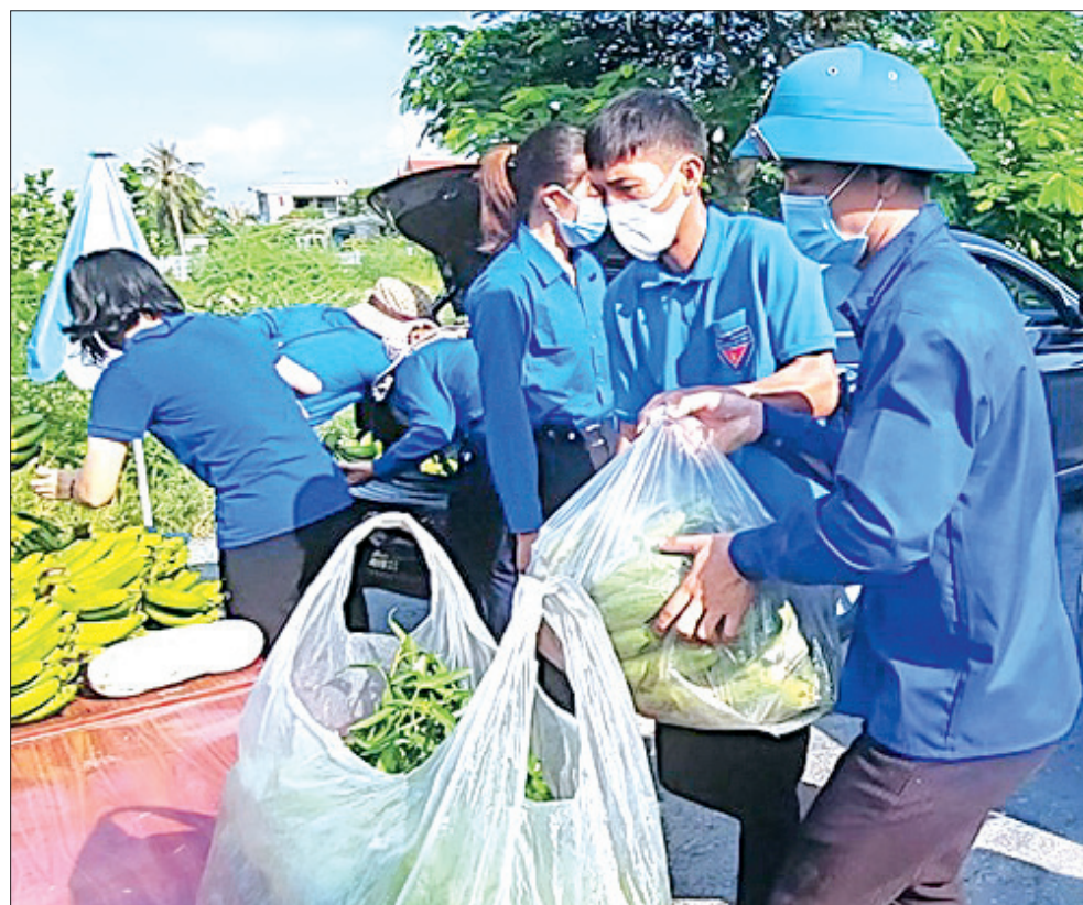
Đoàn thanh niên các xã cụm khu Nam tặng nhu yếu phẩm cho nhân dân khu vực phong tỏa thôn Thanh Lâm, xã Đông Minh (Tiền Hải).

hoạt động cụ thể, thiết thực, phù hợp với tình hình thực tế ở mỗi địa phương để tham gia phòng, chống dịch Covid-19 như: thành lập các đội thanh niên tình nguyện và đội thanh niên tình nguyện phản ứng nhanh phòng, chống Covid-19 cấp xã, thị trấn và cấp huyện; vận động