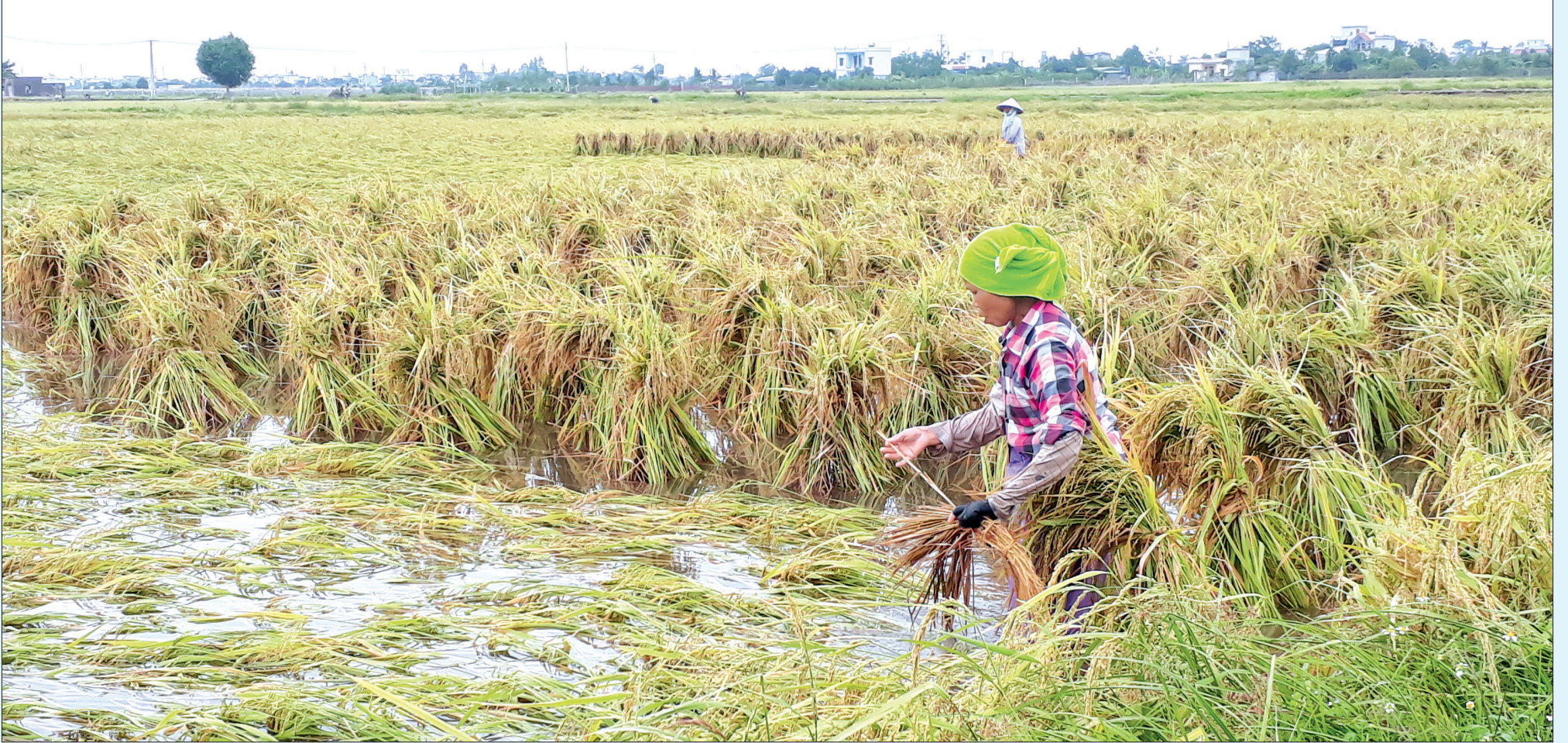
Nông dân huyện Vũ Thư buộc dựng lại diện tích lúa bị đổ.

các cống chậm, Xí nghiệp sẽ xem xét đề xuất vận hành các trạm bơm để hạ thấp nhanh nhất mực nước trong đồng, hạn chế ảnh hưởng của mưa đối với sản xuất nông nghiệp.