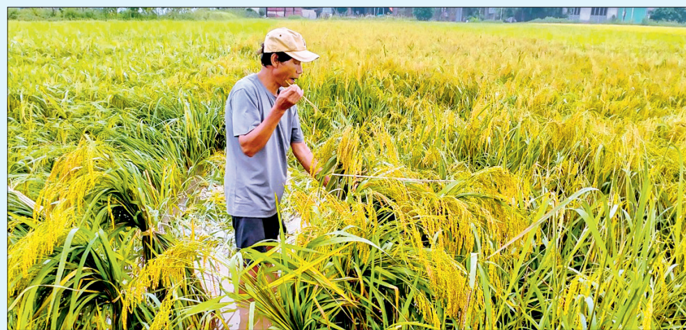
Nông dân xã Diệp Nông (Hung Hà) buộc dậm lúa mùa bị đổ do mưa lớn.