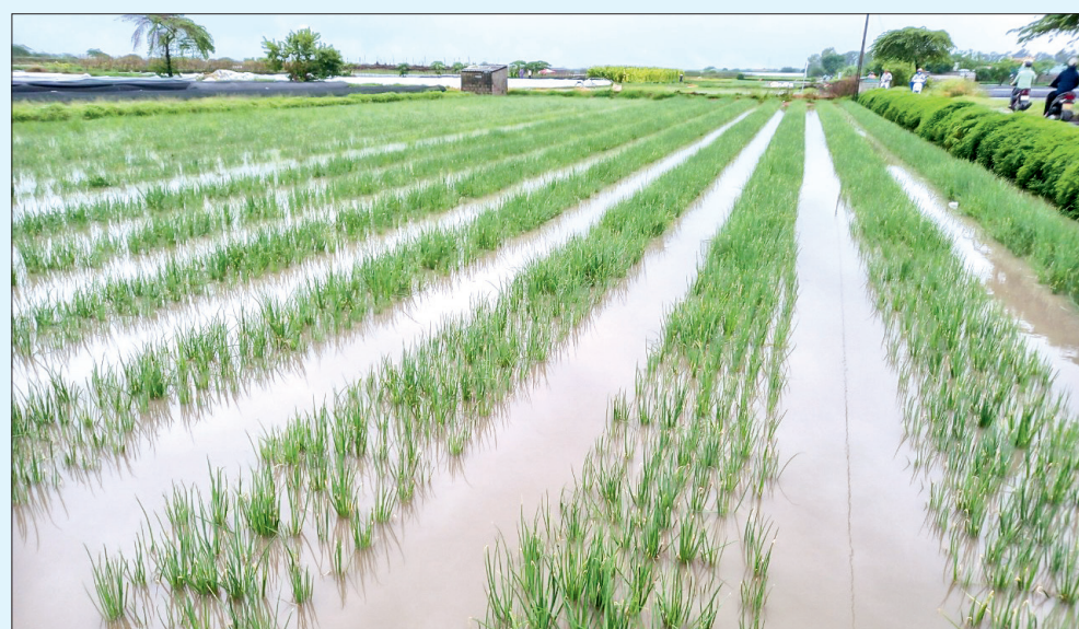
Mưa lớn khiến nhiều diện tích hành tại xã Quỳnh Hải (Quỳnh Phụ) bị ngập.