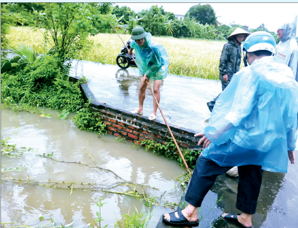
Cán bộ và nhân dân xã An Châu (Đông Hưng) khơi thông dòng chảy chống úng cho lúa và cây màu.

diện tích bị ngập nặng cục bộ. Sau mưa cần dựng buộc lại những diện tích lúa bị đổ; trồng dặm, trồng bù những diện tích cây vụ đông mới trồng bị gãy, đổ, dập nát do mưa lớn. Tiếp tục rà soát và điều chỉnh kế hoạch sản xuất cây vụ đông cho phù hợp với diễn biến tình hình thời tiết; chuẩn bị đủ nguồn hạt giống để đáp ứng đủ yêu cầu của sản xuất và dự phòng trong trường hợp phải gieo trồng lại. Sau mưa phải vệ sinh, xới xáo phá văng trên mặt luống và tiến hành các biện pháp chăm sóc theo quy trình của từng loại cây.