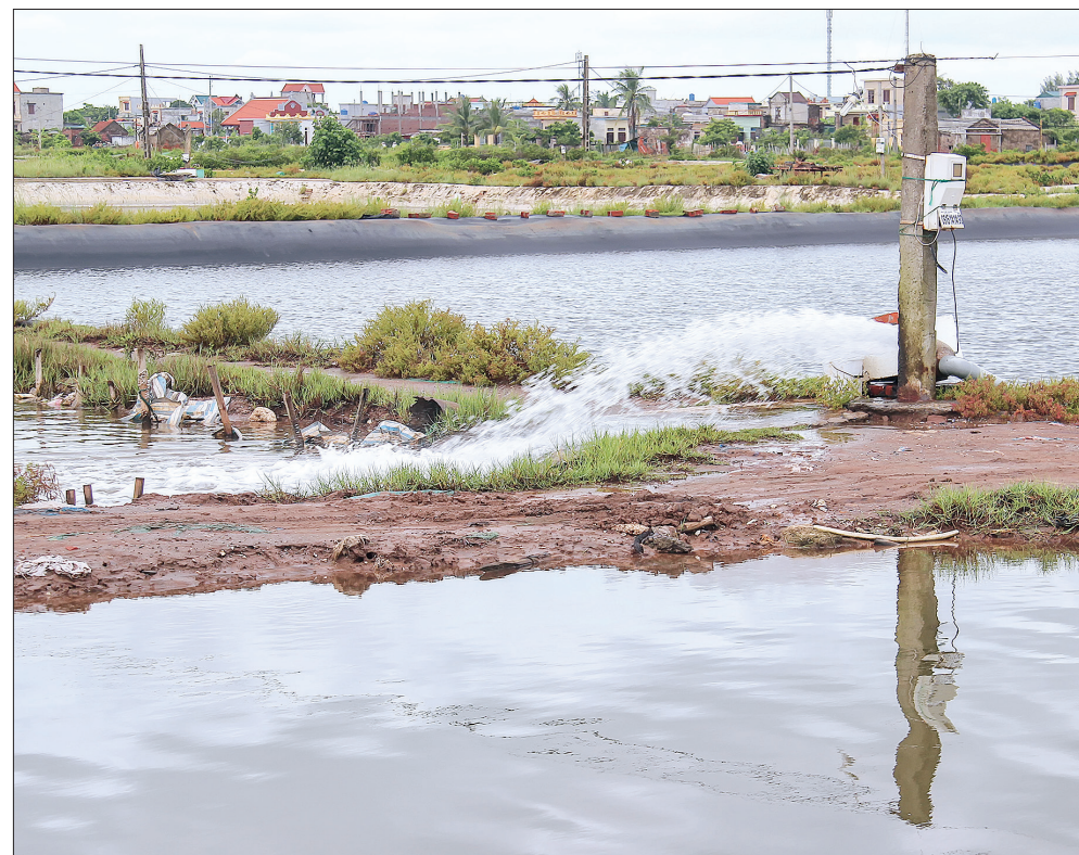
Nông dân huyện Tiên Hải tập trung tiêu thoát nước vùng nuôi trồng thủy sản.

Kiểm tra tại trạm bơm Lịch Bài và cánh đồng xã Vũ Hòa (Kiến Xương), cống Thái Hạc (Vũ Thư), đồng chí Phó Chủ tịch UBND tỉnh yêu cầu ngành Nông nghiệp chỉ đạo 2 công ty khai thác công trình thủy lợi Bắc và Nam Thái Bình phối hợp với các địa phương khơi thông dòng chảy, mở tối đa các cống dưới đê để tiêu nước, khẩn trương hạ thấp mực nước trong đồng tránh ngập úng cục bộ cho lúa mùa đang trong giai đoạn đổ đui; đồng thời, phân công cán bộ, công nhân trực 24/24 giờ tại các trạm bơm tiêu, sẵn sàng vận hành trong điều kiện khó tiêu tự chảy và thời tiết tiếp tục có mưa lớn. Các địa phương tuyên truyền, chỉ đạo nông dân buộc dậm lúa; tranh thủ thời tiết thuận lợi khẩn trương thu hoạch đối với diện tích lúa, rau màu đến kỳ thu hoạch.