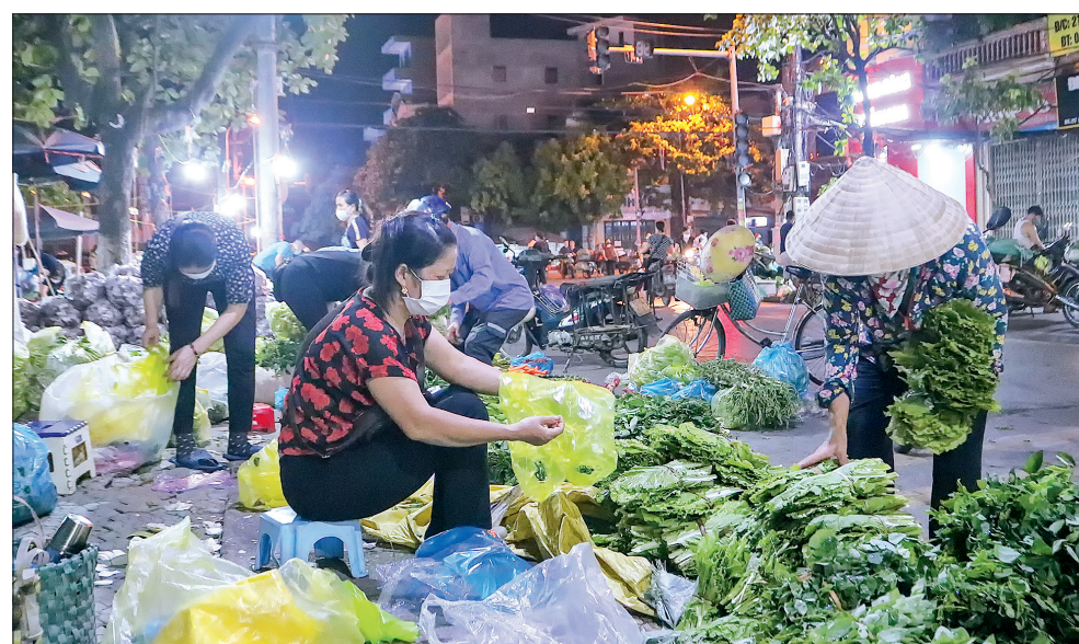
Người dân đi chọn rau buổi sớm.

Tiếng gà cầm canh chen ngang câu chuyện của người lính già đầu bạc, chợ cũng đã vãn người, 4 giờ sáng tiếng còi hiệu của Ban Quản lý chợ vang lên như lời hẹn cho buổi chợ mới, chị lao công cùng chiếc chổi tre lại cần mẫn trả lại những đoạn đường sạch sẽ cho thành phố đón bình minh. Và cũng chính từ đây trên những ngã đường, con phố, bao đóa hoa tươi cùng các loại rau, quả theo các gánh hàng tảo đi muôn ngả, nối dài thêm nhịp sống hối hả trong lòng thành phố, để bao gia đình thêm ấm bếp, nhà thơm.