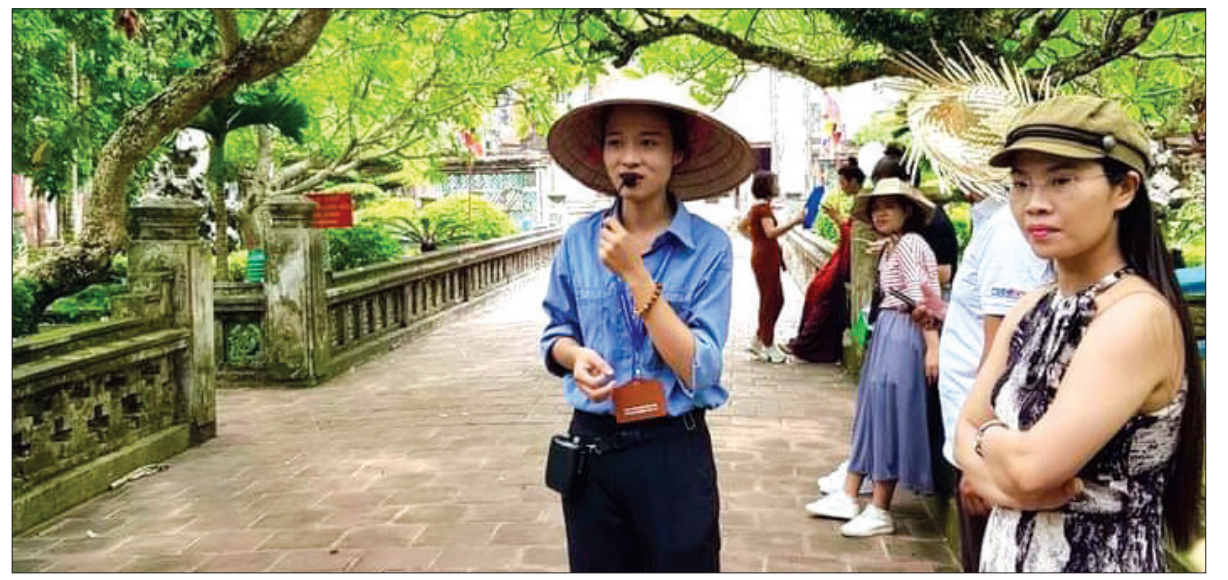
Đa phần hướng dẫn viên du lịch đều không hợp đồng với 1 đơn vị lữ hành cố định mà cộng tác theo tour, theo tuyến.

Gỡ khó cho vấn đề này, hơn một tháng qua, Hiệp hội Du lịch tỉnh đã nỗ lực hoàn tất thủ tục hồ sơ để cấp thẻ hội viên cho các HDV trên địa bàn tỉnh, góp phần tạo điều kiện thuận lợi để đội ngũ HDV có thể làm hồ sơ để nhận hỗ trợ theo Nghị quyết số 68. Trong đó, có việc kiện toàn lại các chi hội của Hiệp hội Du lịch tỉnh, quan trọng nhất ở thời điểm này là chi hội HDV bao gồm các HDV nội địa, quốc tế, outbound, inbound. Hiện nay, Hiệp hội Du lịch tỉnh đã làm việc với Hội Hướng dẫn viên du lịch Việt Nam để chuyển văn bản thành lập chi hội HDV, hồ sơ, danh sách của các HDV là thành viên của chi hội HDV (Hiệp hội Du lịch tỉnh), từ đó Hội Hướng dẫn viên du lịch Việt Nam sẽ tiến hành cấp thẻ hội viên cho các HDV du lịch trên địa bàn tỉnh. Được biết, trong những HDV được cấp thẻ hội viên đợt này, vẫn có hơn 10 HDV chưa đủ điều kiện làm hồ sơ nhận hỗ trợ do thẻ HDV du lịch đã quá hạn sử dụng. Tuy nhiên, thời hạn làm hồ sơ để được nhận hỗ trợ theo Nghị quyết số 68 còn kéo dài đến hết ngày 31/12/2021 nên các HDV này sẽ làm thủ tục nhận hỗ trợ sau khi đã được Sở Văn hóa, Thể thao và Du lịch gia hạn thẻ HDV du lịch.