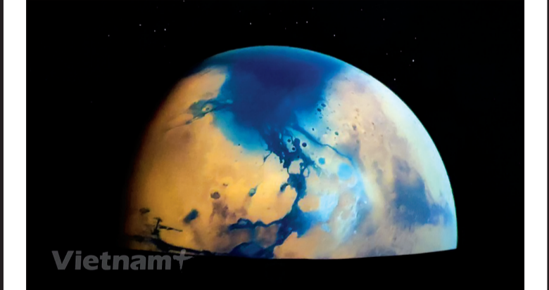
Cạnh Đài thiên văn, một nhà chiếu hình vũ trụ cũng được xây dựng với 100 chỗ ngồi, đường kính 12m, được thiết kế với màn hình dạng mái vòm (hình ảnh chụp từ một bộ phim về vũ trụ tại nhà chiếu hình). Nhà chiếu hình là công cụ cung cấp kiến thức về thiên văn, sử dụng hình ảnh trực quan để giải thích chuyển động của các vật thể trên trời và nhiều hiện tượng thiên văn lý thú.