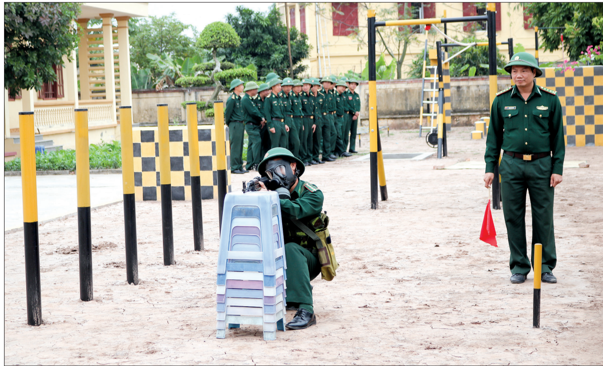
Cán bộ, chiến sĩ Đồn Biên phòng Cửa Lân huấn luyện.

Giai đoạn 2013 - 2018, phong trào thi đua quyết thắng (TĐQT) của Bộ đội Biên phòng (BĐBP) tỉnh đã trở thành động lực, tạo khí thế sôi nổi làm chuyển biến nhận thức và hành động của cán bộ, chiến sĩ, góp phần hoàn thành xuất sắc nhiệm vụ quản lý, xây dựng và bảo vệ vững chắc chủ quyền, an ninh biên giới vùng biển của tỉnh.