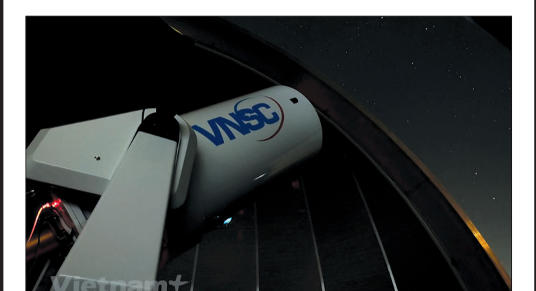
Đài thiên văn Hà Nội có một kính thiên văn quang học đường kính 0,5m, cấu trúc dẫn động đồng bộ với mái vòm điều khiển tự động, được trang bị một máy ghi nhận hình ảnh chuyên dụng và một bộ phân tích phổ chất lượng cao.