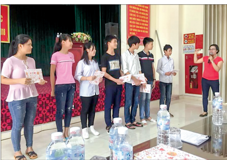
Cán bộ Chi cục Dân số - KHHGD tỉnh truyền thông công tác dân số cho các em lứa tuổi vị thành niên.

sản cho các nhóm đối tượng, chú trọng sức khỏe sinh sản vị thành niên. Ngành cũng đề xuất UBND huyện duy trì khen thưởng, động viên những thôn làng nhiều năm liền không có trường hợp sinh con thứ ba trở lên... Đặc biệt, chú trọng triển khai các đề án, mô hình