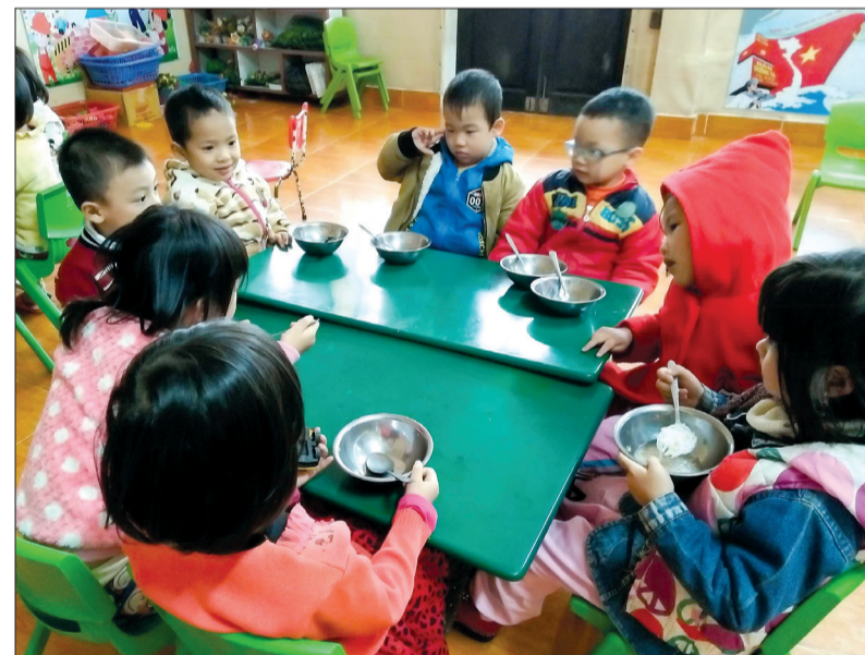
Suất ăn của các cháu Trường Mầm non Hùng Dũng (Hùng Hà) được chia sẻ giờ ăn để không bị nguội.

tượng bị ảnh hưởng lớn nhất của thời tiết lạnh giá là học sinh tiểu học và trẻ mầm non, phòng giáo dục và đào tạo các huyện, thành phố đã chỉ đạo các cơ sở trường học trên địa bàn, nhất là cơ sở giáo dục thuộc các xã đặc biệt khó khăn bám sát diễn biến của thời tiết để chủ động có biện pháp bảo đảm sức khỏe cho học sinh và tiến