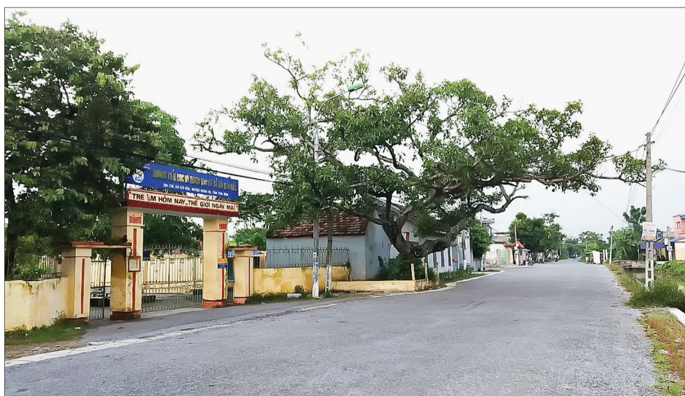
Xã Chí Hòa ngày càng đổi mới.

thúc đẩy chuyển dịch cơ cấu kinh tế nông thôn. Các hoạt động thương mại, dịch vụ ngày càng phát triển đa dạng phục vụ tốt hơn nhu cầu đời sống nhân dân. Cùng với phát triển kinh tế, công tác quản lý đất đai đi vào nền nếp. Công tác quản lý tài chính thu, chi ngân sách được quan tâm lãnh đạo, chỉ đạo thực hiện đúng quy định. Chất lượng giáo dục toàn diện được nâng lên ở tất cả các cấp học, ngành học. Cơ sở vật chất trường lớp được tăng cường. Công tác chăm sóc sức khỏe nhân dân thường xuyên được quan tâm. Cơ sở vật chất kỹ thuật y tế