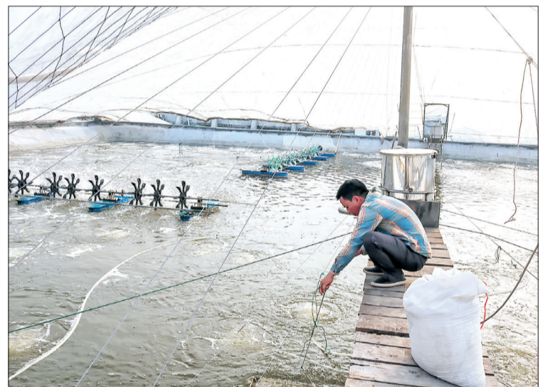
Các hộ nuôi tôm thẻ chân trắng cần che phủ bạt nylon toàn bộ diện tích ao, bể để chống rét cho tôm.