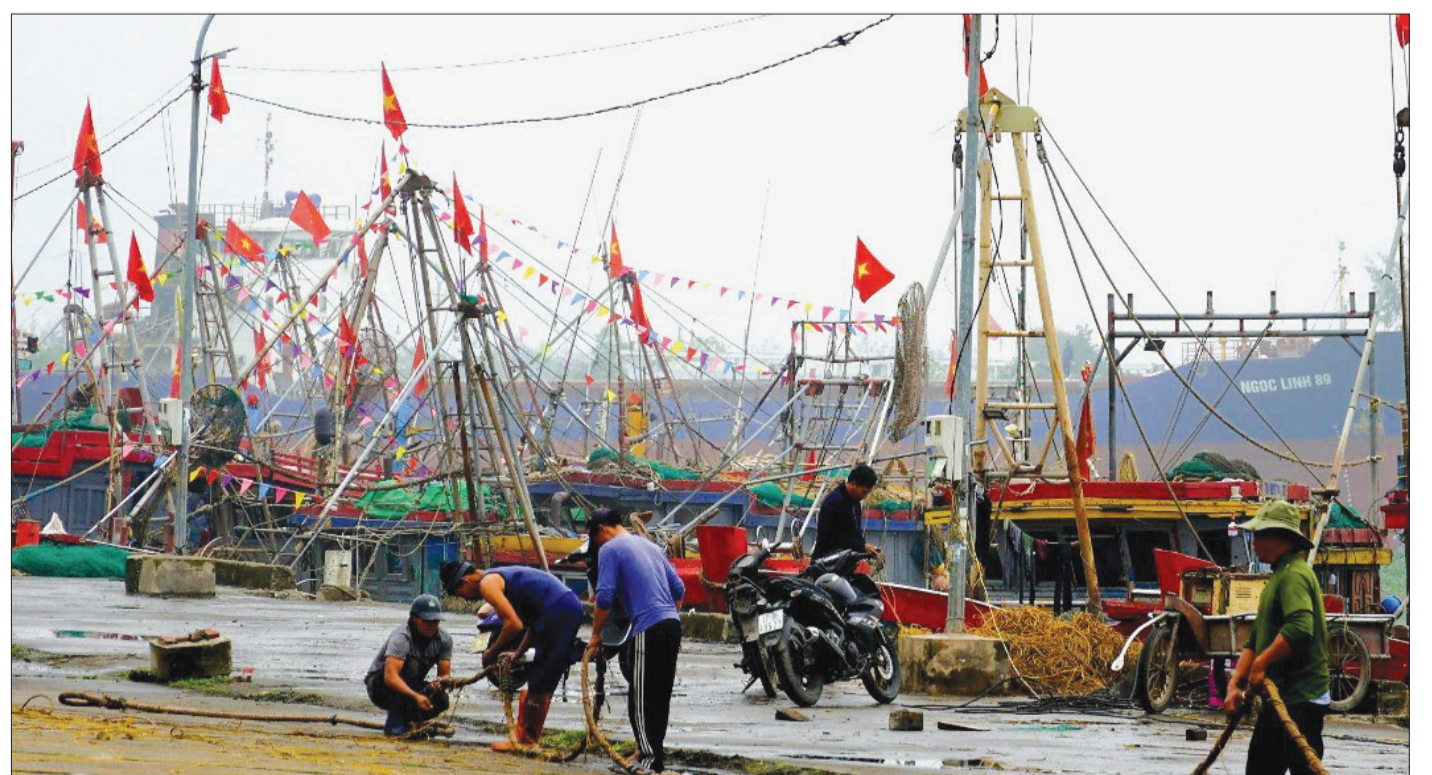
Khu neo đậu tàu thuyền tránh trú bão ở cảng cá Tân Sơn, xã Thụy Hải (Thái Thụy).