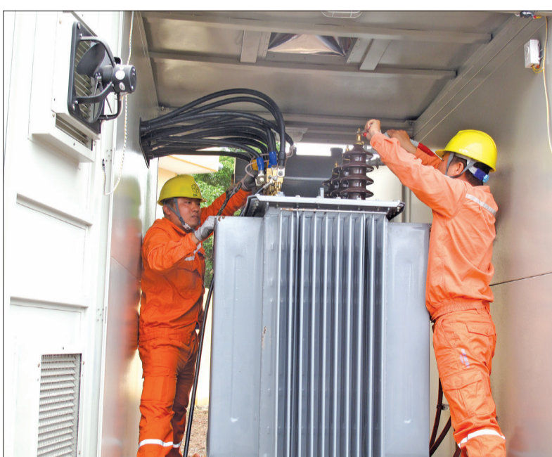
Sửa chữa trạm biến áp.

Những ngày gần đây nắng nóng kéo dài trên diện rộng khiến nhu cầu sử dụng điện tăng đột biến. Sản lượng điện tiêu thụ trên địa bàn thành phố Thái Bình tăng liên tiếp từng ngày, chủ yếu do việc sử dụng điều hòa nhiệt độ và các thiết bị làm mát. Theo Điện lực thành phố, những ngày, qua nhu cầu sử dụng điện tăng trên 20% so với trước đợt nắng nóng. Nếu như tháng 5/2018 sản lượng điện đạt 51,3 triệu kWh thì tháng 6 tăng lên gần 61 triệu kWh. Đặc biệt, trong đợt nắng nóng từ ngày 30/6 đến nay, nhu cầu sử dụng điện tăng cao khiến sản lượng tiêu thụ điện liên tục lập đỉnh qua từng ngày. Do đó, tại một số khu vực trên địa bàn thành phố đã xảy ra tình trạng mất điện cục bộ, nhất là từ 21 giờ đến 24 giờ. Ông Phạm Huy Anh, Giám đốc Điện lực thành phố cho biết: Thời gian qua, tình hình vận hành lưới điện trên địa bàn thành phố khá ổn định, việc cung cấp điện đã đáp ứng kịp thời cho mọi nhu cầu sản xuất công nghiệp, nông nghiệp, các sự kiện chính trị của các địa phương và nhu cầu tiêu dùng sinh hoạt của nhân dân. Từ những trường hợp phải cắt điện để duy tu, bảo dưỡng, thí nghiệm định kỳ đường dây, thiết bị hoặc những trường hợp bất khả kháng do sự cố đường dây, thiết bị nhưng thời gian mất điện không kéo dài. Tuy nhiên, do thời tiết nắng nóng bất thường không theo các quy luật chung,