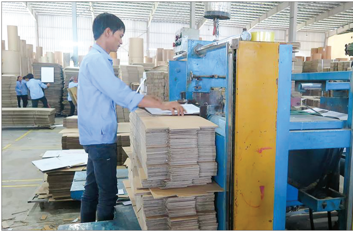
Các doanh nghiệp phát triển đã tạo nguồn thu lớn cho ngân sách nhà nước. Trong ảnh: Dây chuyền sản xuất của Công ty TNHH Bao bì Hương Sen.

Đóng góp tích cực vào tăng trưởng kinh tế trong những tháng đầu năm phải kể đến ngành Công Thương. Tổng giá trị sản xuất công nghiệp đạt mức tăng trưởng 21,5%, cao hơn nhiều so với kế hoạch năm (15,8%) và cùng kỳ năm 2017 (11,9%), các ngành công nghiệp ngày càng tạo ra nhiều giá trị gia tăng cho nền kinh tế với GRDP khu vực công nghiệp tăng 35,7% là những kết quả nổi bật ngành Công Thương đạt được trong 6 tháng đầu năm 2018. Cùng với việc tham mưu UBND tỉnh phát động các doanh nghiệp ra quân thi đua đẩy mạnh sản xuất ngay từ đầu năm, tổ chức gặp mặt, tháo gỡ khó khăn cho doanh nghiệp trên địa bàn, ngành Công Thương còn hỗ trợ, tạo điều kiện để các dự án đầu tư lớn, trọng điểm trên địa bàn tỉnh hoạt động ổn định. Bên cạnh đó, toàn ngành còn thực hiện có hiệu quả công tác khuyến công, khuyến thương và kế hoạch xúc tiến thương mại, chương trình đưa hàng Việt về nông thôn; đồng thời, chủ động thực hiện các giải pháp nhằm cải thiện môi trường đầu tư, kinh doanh, tạo điều kiện thuận lợi cho các doanh nghiệp, dự án phát triển. Chính vì thế, nhiều sản phẩm công nghiệp tăng cao như: tôm đông lạnh tăng 88,7%, sứ vệ sinh tăng gấp hơn 2 lần, dệt may tăng 25%, gốm sứ và linh kiện điện tử tăng 32%, nitrat amoni tăng 41,2%, nhựa polyme tăng 83%... Trên lĩnh vực sản xuất nông nghiệp, mặc dù còn gặp nhiều khó khăn nhưng với sự chỉ đạo sâu sát, kịp thời của các cấp ủy đảng, chính quyền địa phương nên nhiều chỉ tiêu vẫn đạt và