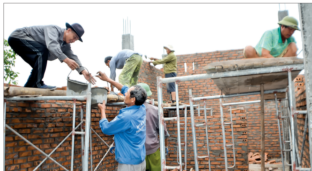
Xây mới nhà ở cho người có công tại xã Đông Hoàng (Tiền Hải).

Thực hiện Quyết định số 22, ngày 15/11/2013, UBND tỉnh đã ban hành Quyết định số 2521/QĐ-UBND phê duyệt đề án hỗ trợ nhà ở cho người có công với cách mạng (đề án 22). Sau gần 5 năm triển khai thực hiện, đến ngày 30/9/2018, theo báo cáo của Sở Lao động - Thương binh và Xã hội, toàn tỉnh có 14.580 hộ NCC đã được hỗ trợ xây dựng nhà ở trong tổng số 25.830 hộ theo Quyết định số 22, đạt 56,45% kế hoạch, trong đó giai đoạn 1 (2013 - 2015) toàn tỉnh đã hoàn thành hỗ trợ 2.716 hộ (1.889 hộ xây mới, 827 hộ sửa chữa) với tổng số tiền đã hỗ trợ 119.260 triệu đồng. Giai đoạn 2 (2015 - 2018), tổng số hộ còn lại của đề án là 23.114 hộ (13.917 hộ xây mới, 9.197 hộ sửa chữa). Để triển khai hỗ trợ xây dựng nhà ở cho những hộ còn lại, thời gian qua, ngành Lao động - Thương binh và Xã hội tích cực phối hợp với các cấp, các ngành, các địa phương trong tỉnh đẩy mạnh công tác tuyên truyền, phổ biến chủ trương, chính sách của Đảng, Nhà nước và của tỉnh về hỗ trợ cải thiện nhà ở cho NCC đến các tầng lớp nhân dân; tăng cường giám sát tổ chức thực hiện ở các địa phương để kịp thời phát