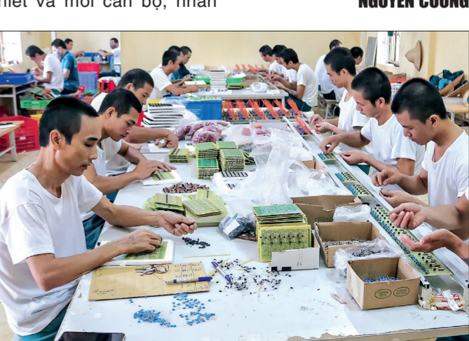
Ngày nghề gia công điện tử cho học viên.