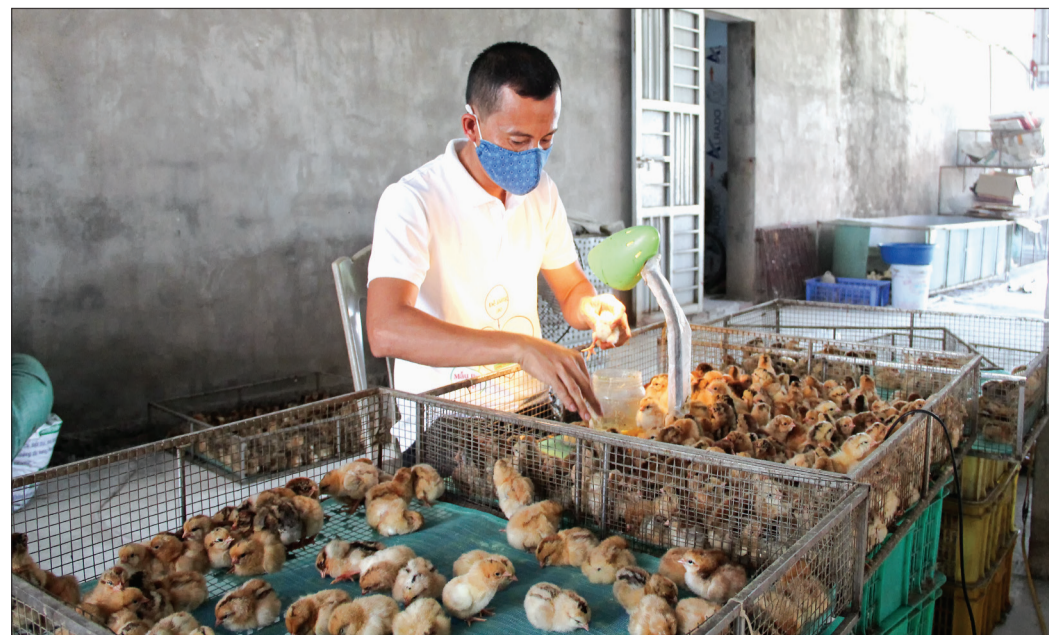
Trung bình mỗi tháng HTX chăn nuôi xanh Thái Bình cung cấp khoảng 4 vạn con giống.