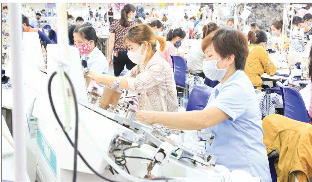
Hoạt động sản xuất tại nhà máy may Đô Lương (Công ty Cổ phần Đô Lương).