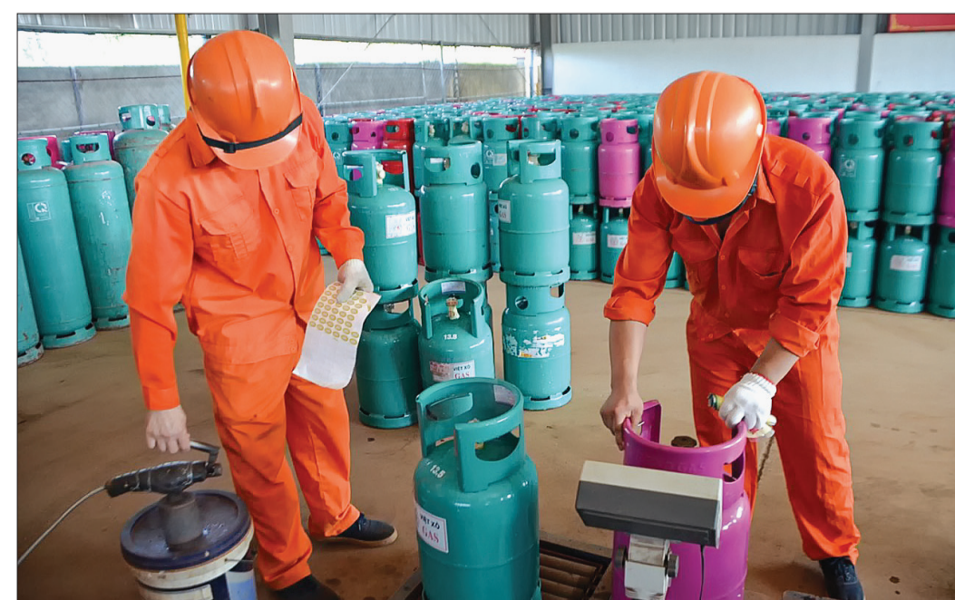
Hoạt động sản xuất tại Công ty Cổ phần Việt Xô gas (khu công nghiệp Phúc Khánh, thành phố Thái Bình).