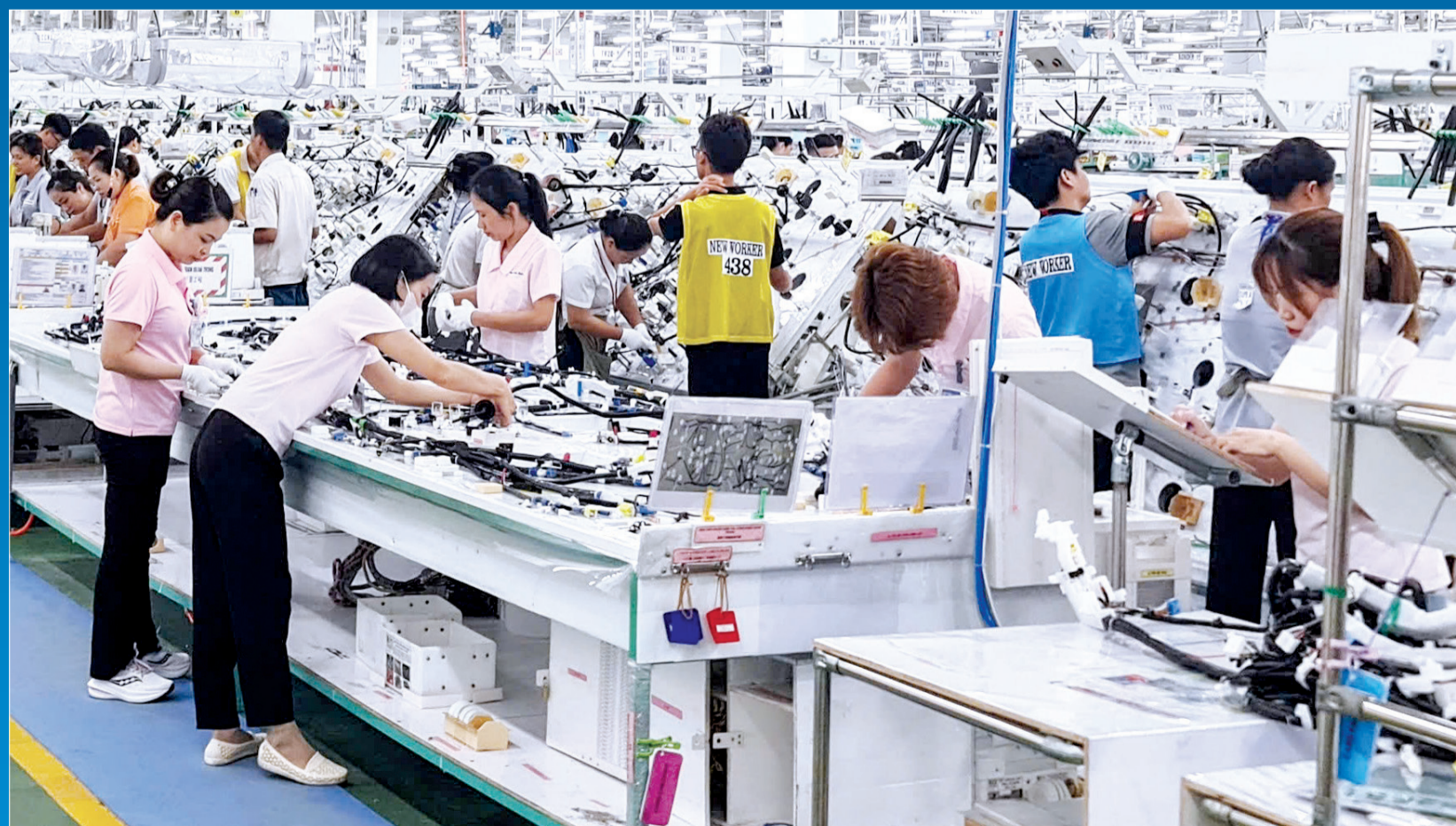
7 tháng năm 2024, tổng thu thuế xuất, nhập khẩu của tỉnh đạt gần 170 tỷ đồng. Trong ảnh: Hoạt động sản xuất tại Công ty TNHH Yazaki Hải Phòng Việt Nam Chi nhánh Thái Bình.