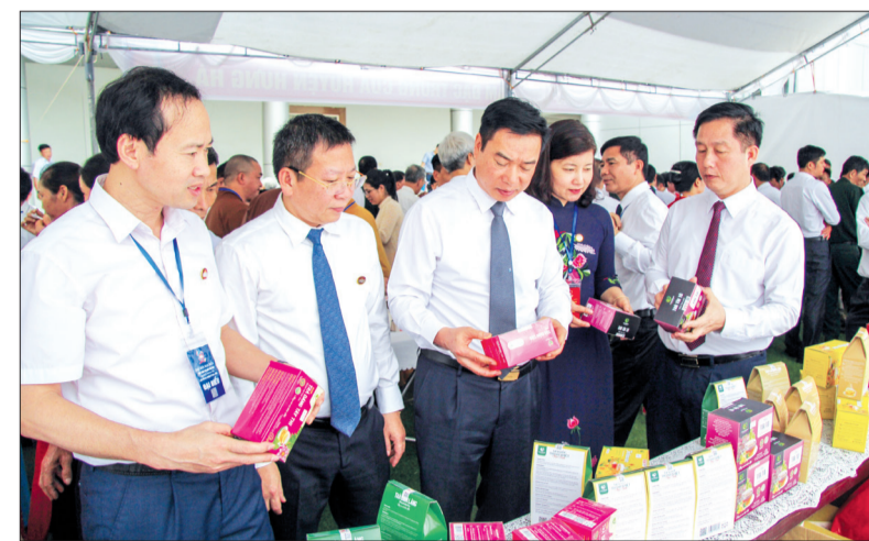
Các đồng chí lãnh đạo tỉnh và huyện Hưng Hà tham quan gian hàng trưng bày sản phẩm OCOP tại Đại hội.