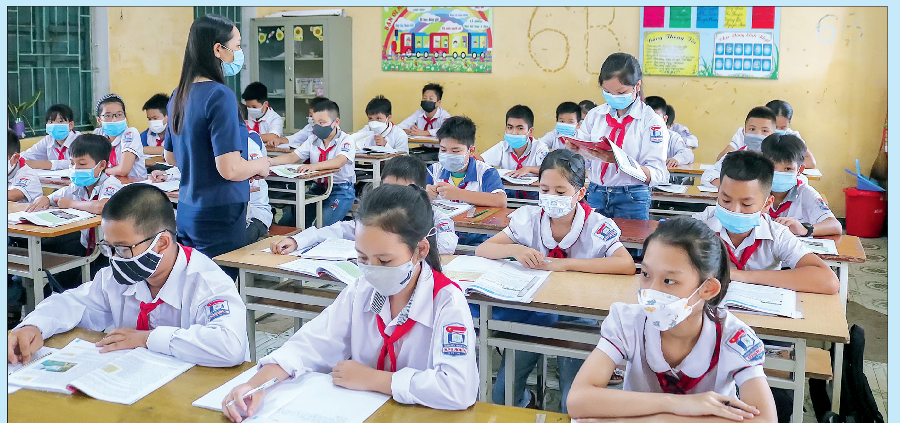
Đội ngũ cán bộ, giáo viên ngành Giáo dục Thái Bình đã phát huy vai trò, trách nhiệm trong việc duy trì, giữ vững chất lượng giáo dục trong bối cảnh chịu tác động của dịch Covid-19.