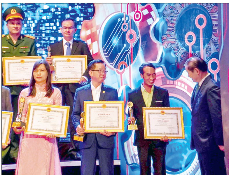
Nhóm tác giả đề tài nghiên cứu của ThaiBinh Seed nhận giải thưởng.

Công ty Cổ phần Tập đoàn ThaiBinh Seed (ThaiBinh Seed) vừa giành giải nhì hội thi sáng tạo kỹ thuật toàn quốc lần thứ 16 với công trình "Nghiên cứu chọn tạo giống ngô dẻo ngọt TBM18 năng suất cao, chất lượng tốt phục vụ sản xuất". Công trình nghiên cứu được thực hiện từ năm 2008 đến năm 2020, trong đó từ