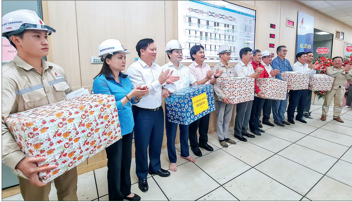
Các đồng chí lãnh đạo tỉnh tặng quà, chúc mừng cán bộ, công nhân Nhà máy nhiệt điện Thái Bình 2.

Theo Ban Quản lý dự án điện lực đầu tư Thái Bình 2, đến nay tiến độ tổng thể của dự án đạt hơn 93%, trong đó thiết kế đạt 99,9%, mua sắm đạt gần 98%, công tác chạy thử 40%, thi công xây lắp đạt gần 94%. Việc hoàn thành các mốc tiến độ quan trọng: đốt dầu lần đầu tổ máy số 1 và mốc hòa đồng bộ bảng đầu tổ máy số 1 vào lưới điện quốc gia là nỗ lực rất lớn của Tập đoàn, Ban Quản lý dự án, tổng thầu và các nhà thầu phụ đã tập trung cao độ, huy động mọi nguồn lực đẩy nhanh tiến độ xây dựng, lắp đặt, chạy thử nghiệm, đồng thời thực hiện nhiều giải pháp để tháo gỡ những khó khăn, vướng mắc của dự án. Đặc biệt, dự án được sự quan tâm chỉ đạo sát sao của Chính phủ, các bộ, ngành trung ương và sự hỗ trợ tích cực của UBND tỉnh Thái Bình giúp nhà máy "hồi sinh" nhanh chóng. Nhân dịp này, Tập đoàn Dầu khí Việt Nam đã khen