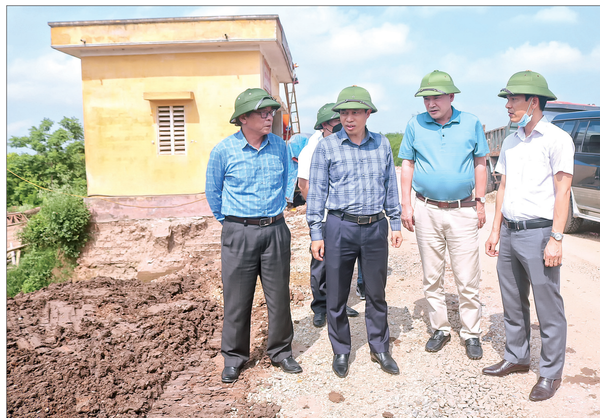
Đồng chí Lại Văn Hoàn, Tỉnh ủy viên, Phó Chủ tịch UBND tỉnh kiểm tra tiến độ thi công công Đê Bàn (huyện Đông Hưng).

Trước đó, đồng chí Phó Chủ tịch UBND tỉnh đã kiểm tra khu vực kè Hoa Nam trên tuyến đê tả Trà Lý, đang theo dõi sạt lở tại địa phận xã Liên Hoa, huyện Đông Hưng. Theo đó, tại vị trí K16+850 phần cơ kè bị sạt dài 8,5m, đỉnh cung sạt ở cao trình +0,90, chân cung sạt ở cao trình -8,80; nếu không được xử lý kịp thời có khả năng sạt lở tiếp cơ, mái kè gây mất an toàn cho công trình đê điều. Đồng chí Phó Chủ tịch UBND tỉnh yêu cầu huyện Đông Hưng trước mắt tập trung xử lý giờ đầu, chống sạt lở cho mái, cơ kè để nhằm bảo vệ an toàn công trình đê điều; tiếp tục theo dõi diễn biến vị trí sạt lở để có phương án xử lý kịp thời, bảo đảm an toàn công tác phòng, chống lụt bão khi mùa mưa bão đang đến gần.